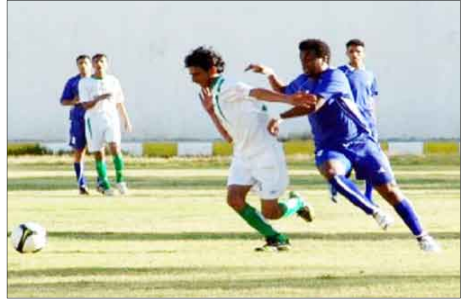
من مباراة أمس بين وحدة صنعاء وشباب البيضاء

صنعاء / سبأ: انتزع الصاعد من جديد إلى دوري الأضواء أهلي تعز فوراً مضيماً خارج قواعد من أنياب مضيق اليرموك بهدف وحيد في المباراة التي جرت بينهما أمس على ملعب شعب صنعاء في انطلاق منافسات الجولة الثانية لدوري أندية الدرجة الأولى لكرة القدم.