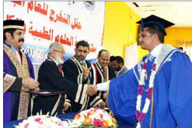
جامعة العلوم والتكنولوجيا / حفل تخرج