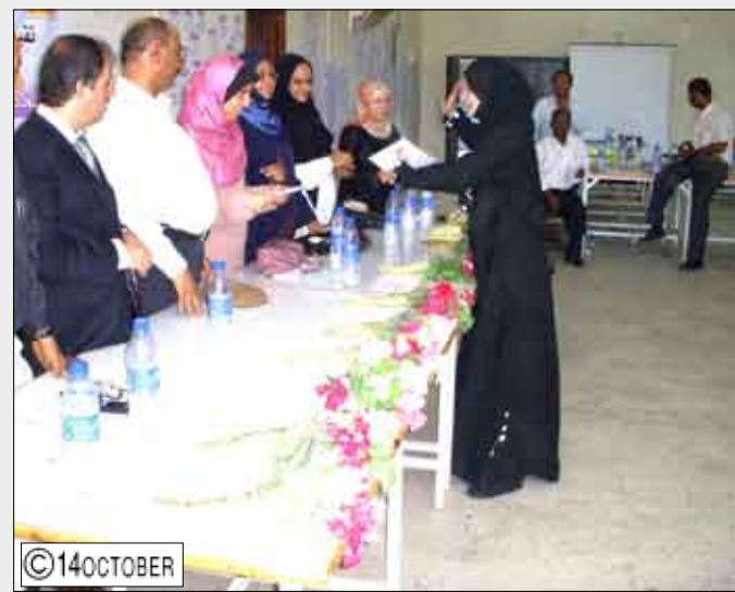
توزيع الشهادات على الخريجين