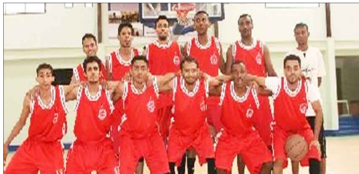
فريق التلال لكرة السلة

فيما تمثل هذه الجولة استراحة لفريق شعب حضرموت الذي لن يلعب أي مباراة .