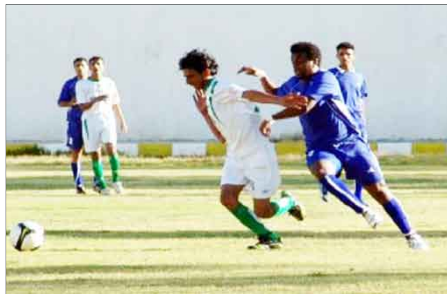
من مباراة أمس بين وحدة صنعاء وشباب البيضاء

ويحل شعب إب 3 نقاط في المركز السادس ضعفاً ثقيلًا على الجريح وحدة عدن من دون نقاط في الترتيب الثالث عشر ، بينما يخوض الصقر 3 نقاط في المركز الخامس مباراة سهلة نسبياً في ملعبه ووسط جمهوره أمام ضيفه القادم من وادي حضرموت سلام الغرفة نقطة واحدة في الترتيب العاشر.