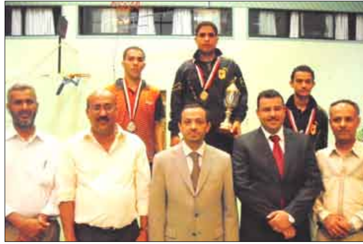
لحظة تكريم الأبطال