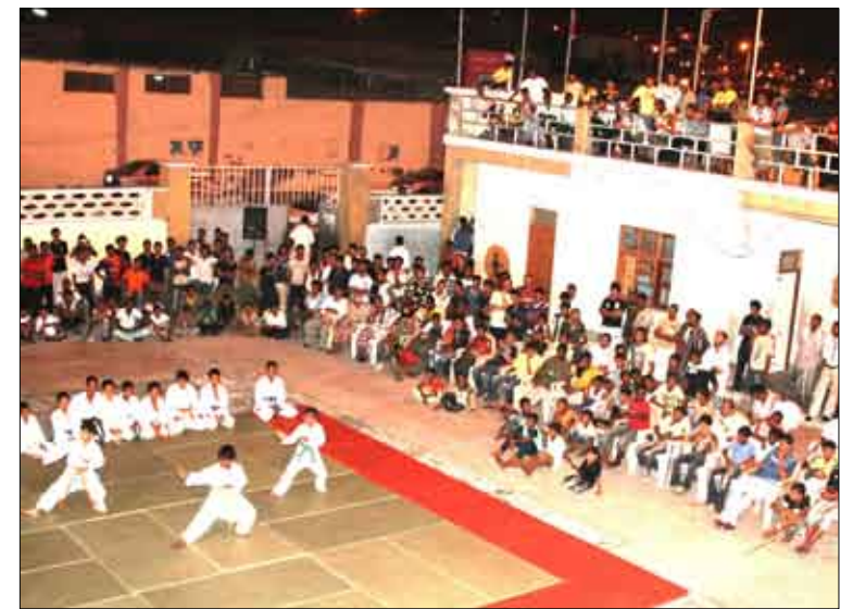
استعراض (مقاتلي) شمسان الصغار

وأضاف: «نحن نسعى في الفترة القادمة إلى إيجاد راع لكل لعبة في النادي حتى نحقق لها الرعاية الكاملة في كافة متطلباتها واستحقاقاتها بما يمكنها من السير قدماً في طريق المنافسات والبطولات والنجاح... وتتمنى أن يكون الجهد في توفير الدعم المالي للأنعاب يقابله جهد أكبر من قبل هذه الألعاب». وخلال الفترة القادمة سنقدم اهتماماً خاصاً لفريق كرة القدم الممتاز وسوف نعمل معاً لتأهله إلى الدرجة الأولى». وأشار الرئيس الفخري لنادي شمسان إلى ضرورة إعادة النظر في العقود الاستثمارية للنادي وفق ما أكده العديد من القانونيين الذين قالوا أن هناك (غيباً) في هذه العقود إلى جانب أن وزارة الشباب والرياضة وبعد اطلاعها على هذه العقود قد وجهت الإحوسة في قيادة المحافظة برفض هذه العقود وإعادة النظر فيها وفقاً للقانون التجاري. ودعا الرئيس الفخري لنادي شمسان كافة أبناء النادي وشخصياته الاجتماعية إلى العمل معاً من أجل تحقيق كافة الأهداف التي يتشدها منتسبوه.