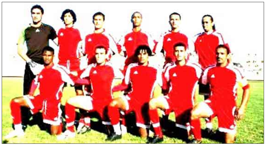
المنتخب الوطني الأول لكرة القدم

مناسبة لخوض الاستحقاقات الودية القادمة إضافة إلى تجريب الوجوه الجديدة في المنتخب. وتشكل المبارتان الوديات للمنتخب الوطني بنظر مدربه ستريشكو أهمية كبيرة لمعرفة قدرات وإمكانات اللاعبين فضلاً عن مواصلة تطبيق طريقة اللعب الجديدة التي أعلن الجهاز الفني للمنتخب تنفيذها لإحداث التغيير في أسلوبه السابق. وكان الجهاز الفني الجديد بقيادة الكرواتي ستريشكو استهل مرحلة الإعداد للاستحقاقات الكروية المقبلة في منتصف شهر يوليو الماضي، تخللها إقامة معسكر خارجي بمدينة اسطنبول التركية خلال الفترة من 2 إلى 20 أغسطس الماضي خاض خلاله أربع مباريات ودية مع فرق محلية باسطنبول إضافة لفريق إماراتي فاز في ثلاث منها وتعادل في واحدة.