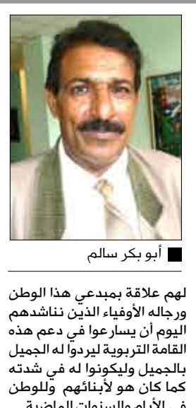
أبو بكر سالم