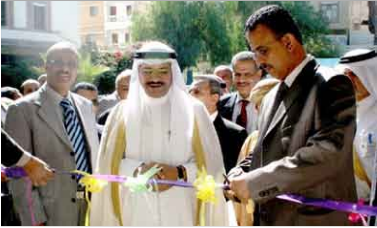
■ افتتاح معرض مواد البناء المستخدمة في المباني المستخدمة