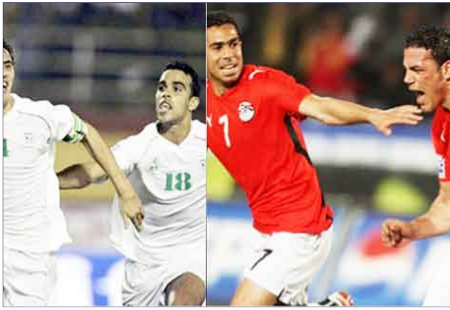
صورة للاعبين من مصر والجزائر

المرضى المستدعى من قبل الاتحاد الذي يمثله بحسب جنسيته أن يوافق، بحال طلب الاتحاد المعني، على إجراء فحص طبي من قبل طبيب يختاره هذا الاتحاد. وبحال أراد اللاعب، يمكن أن يجري الفحص على أرض الاتحاد المسجل فيه (وبحالة رونالدو، في مدريد)". وكان رونالدو حامل الكرة الذهبية، قدم إلى صفوف ريال مدريد مطلع الموسم الحالي من مانشستر يونايتد الإنكليزي مقابل 94 مليون يورو (وهو رقم قياسي).