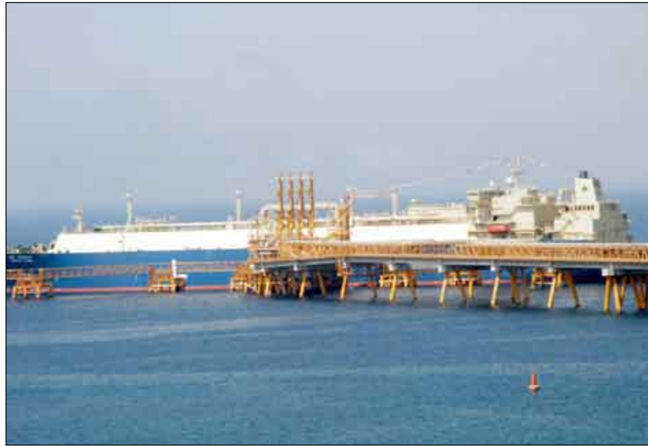
■ ميناء بلخاف لتصدير الغاز

أكد انعم: أن فخامة الأخ / علي عبد الله صالح رئيس الجمهورية كان قد أولى جل اهتمامه على المستوى الشخصي والرسمي متابعة تنفيذ مشروع تصدير الغاز منذ وقت مبكر وقد مثل ذلك دافعا أساسيا في نجاح وتنفيذ المشروع الاقتصادي الكبير وقال لولا جهود ومثابرة رئيس الجمهورية ومثابرة الملحة لخطوات تنفيذ هذا المشروع بعد توفيق الله سبحانه وتعالى لما كان مالم هو كائن اليوم لافتنا إلى أن مشروع تصدير الغاز اليمني المسال يمثل إنجازا اقتصاديا عظيما يضاف إلى سجل فخامة الأخ الرئيس علي عبدالله صالح موحد اليمن وحادي نهضته الاقتصادية والتنموية.