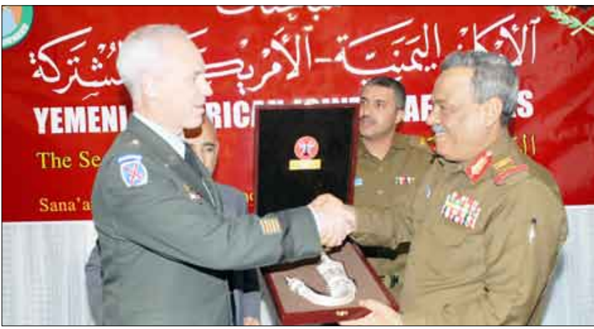
تبادل الهدايا بعد ختام المباحثات اليمنية الأمريكية المشتركة في صنعاء