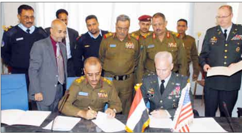
التوقيع على اتفاقية تعاون وتبادل للخبرات والتدريب والتأهيل في المجال العسكري والأمني بين جيشي البلدين الصديقين.