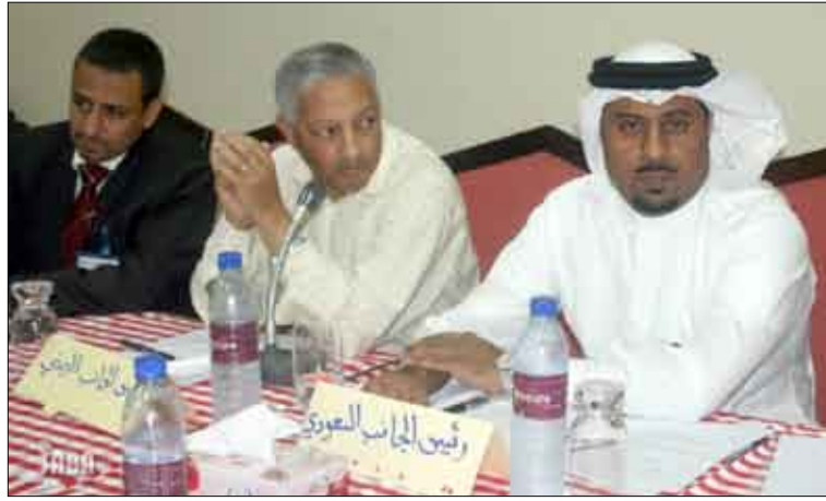
■ الاجتماع السابع لمسؤولي المنشآت التعليمية

خدماتها التربوية والاجتماعية. وشدد على ضرورة مناقشة هذا المجال من جميع جوانبه من خلال إجراء أوراق العمل المطروحة والخروج بتصورات وآليات عمل تعين متخذ القرارات في وزارات الدول الأعضاء في اعتماد أنماط متطورة جديدة وحديثة في المنشآت التعليمية. وعقب جلسة الافتتاح زار المشاركون في الاجتماع معرض مواد البناء المستخدمة في المباني المدرسية بالجمهورية اليمنية. وينتظر من الاجتماع الخروج اليوم الأربعاء بقرارات وتوصيات تفيد أصحاب القرا رفي المؤسسات التعليمية بالدول الأعضاء .