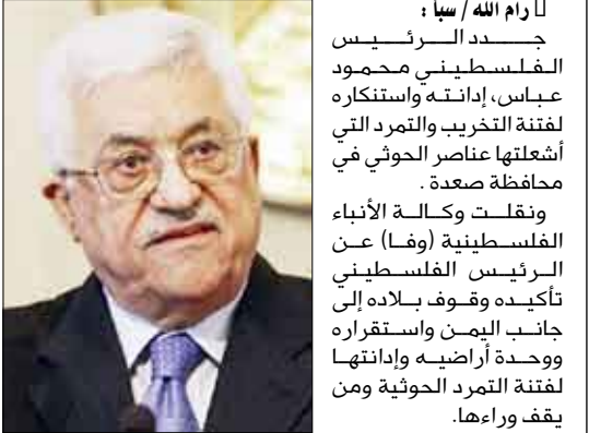
رئيس الجمهورية يبحث في اتصال هاتفي مع نظيره المصري بالتعاون بين البلدين