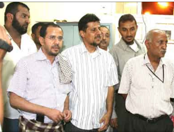
الحاضري محاطا بقيادة نادي شمسان وأناصره