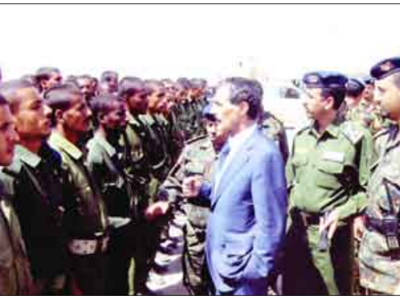
وزير الداخلية خلال تفقده المستجدين