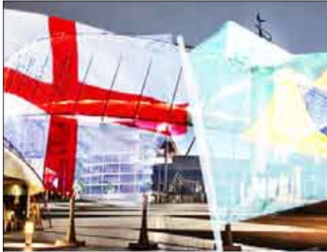
علماء البلدين في شوارع الدوحة

ويأتي هذا اللقاء الودي المرتقب في إطار الاستعدادات النهائية للمنتخبين العريقين لخوض غمار منافسات نهائيات كأس العالم لكرة القدم في جنوب إفريقيا العام المقبل.