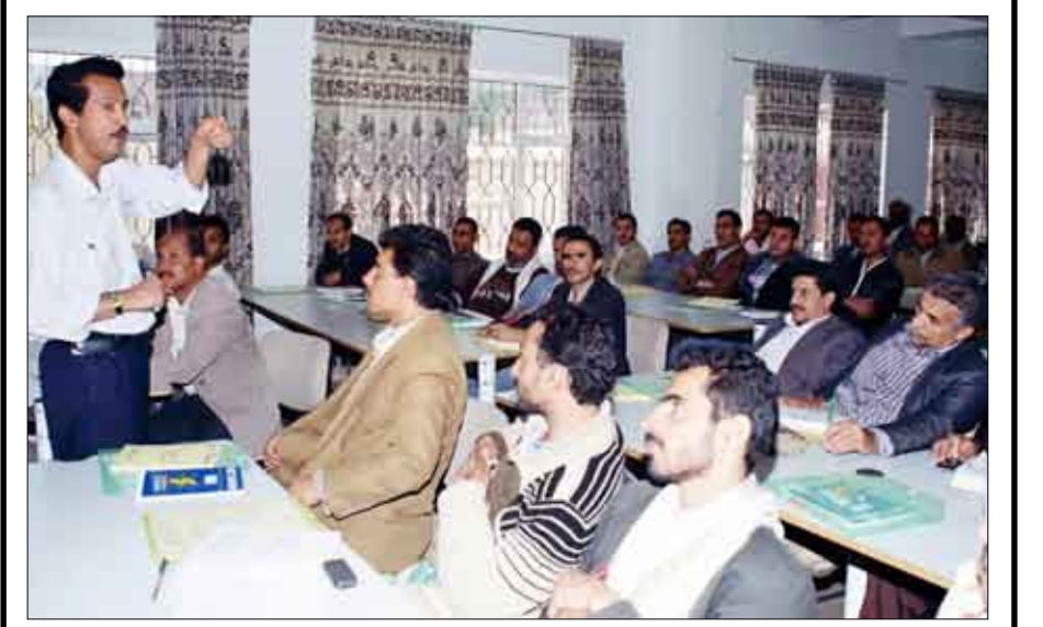
■ تدشين الأعمال الميدانية لعمالة الأطفال