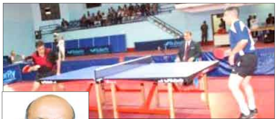
من منافسات كرة الطاولة