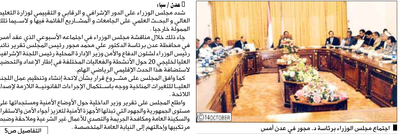
اجتماع مجلس الوزراء برئاسة د. مجور في عدن أمس