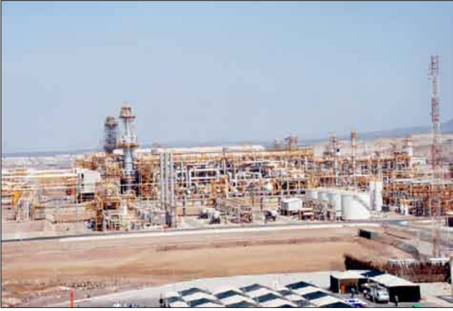
■ منشآت مشروع الغاز الطبيعي المسال في بلخاف