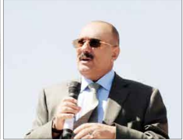
رئيس الجمهورية يلقى كلمة خلال زيارته عددا من معسكرات التدريب للقوات المسلحة