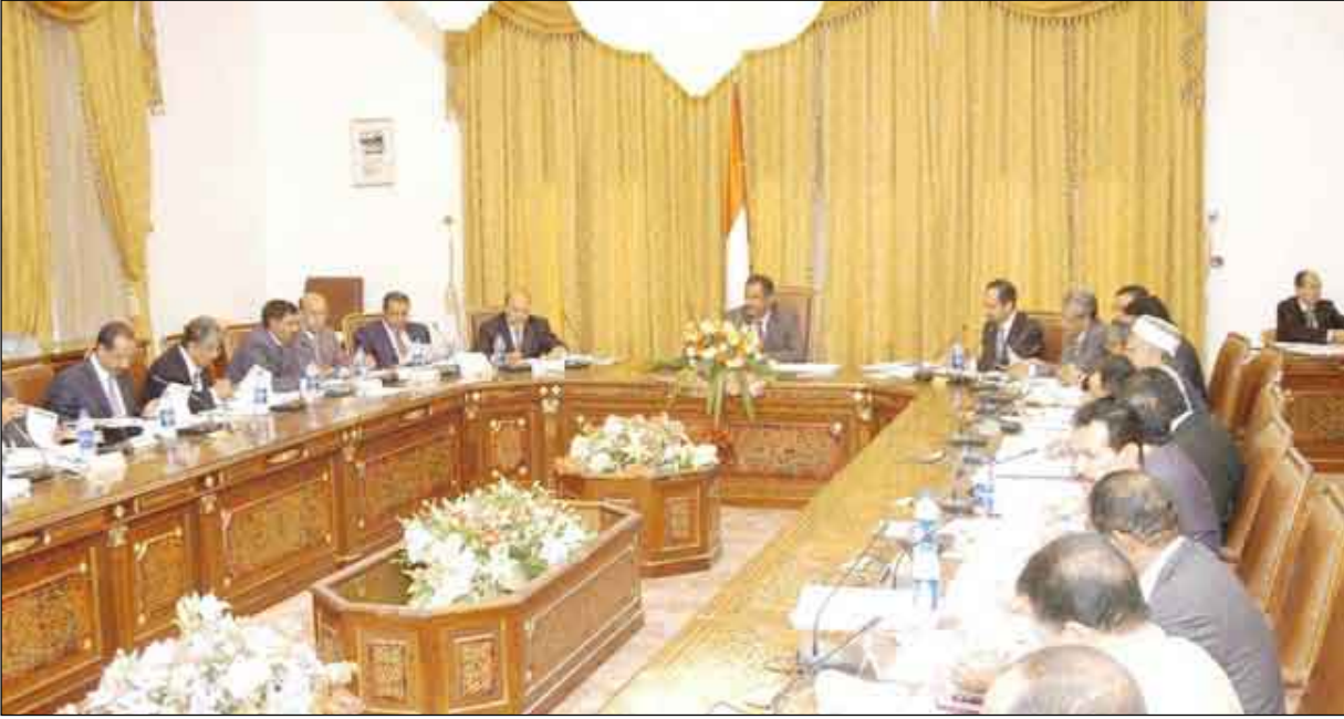
مجلس الوزراء في اجتماعه أمس بعن