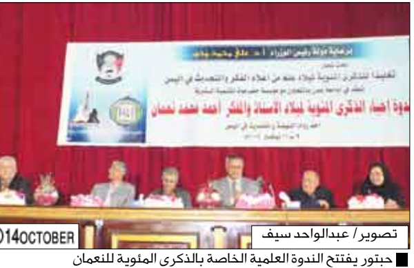
حبتور يفتتح الندوة العلمية الخاصة بالذكرى المئوية للنعمان

عدن / أثمار الوالي : تواصل اليوم بقاعة الفقيه محمد علي لقمان في جامعة عدن أعمال الندوة العلمية الخاصة بإحياء الذكرى المئوية لميلاد الأستاذ والمفكر أحمد نعمان أحد رواد النهضة والتحديث في اليمن والتي بدأت أمس. وتتناول الندوة التي تستمر ثلاثة أيام خمسة محاور رئيسية هي: سيرة حياة الأستاذ أحمد محمد نعمان وتنشئته الاجتماعية، الفكر التجريبي والتنويري والنهوضي للأستاذ أحمد محمد نعمان، والنعمان وقضايا الوحدة والحركة