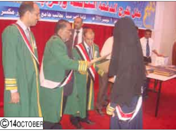
من فعاليات احتفال تخرج عدد من الدفع من جامعة العلوم والتكنولوجيا