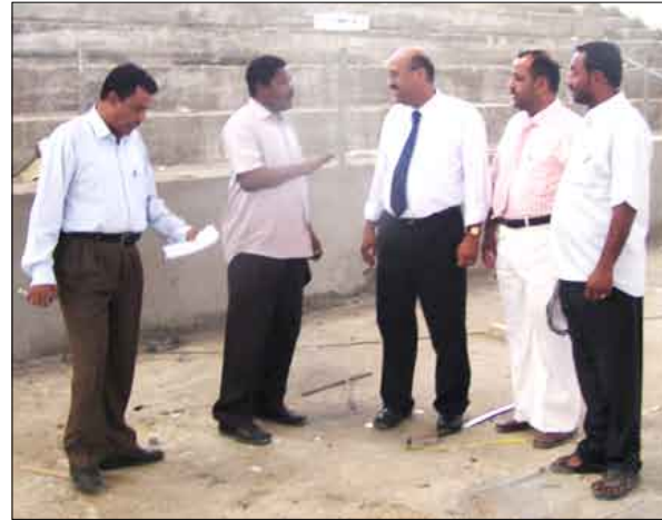
■ اليمني ومرافقوه اثناء الزيارة