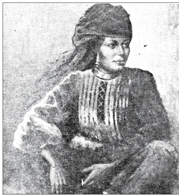
لوحة بائعة الرمان للفنان/عبدالجبار نعمان