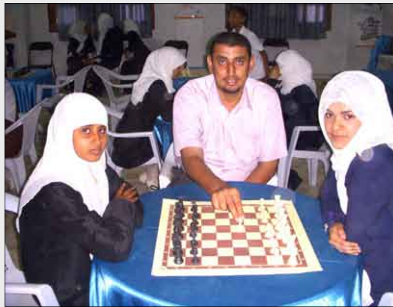
■ ويلعب النقلة الأولى إيداناً ببدء البطولة