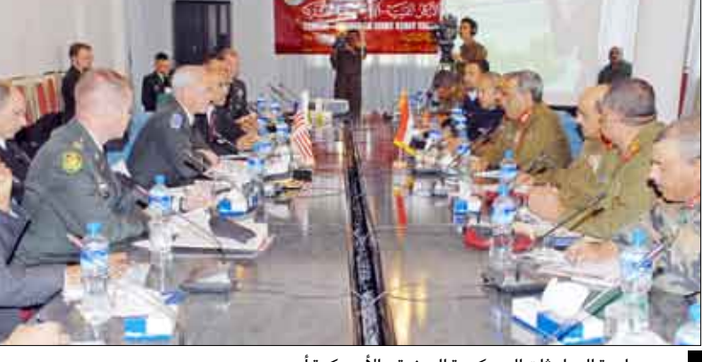
من جلسة المباحثات العسكرية اليمنية - الأمريكية أمس

صنعاء / متابعات : افتتح رئيس هيئة الأركان العامة اللواء الركن أحمد علي الأشول أمس بنادي ضباط القوات المسلحة أعمال الجولة الثانية لمباحثات الأركان اليمنية- الأمريكية المشتركة بمشاركة مدير التخطيط بالأركان المشتركة الأمريكية رئيس الجانب الأمريكي العميد جفري سميث. وفي افتتاح المحادثات التي تستمر يومين رحب رئيس هيئة الأركان العامة بالمشاركين في المحادثات. مؤكداً أهمية هذه الجولة التي تنعقد في وقت تواجه فيه اليمن عدداً من التحديات سواء من قبل عناصر تنظيم القاعدة أو من قبل العناصر الإرهابية الحوثية التي تغلف إرهابها بأفكار دينية مغلوطة.. وأشار رئيس هيئة الأركان العامة إلى الأهمية الجغرافية والسياسية للمنطقة العربية والمتصلة بجيها الإقليمية ودولية واسعة تتطلب توفير أكبر قوة مسلحة لحماية أمنها وأمنها من أخطار القرصنة التي تهددها فضلاً عن الموقع الهام