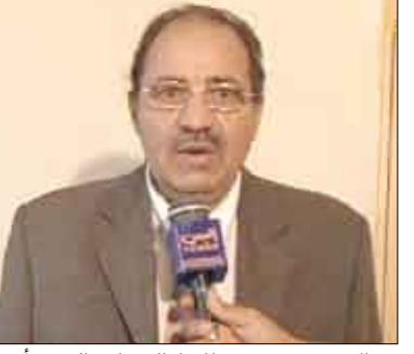
الجندي في تصريح للقناة الفضائية اليمنية أمس

صنعاء / جميل الجعدي / سيا : اطلعت اللجنة العليا للانتخابات والاستفتاء في اجتماعها أمس برئاسة رئيس اللجنة خالد عبدالوهاب الشريف، على تقارير اللجان الأصلية بشأن المرشحين المقبولين للانتخابات ملء في المقاعد النيابية الشاغرة المقرر إجراؤها في الثالث من ديسمبر المقبل. وحسب التقارير، بلغ عدد المرشحين المقبولين ما يقارب 54 مرشحاً، وكلفت اللجنة قطاعي الشؤون القانونية والفنية باستلام محاضر وقرارات اللجان الأصلية بالمرشحين المقبولين واستلام ملفاتهم وفحصها للتأكد من قانونيتها واستيفائها لكافة الشروط وترتيب أسماء المرشحين المقبولين بحسب قيد طلبات الترشيح تمهيداً لإعلانها عبر وسائل الإعلام الرسمية بالتنسيق مع قطاع الإعلام والتوعية الانتخابية. كما كلفت اللجنة المركز الرئيسي للاتصال