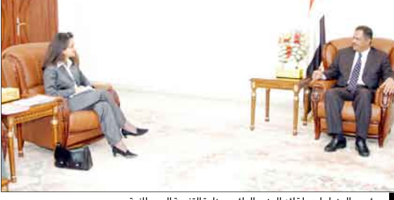
رئيس الوزراء لدى لقائه الوزير الدائم بوزارة التنمية البريطانية

صنعاء / سيا : ناقش رئيس مجلس الوزراء الدكتور علي محمد مجور أمس بصنعاء مع الوزير الدائم بوزارة التنمية الدولية البريطانية السيدة نعمت شفيق علاقات التعاون بين اليمن وبريطانيا في المجالين الاقتصادي والتنموي وتوجهاتها القائمة بما في ذلك الجوانب المتعلقة بأجنحة الإصلاحات الوطنية والأولويات العشر المقررة من قبل الحكومة للفترة الراهنة والمقبلة. وتطرق اللقاء إلى الآثار الإنسانية للفننة التي أشعلتها عناصر التمرد والإرهاب والتخريب في بعض مناطق محافظة صعدة وحرف سفیان وسفیان والجهود التي تقوم بها الحكومة لاستقبال وإيواء النازحين وتقديم الخدمات الإنسانية المختلفة لهم في المخيمات الأربعة القائمة في محافظات حجة وعمران والجوف وصعدة والتنسيق القائم مع المنظمات الدولية المعنية بهذا الشأن. وأوضح رئيس الوزراء أثناء اللقاء المحادثات الرئيسية للأولويات العشر