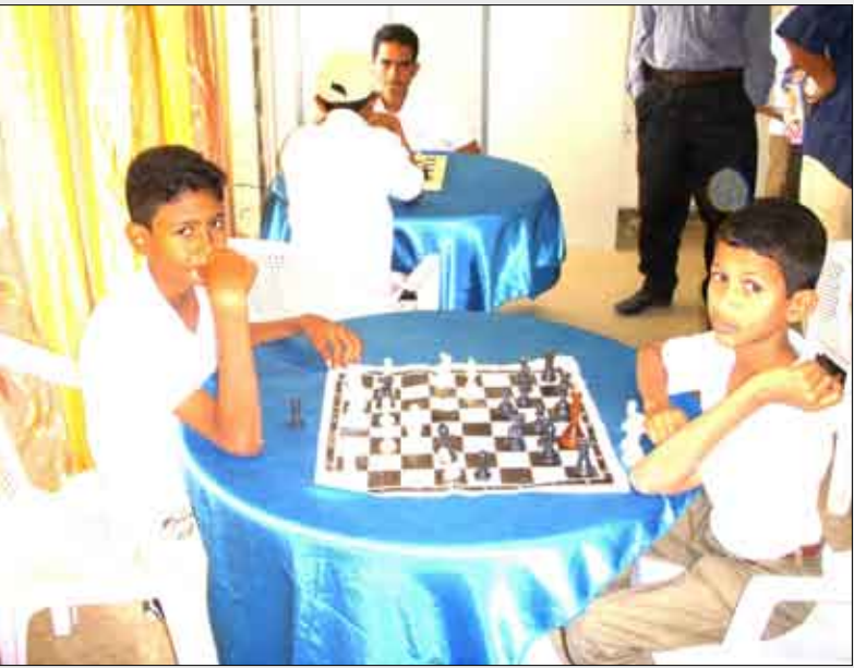
■ لقطة من مباريات البطولة