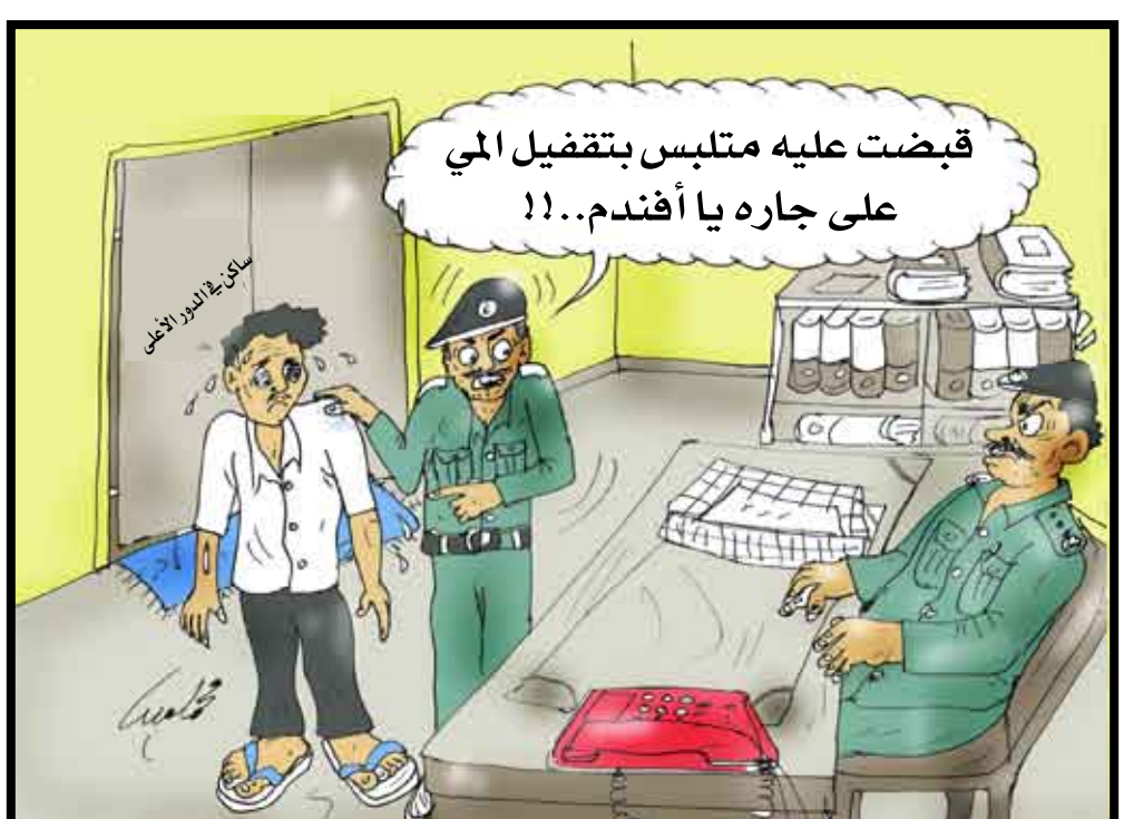
قبضت عليه متلبس بتفضيل المي على جاره يا أفندم..!!