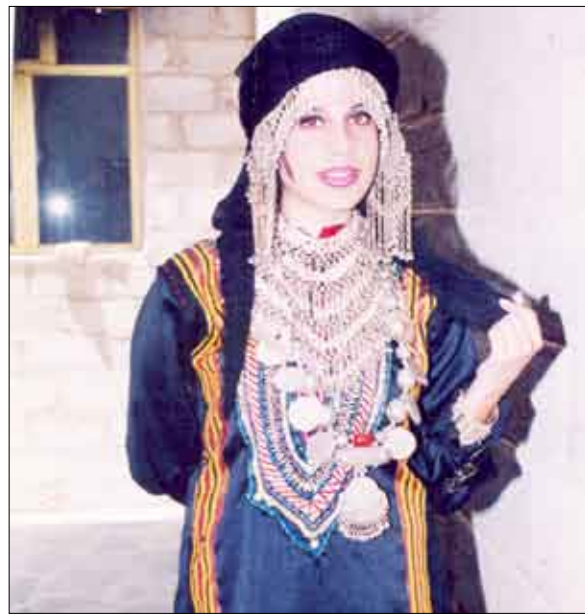
لوحة للزبي الشعبية للطالبة/ منى المنوكل