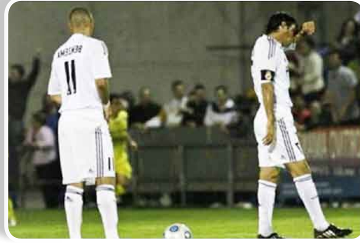
■ آثار خسارة الذهاب بادية على الوجوه

وقال كاكا صاحب هدف رائع في مرمرى أتلتيكو مدريد السبت الماضي افتتح به النتيجة (3 - 2): "من أجل