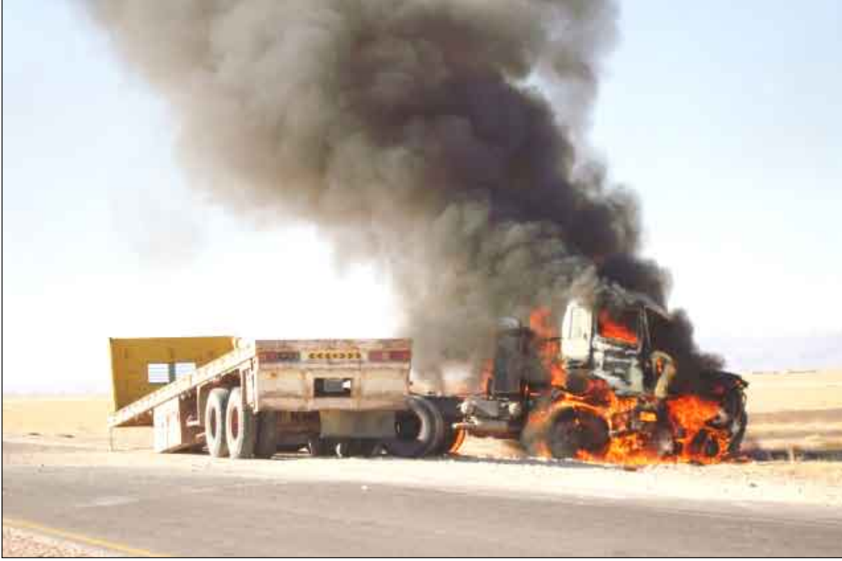
حادث العبر الذي أدى إلى وفاة العمري وباوزير

استنكرت قيادة السلطة المحلية على صعيد محافظة حضرموت عامة، وأعضاء المجالس المحلية والشخصيات الاجتماعية والثقافية والمشايخ والعلماء والمواطنين بمديريات وادي وصحراء حضرموت خاصة، الحادث الإجرامي والإرهابي الشنيع الذي ارتكب الثلاثاء الماضي في وضح النهار على طريق خشم العين بوادي وصحراء حضرموت وراح ضحيته خمسة من خيرة قادة وجنود الأمن بالوادي والصحراء وهم العميد علي سالم العامري مدير عام أمن الوادي والصحراء والعميد أحمد أبوبكر باوزير مدير الأمن السياسي والرقيب صالح سالم بن كوير مدير البحث بمديرية القطن والجنديان زكي عرفان حبيش ورامي علي الكثيري ..