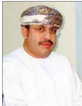
سعيد بن محمد الشكيلي

(حفظه الله) والذي تمكن من أحداث فقرة كبيرة وتاريخية شهدت سلطة عمان في عهده العظيم حيث تحقق للمواطن العماني كل الرفاهية والاستقرار بفضل القيادة الحكيمة لجلالته. وأصبحت عمان اليوم في مصاف الدول العمرانية الكبرى. وأشار سعادته في سياق تصريحه لـ (14 أكتوبر) إلى أن ذكرى العيد الوطني مناسبة غالية على المواطن العماني فقد أسهمت عمان بشكل كبير في دعم الأشقاء في العالم العربي والإسلامي والاهتمام بقضاياهم كما أصبح دورها وتأثيرها السياسي والاقتصادي يساهم في تحقيق التوازن الدولي. ووصف العلاقات اليمنية العمانية بأنها علاقات أخوية قوية نابعة من أرواحهم ووشائج الدم والأرض الواحدة والتاريخ المشترك معبراً عن أرتيحه لما تشهده العلاقات اليمنية - العمانية من تطورات مستمرة بفضل حكمة وفطنة القيادتين الرشيدتين في البلدين الشقيقين ممثلتين بفخامة الرئيس علي عبد الله صالح وأخيه جلاله السلطان قابوس بن سعيد المعظم /حفظهما الله/.