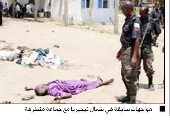
مواجهات سابقة في شمال نيجيريا مع جماعة متطرفة

كانو (نيجيريا) / متابعات : بعد 10 سنوات على تطبيق الشريعة الإسلامية في 12 ولاية تقع شمال نيجيريا، تراجعت الحماسة لتطبيق الشريعة الإسلامية، وتصاعدت الاتهامات منددة بانتهازية الطبيعة السياسية في تلك الولايات، حيث يقول الشيخ أبا كوكي من ولاية كانو والذي ناضل بقوة