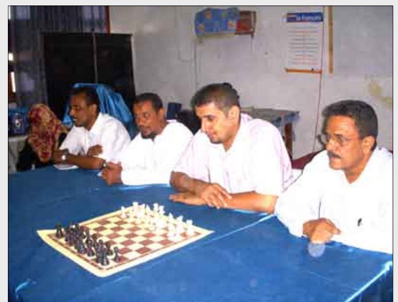
■ مدير المديرية يلقي كلمة الافتتاح