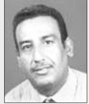
علي منصور مقرات

في الوقت الذي تخوض فيه قواتنا المسلحة والأمن الملاحم البطولية الناجحة ضد عصابة التمرد الإرهابية المجرمة في محافظة صعدة وحرف سفیان وتتوالى الانتصارات الميدانية لتطهير هذه المحافظة من عناصر الشر الباغية الذين ارتكبوا أشنع أنواع الجرائم وأشنعها بحق المواطنين الأبرياء العزل والنساء والأطفال وتخريب المباني الحكومية العامة ونهبها والممتلكات الخاصة بالمواطنين وتشريدهم من منازلهم وقراهم واغتيال العشرات فضلا عن افعالهم العدوانية الجبانة ضد أبناء القوات المسلحة وكثيرا من الأعمال التي يندى لها جبين الإنسانية.. في الوقت ذاته فإن كثيرا من المشاهد الإجرامية المماثلة برزت بشكل مثير ومرور والمحافظة تتصاعد يوما عن يوم في العديد من المحافظات الجنوبية والشرقية التي باتت تحدث هنا وهناك وبشكل يؤكد أن هناك سيناريو لمسلح تامري خطير ضد هذا الوطن ووحدته وأمنه واستقراره ونظامه الجمهوري ومكتسبات الثورة المجيدة يقوده العملاء والخونة من الحوثيين ومعهم أعداء الوحدة ودعاة الانفصال الذين ينفذون أجندة خبيثة لمخططات خارجية دنيئة تستهدف اليمن ومنجزاته المتعاطمة..