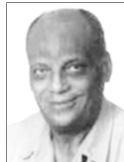
الشاعر عبدالرحمن فخري

في نشاطاته خلال الفترة الماضية الروح الإبداعية التي تتسم بها مدينة عدن، والطاقة الحيوية والخلاقة التي