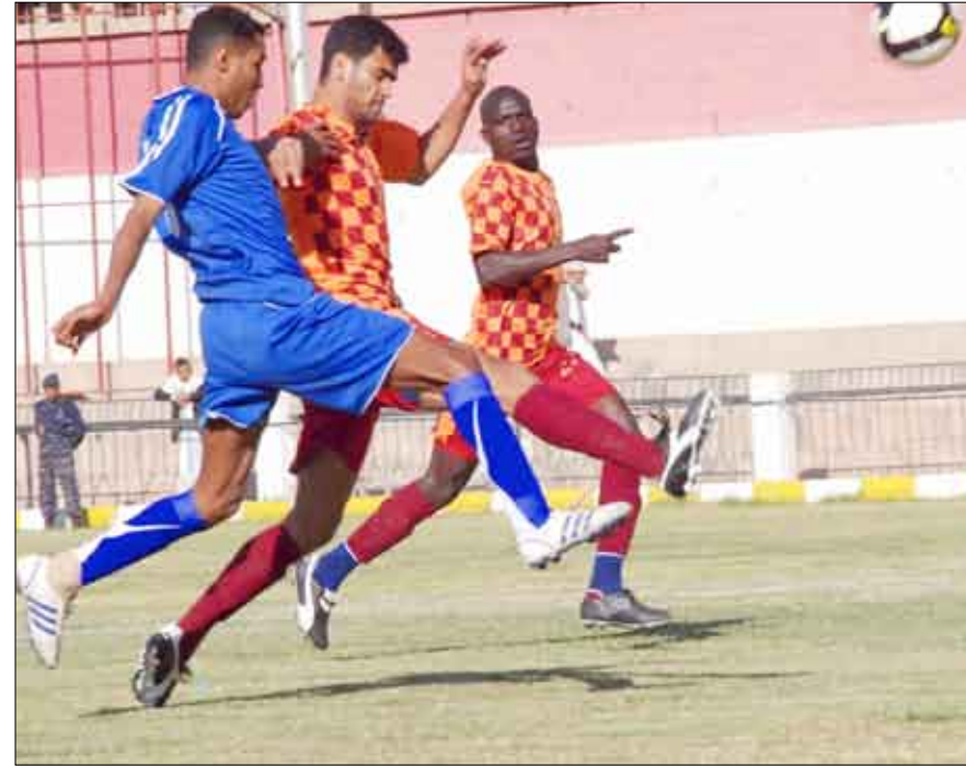
من مباراة العروبة والهلل

لاعبة نجيب الحداد في منتصف شوط المباراة الثاني، يمتلك الشعب أول ثلاث نقاط في بداية مشواره الجولة وتختتم منافسات الجولة الأولى من البطولة اليوم السبت بمباراة تجمع التلال عدن ووحدة صنعاء على ملعب 22 مايو الدولي بإب بعد أن أقرت