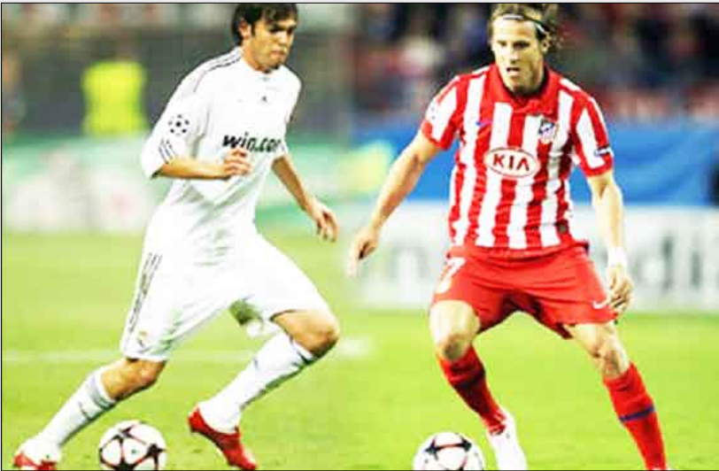
كاكا وفورلان، جهأ لوجه

العائد إلى صفوف فريق العاصمة بعد ثلاثة مواسم قضاها في صفوف ليفربول الإنجليزي، أن تكون المواجهة ضد أتلتيكو مدريد صعبة للغاية، معتبراً بأن البداية السيئة للجار اللود لا تعكس إمكانياته.