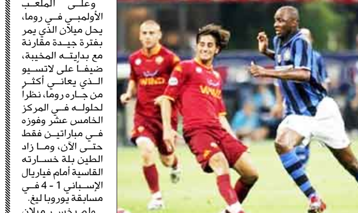
ميلانو/ مباحثات: يستقبل إنتر ميلان المتصدر وحامل اللقب في الأعوام الأربعة الماضية روما الرابع عشر على ملعبه «جورزيني ميانزا» غدا الأحد ضمن المرحلة الثانية عشرة من بطولة إيطاليا، في حين يرد جاره ميلان زيارة فريق العاصمة عندما يحل ضيفاً على لاتسيو في روما.

ويخوض إنتر اللقاء منتشياً من تصدده مجموعته الأوروبية في دوري الأبطال بعد فوز يشق النفس حققه على أرض دينامو كييف الأوكراني 1-2، بهدفين متأخرين للأرجنتيني ديفيدو ميليتو والهولندي ويسلي سنايدر. واللافت أن فوز إنتر كان الأول له في المسابقة بعد ثلاثة تعادلات متتالية.