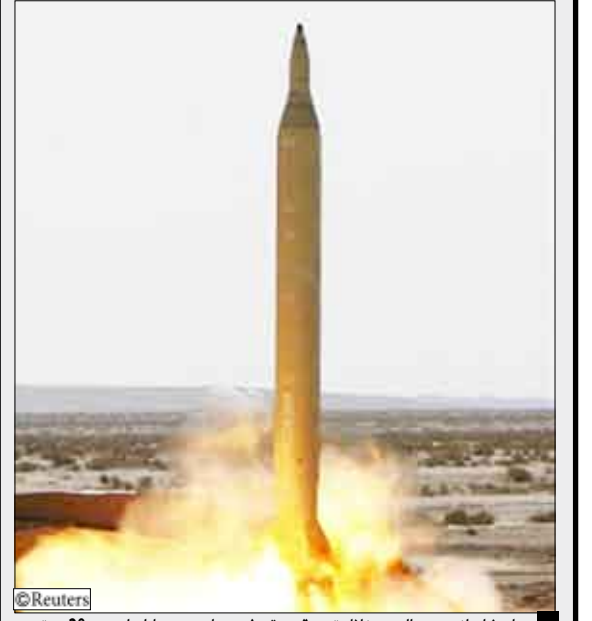
صاروخ إيراني بعيد المدى خلال تجربة بوقوع غير معلوم بوسط إيران يوم 28 سبتمبر

تعددت الأخبار في الآونة الأخيرة عن قيام إيران بتجربة إطلاق صاروخ نووي متطور، وهو ما يثير قلق المجتمع الدولي. وقد أعلنت إيران أنها نجحت في اختبار صاروخ نووي متطور، وهو ما يثير قلق المجتمع الدولي. وقد أعلنت إيران أنها نجحت في اختبار صاروخ نووي متطور، وهو ما يثير قلق المجتمع الدولي.