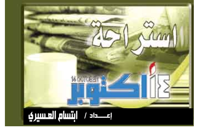
إعداد / إنشام العسيري

وقال بريث سبونسيلر الذي عالج الحيوان المصاب "هذا أول قط نسمع بأنه أصيب بأنفلونزا اتش1 إن1". وكثبت أن غارفي الطبية البيطرية