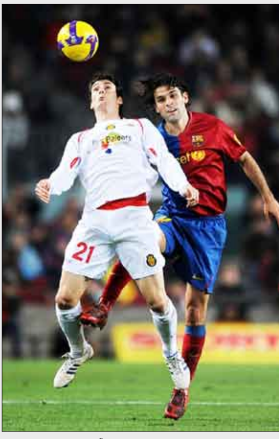
برشلونة ومايوركا.. من يقفز فوق الآخر

وقال أربيلوا: «يتوجب علينا أن نكون في كامل تركيزنا لوقف الخطر في صفوف أتلتيكو مدريد، معتبراً بأن البداية السيئة للجار اللود لا تعكس إمكانياته.»