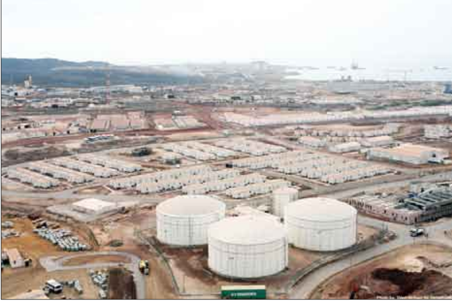
منظر جوي لحقل الغاز الطبيعي المسال في بلحاف