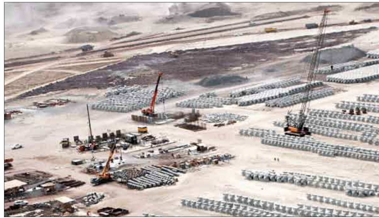
منظر جوي لموقع إنشاء المحطة في بلحاف 4-11-2006

وتضمن المشروع إجراء تعديلات على وحدات استخلاص السوائل الثلاث في وحدات إنتاج ومعالجة الغاز في مأرب اثنتين في حقل اسعد الكامل والثالثة وحدة المعالجة المركزية.