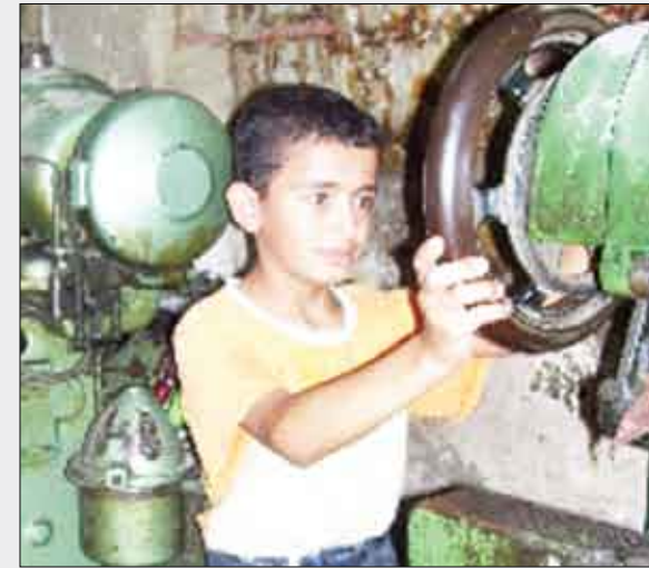
عمالة الأطفال في اليمن لعام 2009م