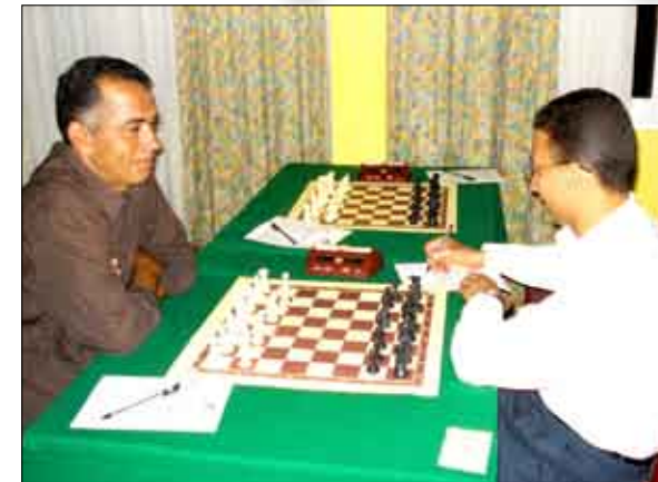
من منافسات الشطرنج

وتواصل صباح وعصر اليوم منافسات البطولة بإقامة الجولات السابعة والثامنة والتاسعة بعقبها حفل الختام وتكريم الأبطال والمميزين.