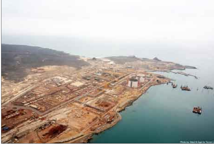
حقل الغاز الطبيعي المسال، بلحاف