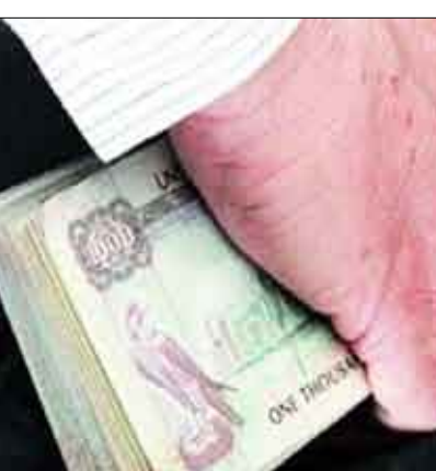
التربح غير المشروع يعني استغلال المنصب للحصول على أموال

وتراجع دائرة الرقابة المالية في دبي نحو 250 منشأة سنويا، وتشمل جميع الشركات التي تملك فيها الحكومة حصة لا تقل عن 25٪. أما الموقوف الأقدم في قضايا الفساد في دبي، فهو مدير سابق في شركة «ديار» وأوقف العام الماضي، وأنهم مع مشتبه بهم آخرين باختلاس