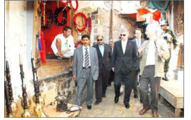
الأمير أندرو خلال زيارته لصنعاء القديمة

غادر صنعاء أمس سمو الأمير أندرو دوق يورك بالملكة المتحدة بعد زيارة لليمن استغرقت يومين التقى خلالها فخامة الرئيس علي عبدالله صالح رئيس الجمهورية وبحث معه العلاقات الثنائية وتوسيع أفق التعاون المشترك بين اليمن وبريطانيا في المجالين التجاري والاستثماري بما يحقق المصالح المشتركة للبلدين الصديقين.