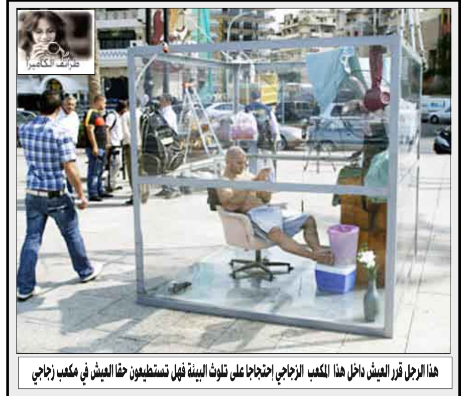
هذا الرجل قرر العيش داخل هذا المكعب الزجاجي احتجاجاً على تلوث البيئة فهل تستطيعون حقا العيش في مكعب زجاجي