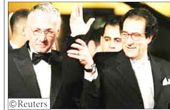
وزير الثقافة المصري فاروق حسني (الى اليمين) ومعه عزت ابو عوف