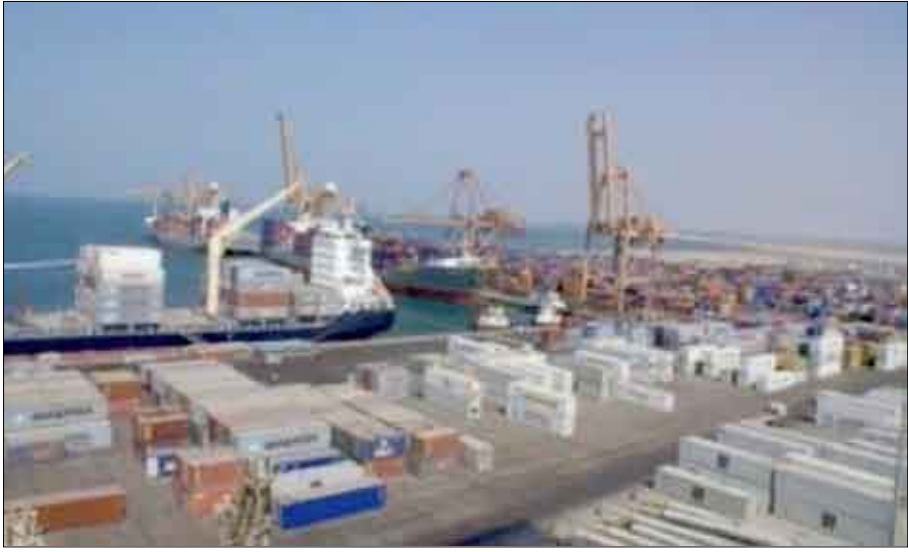
منظر لميناء الحديدة