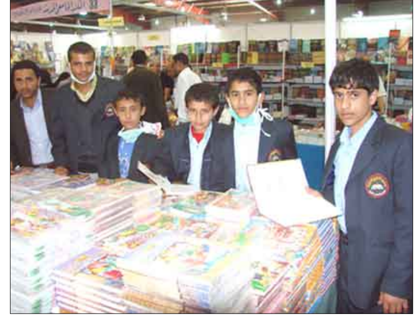
من فعاليات معرض صنعا الدولي الـ 26 للكتاب