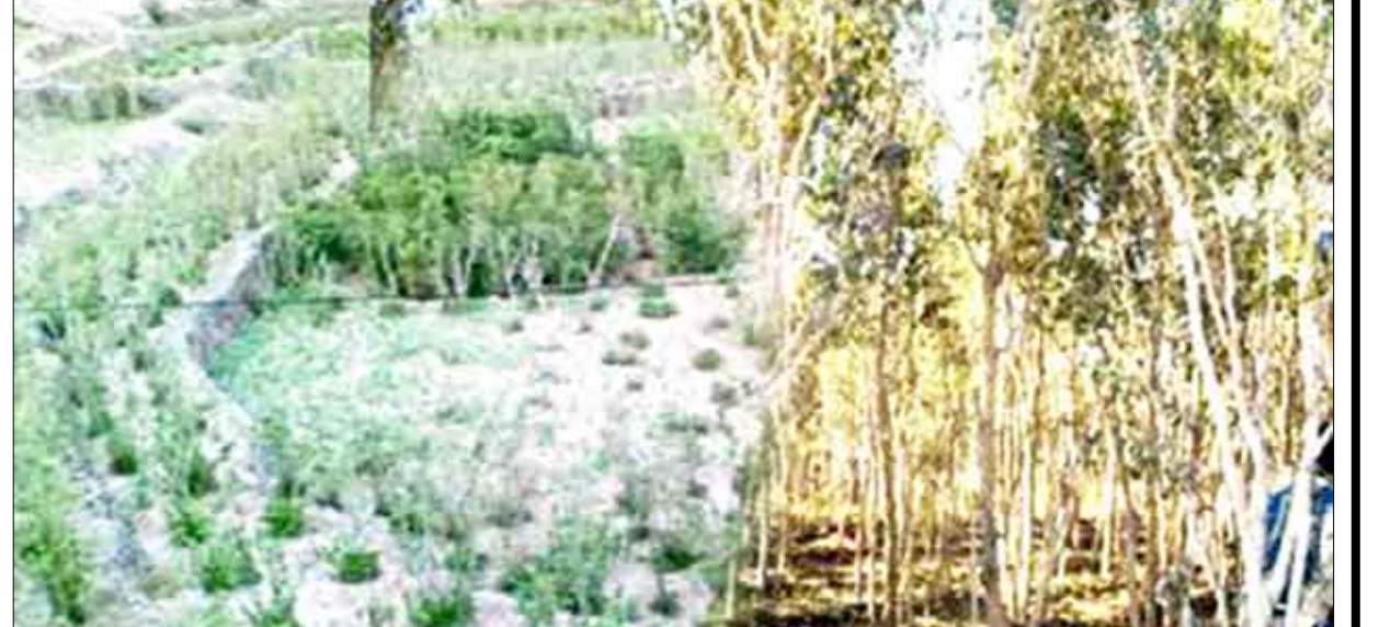
مزارع القات تستهلك من المياه الجوفية أكثر من 30٪

ويصبح مصدراً للدخل واستبدال زراعة المحاصيل الغذائية بزراعة القات وتزايد زراعتها بمعدل 10٪ في السنة. وأشارت الدراسة إلى أن استخدام العالي للمبيدات على المحاصيل يلوث مياه الشرب ويؤدي إلى إهمال البيئة المعيشية والانتشار الواسع للنفائات البلاستيكية. وأضافت تقرير البنك الدولي الصادر في أيار 2007 حول استهلاك القات آثار الكثير من الفلق والاهتمام وشجع على