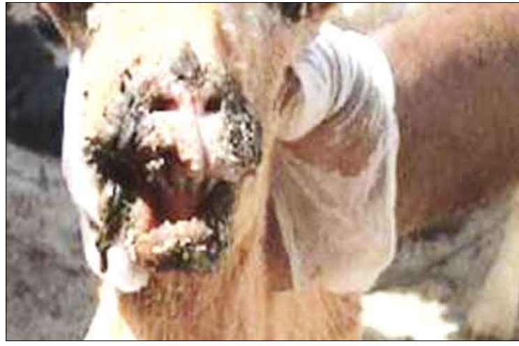
من آثار التشوهات التي تلحقها الدودة الحلزونية