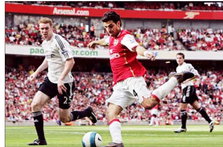
من مباريات الدوري الإنجليزي

متنصف الأسبوع. ويأمل ارسنال أن يستغل لقاء القمة للاقترب من المتصدرين عندما يحل ضيفاً على ولغرهامبتون الصاعد هذا الموسم إلى الدرجة الممتازة.