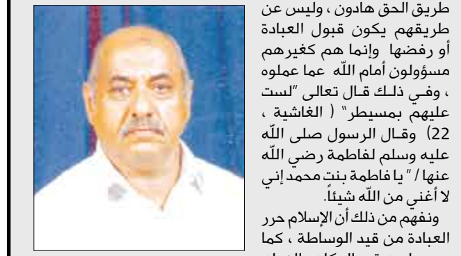
الشيخ الدكتور / علوي عبدالله طاهر □