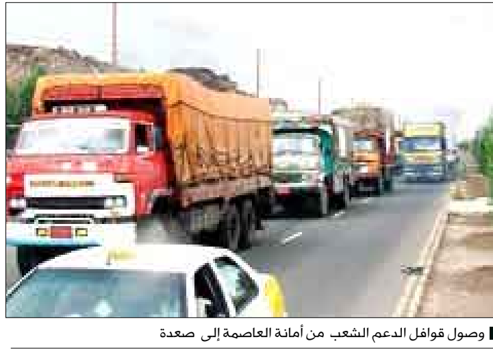
وصول قوافل الدعم الشعب من أمانة العاصمة إلى صعدة

□ صعدة / ساء: وصلت قافلة السلام والنصر المقدمة من أبناء أمانة العاصمة إلى مدينة صعدة برئاسة وكيل أول أمانة العاصمة محمد رزق الصرمي والتي تعد أول قافلة تصل إلى مدينة صعدة. وتعد قافلة أمانة العاصمة هي الأكبر على مستوى قوافل الجمهورية المكونة من 200 ناقلة من مواد غذائية وإيوائية كدفعة أولى ويتكلفه تقدر بحوالي 400 مليون ريال. حيث كان في استقبال القافلة محافظ صعدة حسن مناع الذي أشاد بدوره بقافلة السلام والنصر العظيم المقدمة من أبناء أمانة العاصمة التي تعبر عن حجم الاصطفاف الوطني والتلاحم الشعبي وتعكس عمق الترابط بين أبناء الشعب الواحد والتكاتف والتآزر في أوقات الشدائد. وثمن المحافظ مناع نيابة عن أبناء