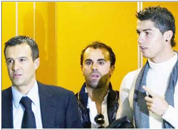
رونالدو... سبب الأزمة

مدير/ مباحثات: يبدو أن إصابة النجم البرتغالي كريستيانو رونالدو ستشعل أزمة بين فريقه ريال مدريد الإسباني ومنتخب بلاده، بعد إبداء الأخير نيته في استعداده لخوض الملحق الأوروبي أمام البوسنة، وذلك بالرغم من إصابته وعدم تمكنه من المشاركة.