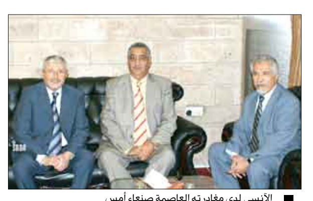
الأنسي لدى مغادرته العاصمة صنعاء أمس

التى بذلت في هذا الجانب من خلال تسقيفها وتعاونها مع شركائها على المستويين الوطني والدولي. وقال أن الهيئة أوشكت على الانتهاء من إعداد الإستراتيجية الوطنية لمكافحة الفساد تمهيدا لإطلاقها نهاية العام الجاري. وذكر الأنسي أن المؤتمر سيناقش ثلاثة مواضيع رئيسية تتعلق بمكافحة الفساد وكذا استعراض تنفيذ اتفاقية الأمم المتحدة في هذا المجال ويضم وفد اليمن المشارك المشاركين من مكتب رئاسة الجمهورية ومجلس النواب والجهاز المركزي للرقابة والمحاسبة.