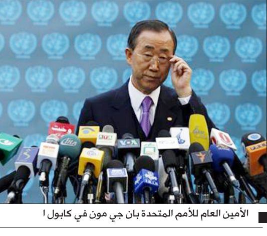
الأمين العام للأمم المتحدة بان جي مون في كابول

لا يفيد أحدا. وأضاف دبلوماسيون إن الأعضاء الخمسة الدائمين لمجلس الأمن يتفقون جميعا على أنه لا جدوى من محاولة مسالة التقرير إلى مجلس الأمن الذي يعني أنه من غير المحتمل أن يفعل المجلس المكون من 15 دولة شيئا فيما يتصل بتقرير جولدستون. ولا يوافق مشروع القرار العربي صراحة على قرار مجلس حقوق الإنسان الشهر الماضي الذي عنف حرب إسرائيل على أفعالها في حرب غزة ولكنه لم يشير إلى أي مخالفات من جانب حركة حماس. وصوتت الولايات المتحدة برفض ذلك القرار بينما امتنعت فرنسا وبريطانيا عن التصويت عليه.