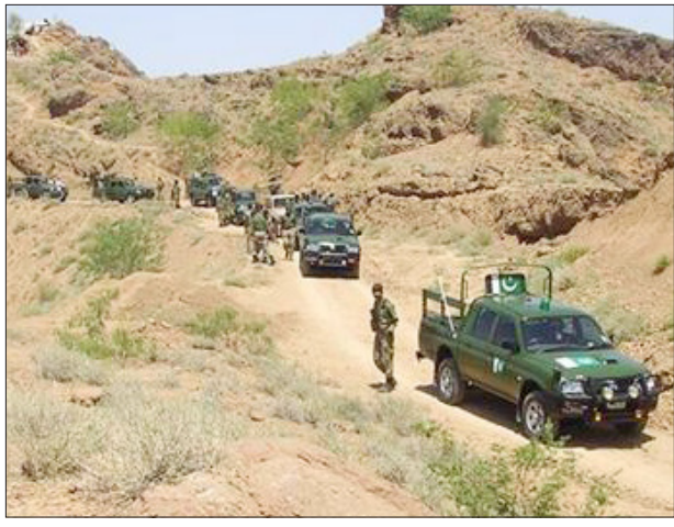
مركبات الجيش الباكستاني وجنود لدى دخولهم قرية في وزيرستان الجنوبية