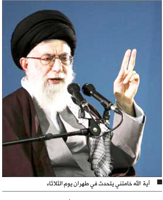
آية الله الخامنئي يتحدث في طهران يوم الثلاثاء

الضبط على إسرائيل لتفتتح تحقيقا كاملا في أفعال جيشها خلال الحرب. وانتقد تقرير جولدستون الجانبين في الحرب التي قتل فيها 1387 فلسطينيا و13 إسرائيليا لكنه كان أشد انتقادا لإسرائيل. وأمهل التقرير إسرائيل وحماس ستة أشهر لإجراء تحقيقات تتمتع بمصداقية ولا واجهوا مقاضاة محتملة في لاهاي. وقال سفير إسرائيل وحماس كلتاهما ارتكاب أي جرائم حرب. وانتقدت إسرائيل التقرير بوصفه متحيزا وقالت إن مجلس حقوق الإنسان التابع للأمم المتحدة والمؤلف من 47 دولة والذي أمر بإعداد التقرير متحامل على الدولة اليهودية. وانتقد مسئول إسرائيلي في نيويورك التقرير ومناقشة الجمعية العامة له. وقال المسئول الذي طلب الإيتشر اسمه "في وقت نقاش فيه استئناف محادثات السلام فإن هذا