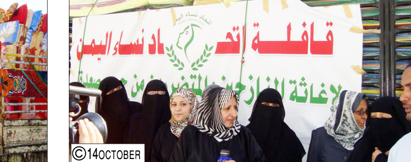
ويلاستيك وفرش وغيرها كدعم مقدم للنساء المتضررات من هذه الفتنة ورسالة واضحة إلى الحوثيين بأن الشعب اليمني وفق ضدهم وضد مشاريعهم الخارجة عن الدين والعرف. وفي تصريح لصحيفة ( 14 أكتوبر ) قالت رئيس اتحاد نساء اليمن رمزية الأرياني: تعتبر هذه القافلة شيئاً بسيطاً أمام ما نشعر به تجاه هؤلاء الأطفال والنساء النازحين الذين ليس لهم ذنب سوى أنهم أوفياء لوطنهم وأرضهم،