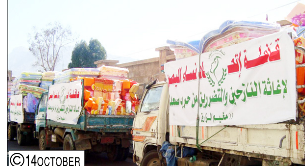
فأقرعهم الحوثيون واستولوا على أراضهم وأبنائهم وقتلوا منهم الكثيرين. وأشارت إلى أن هذه القافلة جاءت بناء على دراسة قام بها فريق ميداني من المخيمات فوجد أن الاحتياجات خصوصية تتعلق بالنساء والأطفال مثل الملابس ووسائل الغسل وغيرها.