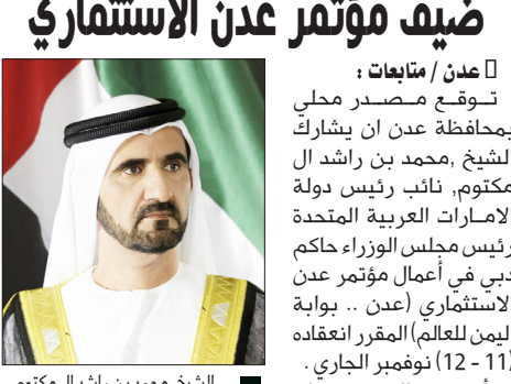
الشيخ محمد بن راشد آل مكتوم

صيف مؤتمر عدن الاستثماري عدن / متابعات: توقع مصدر محلي بمحافظة عدن ان يشارك الشيخ محمد بن راشد آل مكتوم، نائب رئيس دولة الامارات العربية المتحدة رئيس مجلس الوزراء حاكم دبي في أعمال مؤتمر عدن الاستثماري (عدن .. بوابة اليمن للعالم) المقرر انعقاده (11 - 12) نوفمبر الجاري. وأوضح المصدر ان الحكومة اليمنية وجهت رسالة خلية إلى الشيخ محمد لتشريف المؤتمر .. مشيراً إلى ان سكرتارية الشيخ وجهت رسالة إلى غرفة تجارة عدن من منظمة المؤتمر لتحديد برنامج زيارات الشيخ محمد بن راشد وتقديم اخر المستجدات التي طرأت على الاستعدادات الجارية لإقامة المؤتمر. واعتبر المصدر مشاركة الشيخ محمد بن راشد فرصة للترويج للفرص الاستثمارية المتوفرة في عدن وما شهدته المدينة من تطور في مختلف مجالات والقطاعات الاقتصادية. وقد توجه المشرف العام للمؤتمر/ بدر ياسلمه إلى إمارة دبي لإجراء عدد من اللقاء مع بعض الشخصيات الهامة في الإمارة لدعوتهم للمشاركة في المؤتمر.