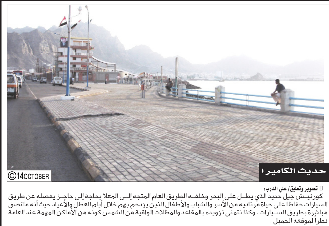
حديث الكاميرا تصوير وتعليق/ علي الدرب: كورت نيش جيل حديد الذي يطل على البحر وخلفه الطريق العام المتجه إلى المعلا بحاجة إلى حاجز يفصله عن طريق السيارات حفاظاً على حياة مرطديه من الأسر والشباب والأطفال الذين يزدحم بهم خلال أيام العطل والأعياد حيث أنه ملتصق مباشرة بطريق السيارات. وكذا نتمنى تزويده بالمقاعد والمظلات الواقية من الأماكن المظلمة عند العامة نظراً لموقعه الجميل.