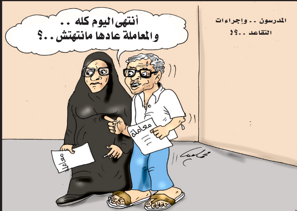
أنتهى اليوم كله .. والمعاملة عاذا ما انتهت .. ؟ المدرسون .. وإجراءات التقاعد .. ؟

باختصار محمد الجراحي عندما يحال المعلم إلى التقاعد، بعد أن يكون قد أفنى أزهى سنوات شبابه في خدمة الأجيال والمجتمع، ليس من الإنصاف بتاتا أن يدوخ السبع دوخت، وهات يا مرطمة وهات يا شمات من شأن يخلص أوراق معاملته التي ستحيله إلى رف التقاعد، خصوصا عندما يتابع معاملته لدى موظفين كانوا يوما ما يجلسون على مقاعد الدراسة وينهلون من علوم معارفه. قال أمير الشعراء: "قم للمعلم وفه التبجيلا ×× كاد المعلم أن يكون رسولا" أين نحن من تبجيل المعلم .. ولا يبارك الله في مجتمع لا يحترم معلميه.