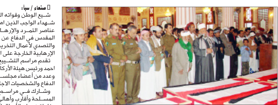
أثناء الصلاة على عدد من شهداء الواجب أمس

شيع الوطن وقواته المسلحة صباح أمس جثامين عدد من شهداء الواجب الذين امتدت إليهم أيادي الغدر والخيانة من عناصر التمرد والإرهاب واستشهدوا وهم يؤدون واجبهم المقدس في الدفاع عن الوطن والثورة وعن الأمن والاستقرار والتصدي لأعمال التخريب والقتل التي تمارسها تلك العناصر الإرهابية الخارجة على النظام والقانون.