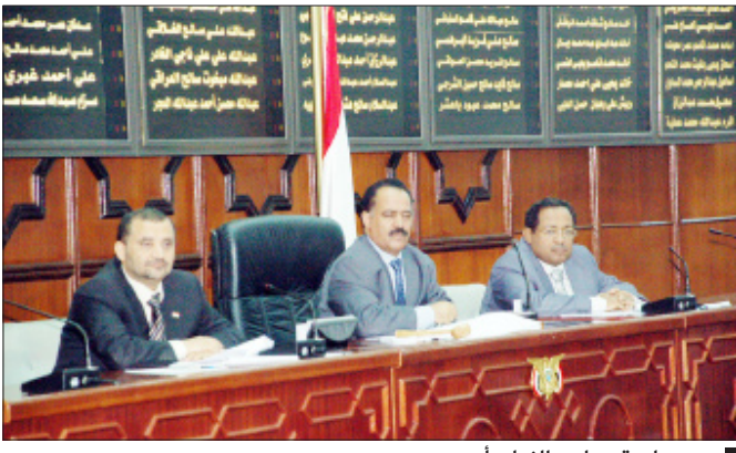
من جلسة مجلس النواب أمس

تشغيل الوحدات لفترات طويلة من دون توقف فعلي، وكذا تجاوز ساعات تشغيل بعض الوحدات لساعات المحددة للصيانة العمرية والموصى بها من المصنع، إلى جانب عدم توفر المخصصات المالية لشراء قطع الغيار اللازمة لتنفيذ أعمال الصيانة الدورية للعديد من المحطات.