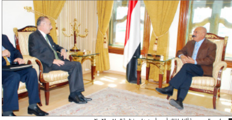
رئيس الجمهورية أثناء لقائه أمين عام منظمة المؤتمر الإسلامي

استقبل فخامة الأخ الرئيس علي عبدالله صالح رئيس الجمهورية أمس أمين عام منظمة المؤتمر الإسلامي أكمل الدين إحسان أوغلو الذي يزور بلادنا حالياً. وجرى في اللقاء بحث جوانب التعاون بين اليمن والمنظمة بالإضافة إلى بحث العديد من القضايا والمستجدات التي تهم الأمة الإسلامية وسبل تعزيز مسيرة التضامن الإسلامي، بالإضافة إلى ما ستقدمه المنظمة من مساعدات للنازحين في صعدة نتيجة الفتنه التي أشعلتها العناصر الإرهابية الحوثية. وخلال اللقاء أكد أمين عام منظمة المؤتمر الإسلامي دعم المنظمة لليمن في الحفاظ على وحدتها وأمنها وسيادتها على أراضيها. معبراً عن ثقته في حكمة القيادة اليمنية في مواجهة التحديات التي تواجهها حالياً. وأشار أوغلو إلى أن المنظمة تبنيد العنف والاستغلال المذهبي والطائفي وتسييس الدين لمآرب غير إنسانية، موضحاً ما ستقوم به المنظمة لمساعدة النازحين ومنها تقديم مساعدات لهم بحوالي 3 ملايين دولار، كما أنها تنوي إقامة مخيم لإيواء النازحين يتسع لـ 5 آلاف شخص.