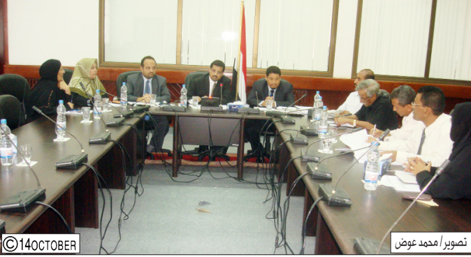
شائف يترأس الاجتماع أمس

المدير العام لمكتب الخدمة المدنية والتأمينات في عدن لـ (14 أكتوبر):