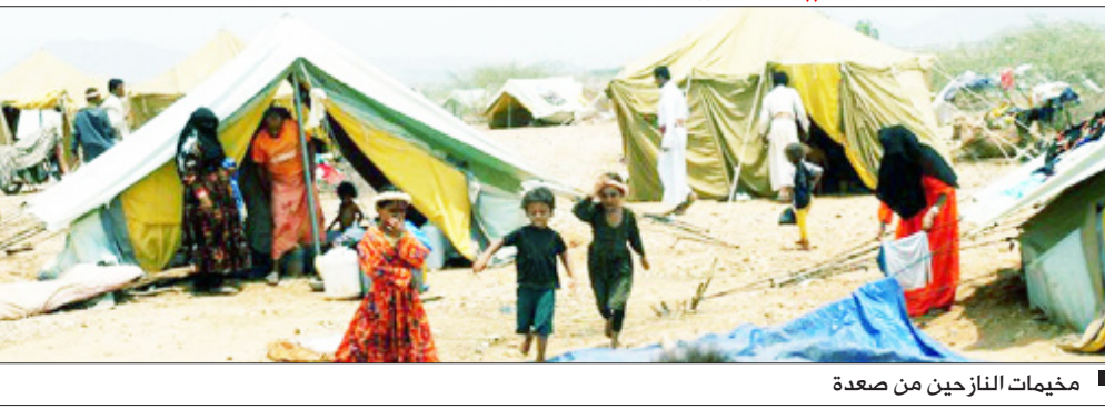
مخيمات النازحين من صعدة

نفى مصدر عسكري مسئول عن عشيرات الأقباط من الأسر من صحة مزاعم عناصر الإرهاب والتخريب الحوثية عن قيام الطيران بقصف مدنيين في مديرية رازح. وقال المصدر إن هذه المزاعم كاذبة ولا أساس لها من الصحة وان من يقوم بالاعتداء على المواطنين سواء في مديرية رازح أو في عدد من المديريات الأخرى بصعدة وتفجير منازلهم وإحراق مزارعهم وقطع الطرقات وإجبار الأطفال على القتال في صفوفهم واتخاذ عدد من المواطنين دروعاً بشرية واختطاف المئات من أبناء محافظة صعدة هم تلك العناصر