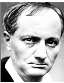
الشاعر الفرنسي / شارل بودليير