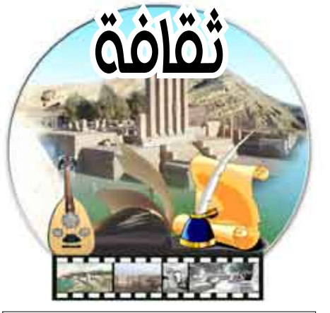
إشراف /فاطمة رشاد

14 أكتوبر /فاطمة رشاد: اختتم الفنان التشكيلي وائل ياسين معرضه غداً الجمعة الذي حمل اسم «استلهامات وأفكار لونية» وقد استمر المعرض لمدة عشرة أيام على التوالي وأقيم في فندق السيد في محافظة تعز . وصرح الفنان التشكيلي وائل ياسين لصحيفة الثقافة « بأن المعرض كان ناجحاً كما نجح المعرضان السابقان اللذان أقامهما في محافظة عدن، ويعتبر هذا المعرض إضافة لرصيد الفنان التشكيلي وائل ياسين حيث أنه قد استطاع الخروج من محافظة عدن ليقيم هذا المعرض في محافظة تعز .