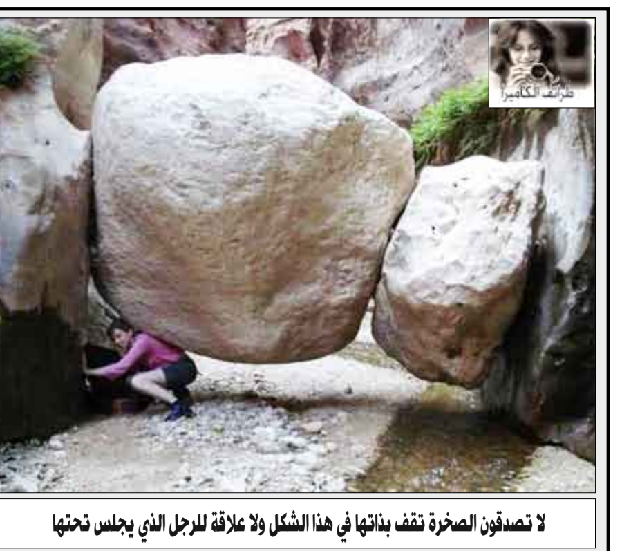
لا تصدقون الصخرة تقف بذاتها في هذا الشكل ولا علاقة للرجل الذي يجلس تحتها

قدم صيني شكوى لدى الشرطة في نانجينغ عاصمة منطقة جيانغشي تشوانج أبلغ فيها عن فرار زوجته التي يزعم أنها خدعت 800 رجل ودفعتهم إلى الزواج بها، وذكرت صحيفة «تشاينا ديلي» الصينية أن الرجل الذي عرف عنه باسم «ويبن» تزوج «آن» التي التقاها إثر قراءة إعلان