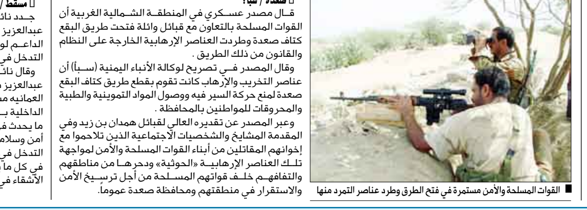
القوات المسلحة والأمن مستمرة في فتح الطرق وطرده عناصر التمرد منها

قال مصدر عسكري في المنطقة الشمالية الغربية أن القوات المسلحة بالتعاون مع قبائل وائلة فتحت طريق البقع كتاف صعدة وطردهت العناصر الإرهابية الخارجة على النظام والقانون من ذلك الطريق. وقال المصدر في تصريح لوكالة الأنباء اليمنية (سبأ) أن عناصر التخريب والإرهاب كانت تقوم بقطع طريق كتاف البقع صعدة لمنع حركة السير فيه ووصول المواد التموينية والطبية والمحروقات للمواطنين بالمحافظة. وعبر المصدر عن تقديره العالي لقبائل همدان بن زيد وفي المقدمة المشايخ والشخصيات الاجتماعية الذين تلاحموا مع إخوانهم المواطنين من أبناء القوات المسلحة والأمن لمواجهة تلك العناصر الإرهابية «الحوثية» وحررها من مناطقهم والتفاهم خلف قواتهم المسلحة من أجل ترسيخ الأمن والاستقرار في منطقتهم ومحافظة صعدة عموماً.