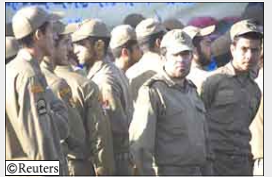
أعضاء في الحرس الثوري الإيراني في طهران يوم 20 أكتوبر

قالت مسؤولون إن السلطات الباكستانية أفرجت يوم أمس عن 11 من أعضاء الحرس الثوري الإيراني اعتقالوا يوم الاثنين بعد عبورهم الحدود إلى الجانب الباكستاني. وكانت القوات الباكستانية قد أفتت القبض على أفراد الحرس الثوري في منطقة ماشغل على الحدود مع إيران بعد ثمانية أيام من مقتل 42 شخصا من بينهم ستة من قادة الحرس الثوري في تفجير انتحاري في إقليم سيستان وبلوچستان في جنوب شرق إيران. وأعلنت جماعة جند الله السنية المسؤولة عن التفجير.