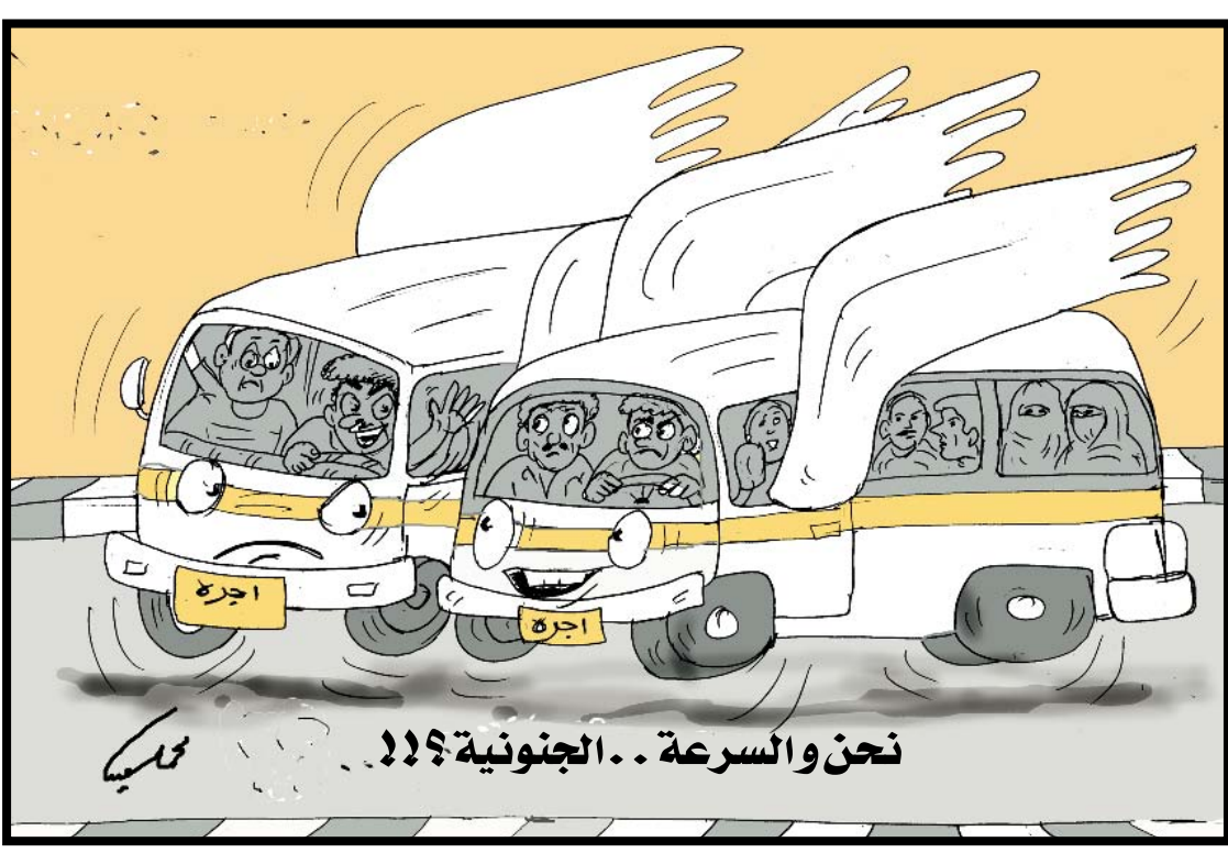
نحن والسرعة.. الجنونية!!

ياختصار صنعاة السعودى والسرعة الجنونية والتسابق على الركاب من قبل سائقي باصات الأجرة صارت مشكلة مرورية مزمنة وبحاجة إلى حل حازم من قبل إدارة مرور عدن. فمعظم السائقين صغار السن، أو شباب متهورون، فمثلاً لو يتم إضافة عقوبة المنع من قيادة الباص لفترات محددة إلى جانب الغرامة المالية، وتزداد كلما تكررت المخالفة نعتقد أنها يمكن تأتي بنتائج. أما السكوت عنها فمعناه أن المشكلة ستفاقم وسيصبح من العسير حلها.