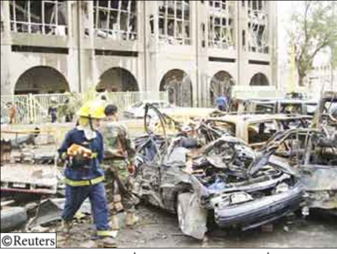
موقع هجوم أمام وزارة العدل في بغداد يوم الأحد