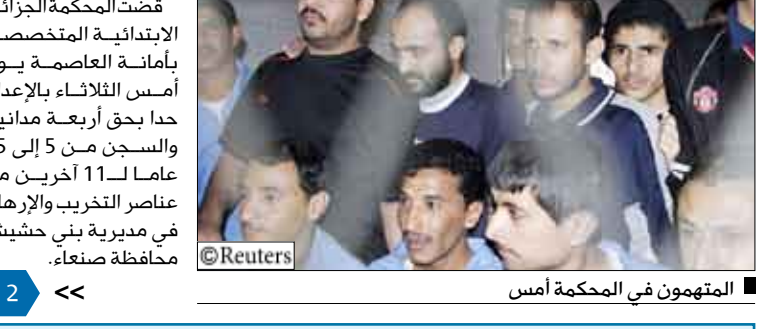
المتهمون في المحكمة امس

قضت المحكمة الجزائية الابتدائية المتخصصة بأمانة العاصمة يوم أمس الثلاثاء بالإعدام حداً بحق أربعة مدانين والسجن من 5 إلى 15 عاماً لـ 11 آخرين من عناصر التخريب والإرهاب في مديرية بني حشيش بمحافظة صنعاء.