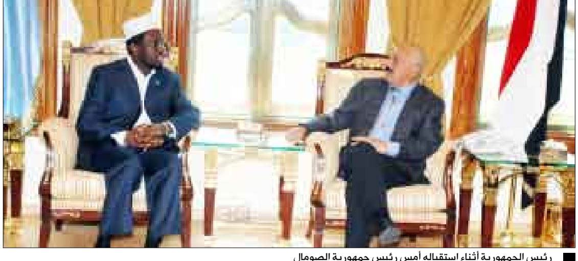
رئيس الجمهورية أثناء استقباله امس رئيس جمهورية الصومال

استقبل فخامة الأخ الرئيس علي عبدالله صالح رئيس الجمهورية يوم أمس الثلاثاء فخامة الرئيس شريف شيخ أحمد رئيس جمهورية الصومال الشقيقة والوفد المرافق له الذي يزور اليمن حالياً. وجرى بحث العلاقات الأخوية بين البلدين الشقيقين وسبل تعزيزها وتطويرها بالإضافة إلى بحث المستجدات الإقليمية التي تهم البلدين وفي مقدمتها الأوضاع في الصومال ومنطقة القرن الأفريقي. وقد أطلع فخامة الرئيس الصومالي أخاه فخامة الرئيس الجمهورية على تطورات الأوضاع في الصومال وما تبذله الحكومة الصومالية من جهود لإحلال الأمن والسلام في الصومال وإعادة بناء مؤسسات الدولة الصومالية. وعبر عن شكره وتقديره لما يقدمه اليمن من دعم للصومال ولجهود إحلال الأمن والاستقرار فيه واستقبال النازحين الصوماليين في اليمن وتقديم الرعاية لهم بالإضافة إلى الجهود المبذولة من أجل تحقيق المصالحة في الصومال ولما يخدم مصلحة الشعب الصومالي. كما أعرب فخامة الرئيس الصومالي عن شكره وتقديره لليمن على مواقفه الداعمة للصومال وأمنه واستقراره واستقباله للنازحين الصوماليين. من جانبه جدد فخامة رئيس الجمهورية دعم اليمن لجهود إحلال الأمن والاستقرار في الصومال ووحدة أراضيه. مؤكداً أن أمن الصومال جزء لا يتجزأ من أمن اليمن ودول المنطقة بشكل عام.