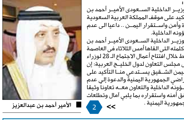
الأمير أحمد بن عبدالعزيز

جدد نائب وزير الداخلية السعودي الأمير أحمد بن عبدالعزيز التأكيد على موقف المملكة العربية السعودية الداعم لوحدة وأمن واستقرار اليمن.. داعياً إلى عدم التدخل في شؤونها الداخلية. وقال نائب وزير الداخلية السعودي الأمير أحمد بن عبدالعزيز في كلمته التي ألقاها أمس الثلاثاء في العاصمة اليمنية سقط خلال افتتاح أعمال الاجتماع الـ 28 لوزراء الداخلية بدول مجلس التعاون لدول الخليج العربية: إن ما يحدث في اليمن الشقيق يستدعي منا التأكيد على أمن وسلامة أراضي الجمهورية اليمنية والدعوة إلى عدم التدخل في شؤونها الداخلية والتعاون معه وتعاوناً وثيقاً في كل ما يحقق أمنه واستقراره بما يليب آمال وتطلعات الأشقاء في الجمهورية اليمنية.