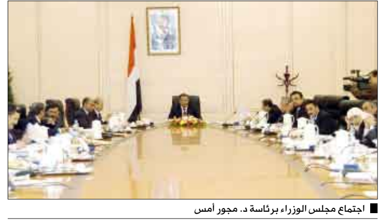
اجتماع مجلس الوزراء برئاسة د. مجور امس

واصل مجلس الوزراء في اجتماعه الأسبوعي يوم أمس الثلاثاء برئاسة رئيس المجلس الدكتور علي محمد مجور مناقشة تقرير اللجنة الفنية من وزارة التخطيط والتعاون الدولي والجهات الحكومية المستفيدة مشاريعها من البرنامج الاستئماني الممول من القروض والمساعدات الخارجية، ومناقشة مستوى تنفيذ تلك المشاريع مع تحديد أسباب تراجم أو تدني السحب منها والإجراءات المطلوبة للتسريع بعملية استكمال المشاريع المتعثرة منها. كما أطلع المجلس على تقرير نائب رئيس اللجنة العليا لإيواء النازحين وزير الصحة العامة والسكان حول سير جهود الإيواء والإغاثة في مخيمات النازحين والخدمات المختلفة التي يتم تقديمها للمقيمين فيها. مؤكداً على أهمية النزول الميداني المستمر للوزراء المعنيين بمتطلبات النازحين لتفقد أوضاعهم وتلمس احتياجاتهم ومطالبتهم بالعمل على معالجتها وتوفيرها ما كل فيما يخصه، ورفع تقاريرهم إلى المجلس بهذا الشأن.