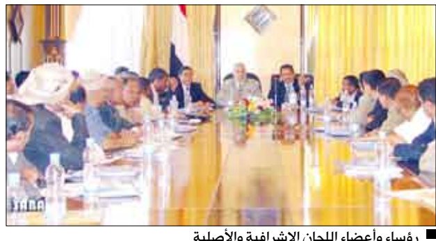
رؤساء وأعضاء اللجان الإشرافية والأصلية

توجه يوم أمس الثلاثاء رؤساء وأعضاء اللجان الإشرافية والأصلية المشاركة في انتخابات ملء المقاعد الشاغرة في مجلس النواب -المقرر إجراؤها في الثالث من ديسمبر المقبل في 12 دائرة انتخابية- إلى مواقع أعمالهم في تلك الدوائر.