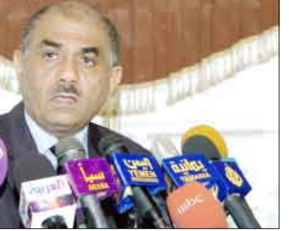
الناطق الرسمي باسم الحكومة في مؤتمره الصحفي امس

أعلن الناطق باسم الحكومة وزير الإعلام حسن اللوزي أن الأجهزة الأمنية اعتقلت خمسة إيرانيين كانوا على متن سفينة إيرانية مشبوهة محملة بالأسلحة قبالة ساحل ميدي بمحافظة حجة.. مؤكداً أن «التحقيقات جارية معهم وسيتم الإعلان عن نتائجها فور استكمالها من قبل الجهات المختصة». واعتبر اللوزي في مؤتمره الصحفي الأسبوعي امس أن المظاهرات والاعتصامات المرخصة والمشروعة مكفولة لأي مواطن في عموم محافظات اليمن. وقال: «لا يوجد ما يمنع قيام مسيرات أو مظاهرة وفق النظام والقانون لكن من يتجاوز ذلك فيسبب عواقب عمله». وفيما يتعلق بأوضاع النازحين أكد أن الحكومة تولي المخيمات والنازحين الرعاية الكاملة وقد وجهت بتوفير كل ما يحتاجونه من الغذاء والدواء والتعليم للأطفال في تلك المخيمات.