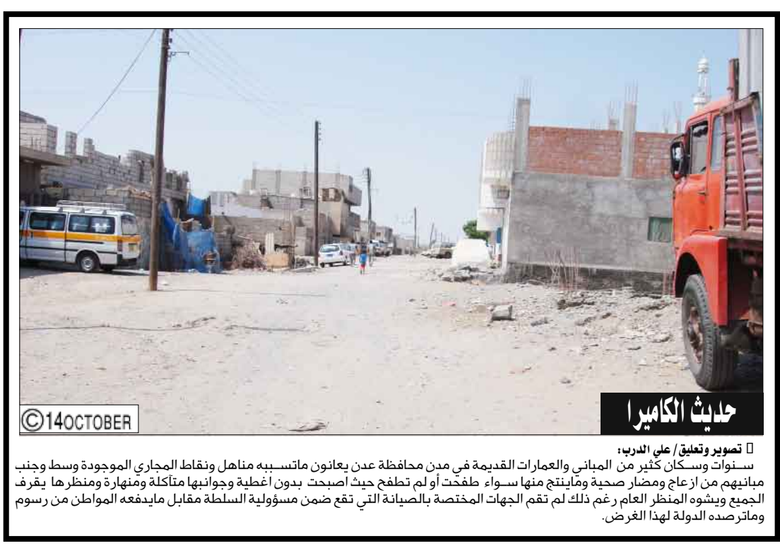
حادث الكاميرا تصوير وتعليق/ علي الدرب: سنوات وسكان كثير من البياني والعمارات القديمة في من محافظة عدن يعانون ماتبسيه مناهل ونقاط المجاري الموجودة وسط وجنب مياينهم من ازعاج ومضار صحية ومابينج منها سواء ملطخت أو لم تطلق حيث أصبحت بدون أغطية وجوانبها متآكلة ومتهارة ومنظرها يقرظ الجمع ويشوه المنظر العام رغم ذلك لم تقم الجهات المختصة بالصيانة التي تقع ضمن مسؤولية السلطة مقابل مايدفعه المواطن من رسوم وماترصد الدولة لهذا الغرض.