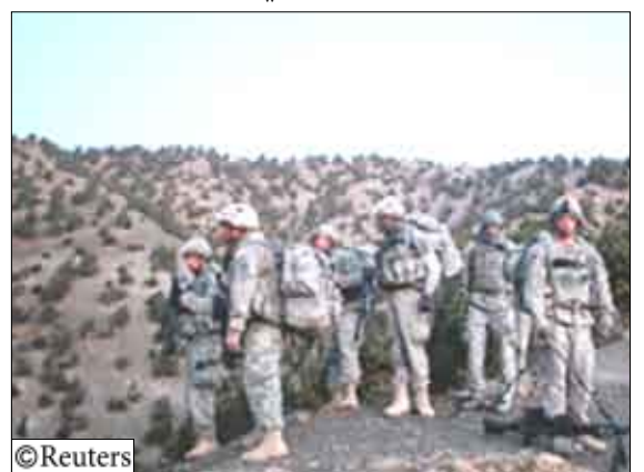
جنود أمريكيون في أفغانستان

قالت قوات التحالف في بيان إن ثمانية من أفراد القوات الأمريكية العاملين مع القوة التي يقودها حلف شمال الأطلسي ومدنيا أفغانيا قتلوا في عدة تفجيرات في جنوب أفغانستان يوم أمس. وقالت قوة المساعدة الأمنية الدولية التي يقودها الحلف (إيساف) إن عددا من الجنود قد أصيبوا في "هجمات متعددة متداخلة" ولكن لم تقم مزيدا من التفاصيل بشأن الهجمات التي جاءت بعد يوم من مقتل 11 جنديا أمريكيا في تحطم طائرتي هليكوبتر.