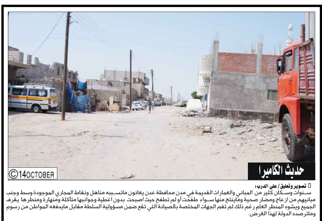
حادث الكاميرا تصوير وتعليق/ علي الدرب: سنوات وسكان كثير من البياني والعمارات القديمة في من محافظة عدن يعانون ماتبسيه مناهل ونقاط المجاري الموجودة وسط وجنب مياينهم من ازعاج ومضار صحية ومابينج منها سواء ملطخت أو لم تطلق حيث أصبحت بدون أغطية وجوانبها متآكلة ومتهارة ومنظرها يفرق الجمع ويشوه المنظر العام رغم ذلك لم تقم الجهات المختصة بالصيانة التي تقع ضمن مسؤولية السلطة مقابل مايدفعه المواطن من رسوم وماترصد الدولة لهذا الغرض.