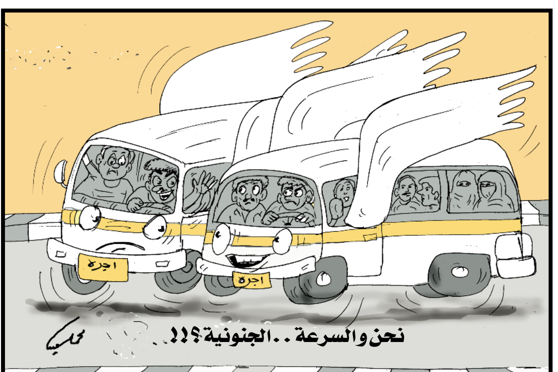
نحن والسرعة .. الجنونية؟؟؟؟

ياختصار صنعاة السعودي والسرعة الجنونية والتسابق على الركاب من قبل سائقي باصات الأجرة صارت مشكلة مرورية مزمنة وبحاجة إلى حل حازم من قبل إدارة مرور عدن. فمعظم السائقين صغار السن، أو شباب متهورون، فمثلاً لو يتم إضافة عقوبة المنع من قيادة الباص لفترات محددة إلى جانب الغرامة المالية، وتزداد كلما تكررت المخالفة نعتقد أنها يمكن تأتي بنتائج. أما السكوت عنها فمعناه أن المشكلة ستفاقم وسيصبح من العسير حلها.