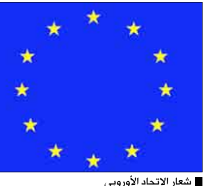
شعار الاتحاد الأوروبي

لوكسمبورغ / مابعات: جدد وزراء خارجية الدول الأعضاء في الاتحاد الأوروبي تمسكهم بدعم أمن واستقرار ووحدة اليمن، ومساندتهم لجهود الحكومة اليمنية الرامية إلى بسط الاستقرار على أراضي البلاد. جاء ذلك خلال اليوم الثاني من اجتماعهم في لوكسمبورغ، حيث أكدوا أهمية استقرار اليمن بالنسبة للمنطقة بأسرها. وعبر الوزراء عن استعداد الاتحاد لمساعدة الحكومة اليمنية في المجال الأمني في عملها ضد الإرهاب، خاصة القادم عبر الحدود، ما يعرض استقرار وسلامة البلاد والمنطقة للخطر. كما أكدوا دعمهم للإصلاحات السياسية والانتخابية والاقتصادية اللازمة في اليمن، معبرين عن رغبتهم في رؤية انتخابات نزيهة ومكشوفة في البلاد عام 2011. وأكد الوزراء أن الاتحاد الأوروبي يفكر حالياً