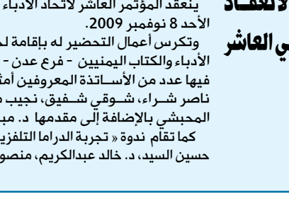
مؤتمري الفرعي العاشر لأدباء عدن

صنعا / سيا: شهدت قاعة التدريب بمكتب التربية والتعليم في محافظة مأرب فعاليات اللقاء التقييمي وورشة العمل الخاصة بالمجالس التنسيقية لدعم تعليم الفتاة على مستوى مديريات الوادي - الجوبة - العبيدة. نظمت الفعالية إدارة تعليم الفتاة بمكتب التربية والتعليم بدعم من المشروع اليمني الألماني لتحسين التعليم العام، حيث تلقى المشاركون والمشاركات البالغ عددهم (25) متدرباً ومتدربة محاضرات حول كيفية إعداد الخطط والبرامج الهادفة إلى دعم أنشطة الفتاة