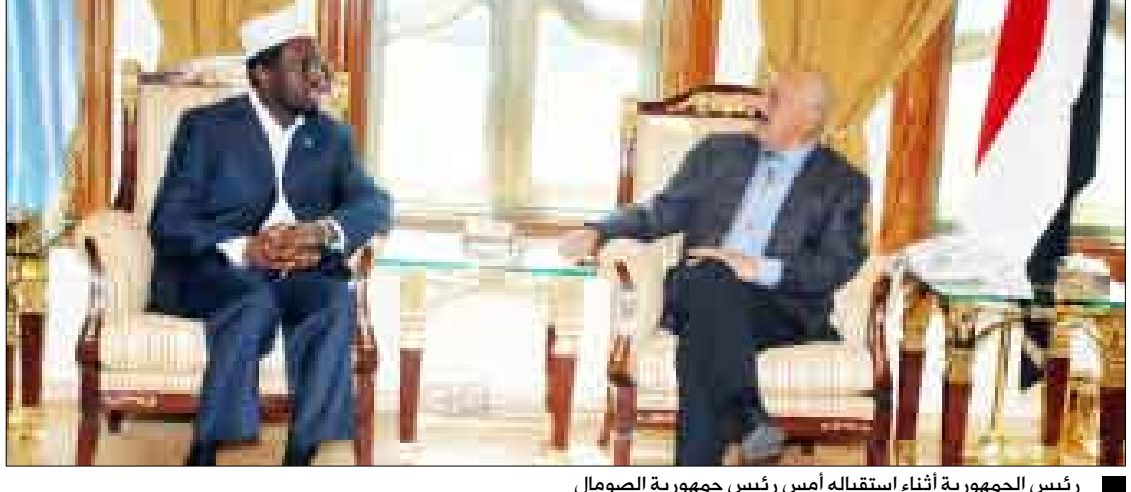
رئيس الجمهورية أثناء استقباله أمس رئيس جمهورية الصومال

صنعا / سيا: استقبل فخامة الأخ الرئيس علي عبدالله صالح رئيس الجمهورية يوم أمس الثلاثاء فخامة الرئيس شريف شيخ أحمد رئيس جمهورية الصومال الشقيقة والوفد المرافق له الذي يزور اليمن حالياً. جرى بحث العلاقات الأخوية بين البلدين الشقيقين وسبل تعزيزها وتطويرها بالإضافة إلى بحث المستجندات الإقليمية التي تهم البلدين وفي مقدمتها الأوضاع في الصومال ومنطقة القرن الأفريقي. وقد أطلع فخامة الرئيس الصومالي أخاه فخامة رئيس الجمهورية على تطورات الأوضاع في الصومال وما تبذله الحكومة الصومالية من جهود لإحلال الأمن والسلام في الصومال وإعادة بناء مؤسسات الدولة الصومالية. وعبر عن شكره وتقديره لما يقدمه اليمن من دعم للصومال ولجهود إحلال الأمن والاستقرار فيه واستقبال النازحين الصوماليين في اليمن وتقديم الرعاية لهم بالإضافة إلى الجهود المبذولة من أجل تحقيق المصالحة في الصومال ولما يخدم مصلحة الشعب الصومالي. كما أعرب فخامة الرئيس الصومالي عن شكره وتقديره لليمن على مواقفه الداعمة للصومال وأمنه واستقراره واستقباله للنازحين الصوماليين. من جانبه جدد فخامة رئيس الجمهورية دعم اليمن لجهود إحلال الأمن والاستقرار في الصومال ووحدة أراضيه. مؤكداً أن أمن الصومال جزء لا يتجزأ من أمن اليمن ودول المنطقة بشكل عام.