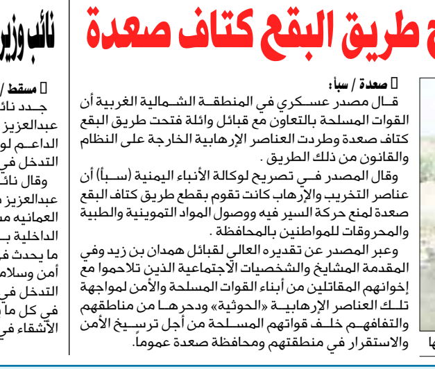
القوات المسلحة والأمن مستمرة في فتح الطرق وطرد عناصر التمرد منها

صنعا / سيا: قال مصدر عسكري في المنطقة الشمالية الغربية أن القوات المسلحة بالتعاون مع قبائل وائلة فتحت طريق البقع كتاف صعدة وطردت العناصر الإرهابية الخارجة على النظام والقانون من ذلك الطريق. وقال المصدر في تصريح لوكالة الأنباء اليمنية (سبأ) أن عناصر التخريب والإرهاب كانت تقوم بقطع طريق كتاف البقع صعدة لمنع حركة السير فيه ووصول المواد التموينية والطبية والمحروقات للمواطنين بالمحافظة. وعبر المصدر عن تقديره العالي لقبائل همدان بن زيد وفي المقدمة المشايخ والشخصيات الاجتماعية الذين تلاحموا مع إخوانهم المقاتلين من أبناء القوات المسلحة والأمن لمواجهة تلك العناصر الإرهابية «الحوثية» وحررها من مناطقهم والتفاهم خلف قواتهم المسلحة من أجل ترسيخ الأمن والاستقرار في منطقتهم ومحافظة صعدة عموماً.