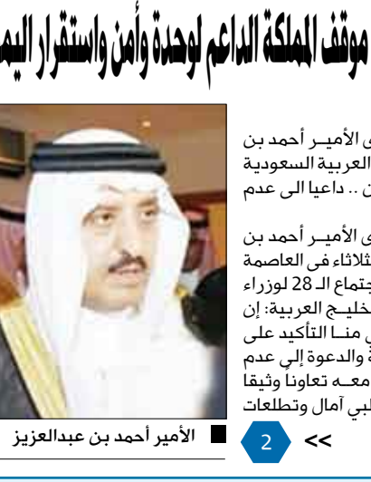
الأمير أحمد بن عبدالعزيز

صنعا / سيا: جدد نائب وزير الداخلية السعودي الأمير أحمد بن عبدالعزيز التأكيد على موقف المملكة العربية السعودية الداعم لوحدة وأمن واستقرار اليمن. داعياً إلى عدم التدخل في شؤون الداخلية. وقال نائب وزير الداخلية السعودي الأمير أحمد بن عبدالعزيز في كلمته التي القاها أمس الثلاثاء في العاصمة اليمنية سقط خلال افتتاح أعمال الاجتماع الـ 28 لوزراء الداخلية بدول مجلس التعاون لدول الخليج العربية: إن ما يحدث في اليمن الشقيق يستدعي منا التأكيد على أمن وسلامة أراضي الجمهورية اليمنية والدعوة إلى عدم التدخل في شؤونه الداخلية والتعاون معه تعاوناً وثيقاً في كل ما يحقق أمنه واستقراره بما يليب آمال وتطلعات الأشقاء في الجمهورية اليمنية.