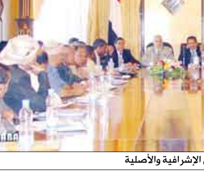
رؤساء وأعضاء اللجان الإشرافية والأصلية

صنعا / سيا: توجه يوم أمس الثلاثاء رؤساء وأعضاء اللجان الإشرافية والأصلية المشاركة في انتخابات ملء المقاعد الشاغرة في مجلس النواب -المقرر إجراؤها في الثالث من ديسمبر المقبل في 12 دائرة انتخابية- إلى مواقع أعمالهم في تلك الدوائر.