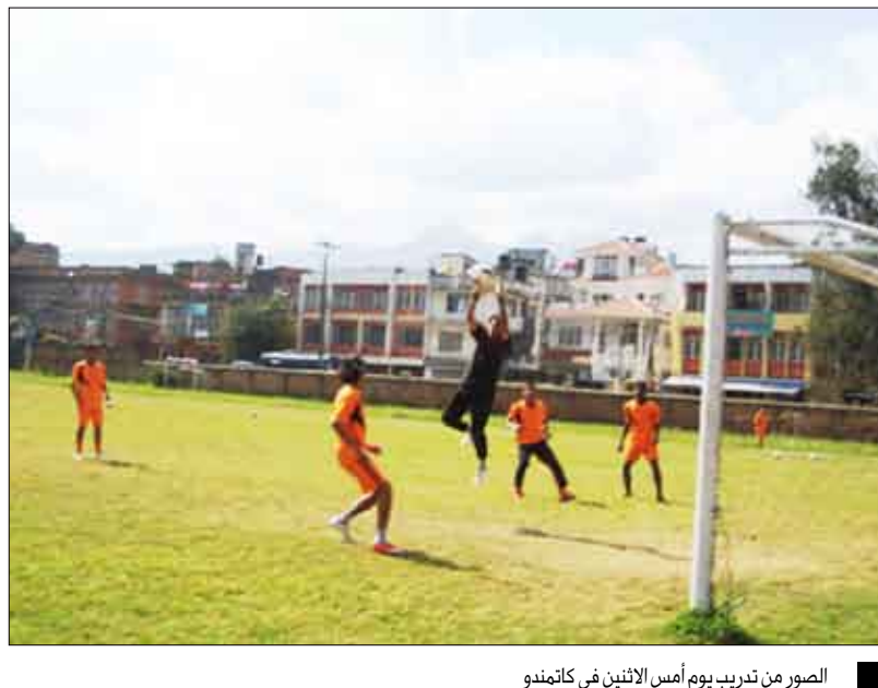
الصور من تدريب يوم أمس الاثنين في كاتمندو

وتكتسب مباراة اليوم أهمية خاصة للمنتخبين اليمني والأردني كونهما مرشحين للتأهل إلى النهائيات الآسيوية 2010م المؤهلة إلى نهائيات كأس العالم 2011م. بعد أن حققا الفوز في الجولة الأولى ويعتبر فوز أحدهما على الآخر اليوم بوابة الرئيسية نحو المنافسة الحقيقية على إحدى بطاقتي التأهل عن المجموعة.