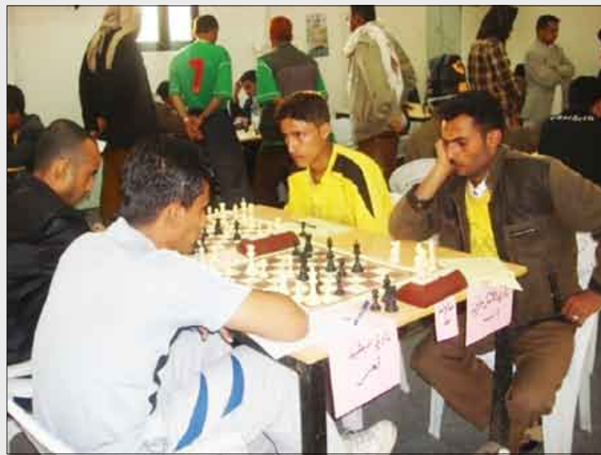
المفاجآت أهمها تألق فريق ماوية تعز الذي حل في المركز السابع، وفي نهاية الحفل تم تكريم الأبطال بالميداليات والكؤوس.

بالنظام السويسري من سبع جولات سارت بشكل جيد وشهدت بعض