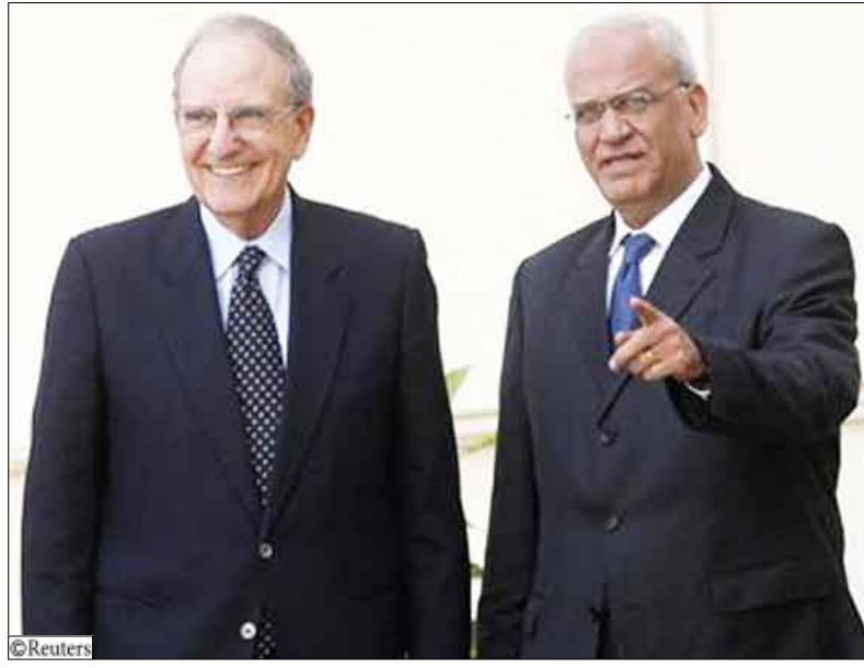
صائب عريقات و جورج ميتشل مبعوث الرئيس الأمريكي للشرق الأوسط في الضفة الغربية

عدم نشر أسمائهم إن من غير المرجح إجراء محادثات مع الفلسطينيين في الشهر المقبل. وأبدوا شكوكهم في أن يبدي الرئيس الفلسطيني محمود عباس المرونة الكافية تجاه إسرائيل قبل الانتخابات الفلسطينية المزمعة في يناير كانون الثاني والتي تعارضها حماس. ومطلب تنبأهم من عباس استئناف المفاوضات على الفور من دون شروط مسبقة. وقدمت وزيرة الخارجية الأمريكية هيلاري كلينتون يوم الخميس لأوباما تقييماً غير براق لجهود السلام في الشرق الأوسط. وجاء تقريرها عقب اجتماعات منفصلة في واشنطن بين جورج ميتشل مبعوث أوباما للشرق الأوسط والمفاوضين الإسرائيليين والفلسطينيين بهدف تسويق الاتفاق واستئناف