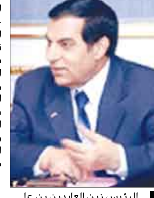
الرئيس زين العابدين بن علي

صنعاء / سيا : يعث فخامة الأخ الرئيس علي عبدالله صالح رئيس الجمهورية تهنئة إلى أخيه فخامة الرئيس زين العابدين بن علي رئيس الجمهورية التونسية بمناسبة نجاح الانتخابات التشريعية والرئاسية وثيلة ثقة الشعب التونسي جاء فيها: يطيب لي باسمي