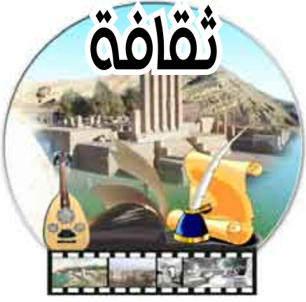
إشراف / فاطمة رشاد