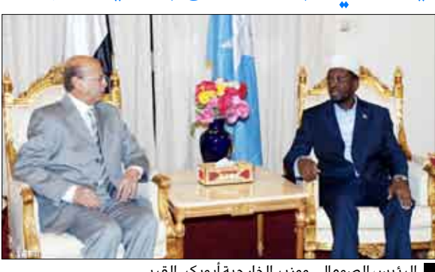
الرئيس الصومالي وزير الخارجية أبوبكر القربي

صنعاء / سيا : وصل إلى صنعاء أمس فخامة الرئيس شريف شيخ أحمد رئيس جمهورية الصومال في زيارة عمل لليمن يبحث خلالها مع أخيه فخامة الرئيس علي عبدالله صالح رئيس الجمهورية التطورات والمستجدات في الصومال وعددا من القضايا. وقال فخامة الرئيس الصومالي في تصريح لوكالة الأنباء اليمنية (سبأ) أن هذه الزيارة تأتي في إطار توطيد العلاقات الثنائية وتبادل وجهات النظر وتحريك العمل العربي المشترك نحو جميع المناطق التي تشهد عدم استقرار