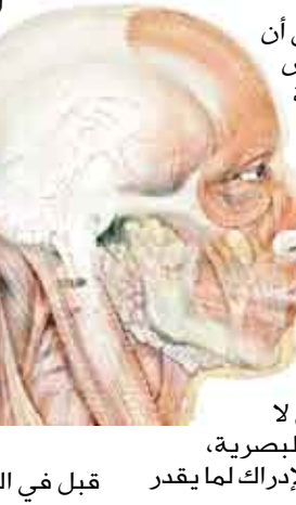
قبل في اللاوعي.

الدماغ أن يراه. وقال معهد الدراسة كاسبار شويدريك أن هذا الاكتشاف يشير إلى إمكانية المبدئية لاستعادة المرضى العميان بعض الإدراك البصري. وقد فتحت هذه الدراسة الباب أمام جيل جديد من الأبحاث والعلاجات الرامية لمعالجة المرضى الذين أصيبوا بالعمى نتيجة إصابة ما. وأفادت الدراسة التي نشرت في مجلة «البصر» أن الدماغ يتأقلم باستمرار ويمكن أن يتم تدريجه ليرى بشكل واعٍ ما كان يراه من قبل في اللاوعي.