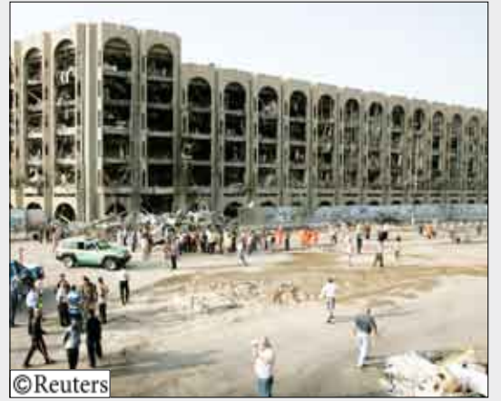
مبنى وزارة العدل العراقية