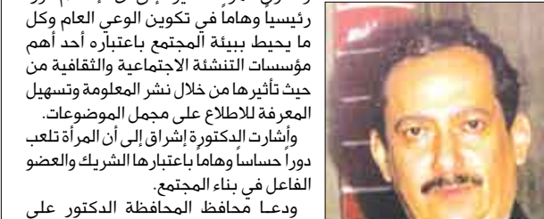
علي حسن الأحمدي

افتتح صباح أمس بقاعة المركز الثقافي في مدينة عنق عاصمة محافظة شبوة حلقة نقاش عن دور الإعلام في مساندة قضايا المرأة والطفل تحت رعاية محافظ محافظة شبوة الدكتور علي حسن الأحمدي وبدعم من الاتحاد الأوروبي وتقام للفترة من 26 - 27 أكتوبر بمشاركة عدد من الإعلاميين من محافظات شبوة ومارب وأبين.