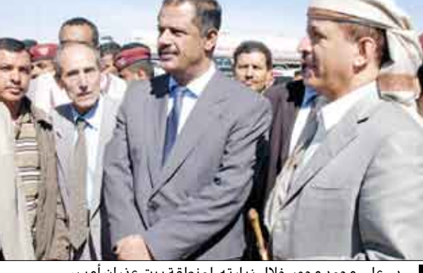
د. علي محمد مجور خلال زيارته لمنطقة بيت عذران أمس

صنعاء / سيا : اطلع رئيس مجلس الوزراء الدكتور علي محمد مجور خلال زيارته أمس لمنطقة بيت عذران على الأرض الخاصة بالمنطقة الصناعية المخصصة للصناعات الخفيفة غير الملوثة للبيئة. واستمع الدكتور مجور ومعه وزير الصناعة والتجارة الدكتور يحيى المتوكل إلى شرح من محافظ صنعاء نعمان دويد حول الخطوات التي أنجزتها إلى ذلك التقى الدكتور مجور على هامش زيارته لمديرية بني مطر محافظة صنعاء ورئيس وأعضاء القافلة الشعبية لأبناء المديرية والتي تحمل مواد غذائية وإيوائية لإخوانهم النازحين في منطقة الملاح من أبناء محافظة صعدة وإخوانهم المقاتلين من أبناء القوات المسلحة والامن الذين يطاردون ويتصدون ببسالة لتلك العناصر المارقة والمأجورة والخارجة على النظام والقانون. (التفاصيل من ص 5)