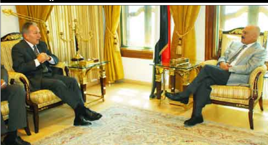
رئيس الجمهورية لدى استقباله السفير الأمريكي بصنعاء ستيفن سكايت أمس

صنعاء / سيا : استقبل فخامة الأخ الرئيس علي عبدالله صالح رئيس الجمهورية أمس السفير الأمريكي بصنعاء ستيفن سكايت. وجرى في اللقاء بحث عدد من القضايا التي تهم العلاقات الثنائية ومجالات التعاون المشترك بين البلدين وسبل تعزيزها وتطويرها وبما يخدم المصالح المشتركة للبلدين والشعبين الصديقين. كما جرى بحث التعاون بين اليمن والولايات المتحدة الأمريكية في مجال مكافحة الإرهاب. وفي اللقاء جدد السفير الأمريكي دعم الولايات المتحدة الأمريكية لمسيرة التنمية في اليمن منوها بالعلاقات اليمينية الأمريكية وما تشهده من تطور.