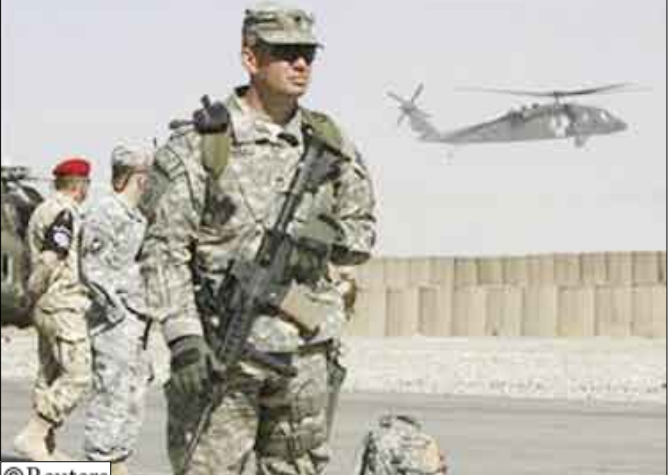
مجنّد أمريكي يقف للحراسة بينما تلتق طائرة هليكوبتر أمريكية فوق قاعدة عسكرية في إقليم غازني

12 مقاتلي طالبان. وأسفر الحادث عن إصابة 11 جندياً أمريكياً و14 جندياً أفغانياً ومدني أمريكي. وذكر الحلف في بيان سابق أن أربعة عسكريين أمريكيين قتلوا وأصيب اثنان عندما وقع تصادم في الجو بين طائرتي هليكوبتر للقوات التي يقودها حلف شمال الأطلسي. وذكر الحلف في بيان يوم أمس إن جندياً أمريكياً لقي حتفه في شرق أفغانستان في انفجار قنبلة زرعت على جانب الطريق وتوفي آخر متأثراً بجراحه جراء هجوم للمتشددين. ولم يتسنّ لتحديثه باسم القوة الدولية للمعاونة الأمنية (ايساف) التي يقودها حلف الأطلسي أن تقدم المزيد من المعلومات عن الضحايا أو موقع حادثي التحطم بالتحديد.