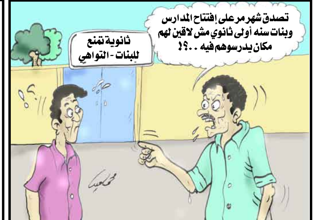
تصدق شهر مر على افتتاح المدارس وبنات سنه أولى ثانوي مش لاقين لهم مكان يدرسونهم فيه ؟!

باختصار صنعاء السعودي تأخرت الدراسة هذا العام عن الموعد المحدد بسبب انفلتونزا الخنازير، واعتبرنا ذلك حرصاً من الوزارة على صحة الطلاب والطالبات. وكان هناك تأخير أكثر في بعض مدارس الأمانة وسينون، على اعتبار ظهور حالات انفلتونزا الخنازير فيها بنسبة أكبر من غيرهما. لكن كيف نفهم تأخر الدراسة للسنوات الأولى ثانوي في مدرسة تمنع بمديرية التواهي بمحافظة عدن؟ هل هو ناتج عن إجراءات احترازية ووقائية لأنفلتونزا الخنازير؟ أو انفلتونزا الإهمال والتقصير من قبل المسؤولين أصحاب الشأن؟ علماً أننا سمعنا من قبل تصريحات لوزير التربية يشدد فيها على ضرورة ابتداء العام الدراسي بحسب التقويم والعايير الدولية.