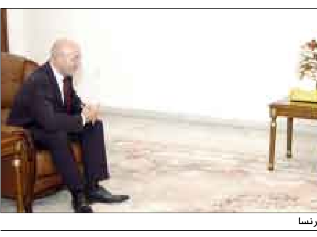
د. مجور لدى استقباله أمس سفير فرنسا

صنعاء / سيا: استقبل رئيس مجلس الوزراء الدكتور علي محمد مجور أمس سفير الجمهورية الفرنسية بصنعاء جوزيف سلفا بمناسبة تعيينه مؤخراً لدى اليمن. وجرى خلال اللقاء مناقشة علاقات التعاون اليمني الفرنسي وتوجهاته للفترة القادمة في المجالات الاقتصادية والاستثمارية والثقافية. وخلال اللقاء جدد السفير الفرنسي موقف بلاده الداعم للوحدة اليمنية والأمن والاستقرار وجهود التنمية في بلادنا، معرباً عن اعتزازه بالحوضور الاستثنائي المتميز والكبير لفرنسا في اليمن عبر مشروع الغاز اليمني المسال. وأكد السفير سلفا أنه سيعمل على تعزيز وتطوير المسار الاستثماري الفرنسي في اليمن خلال المرحلة المقبلة فضلاً عن تطوير العلاقات الثقافية في مجال التعليم العالي وغيرها من مجالات التعاون القائمة بين الشعبين الصديقين. من جانبه رحب رئيس الوزراء بالسفير سلفا، معبراً عن تمنياته له بالتوفيق والنجاح في مهامه الرامية إلى تعزيز علاقات الصداقة بين البلدين الصديقين في مختلف المجالات.. معرباً عن تقدير اليمن لمواقف فرنسا الداعمة للأمن والاستقرار في بلادنا وللمسيرة الوحدوية المباركة.