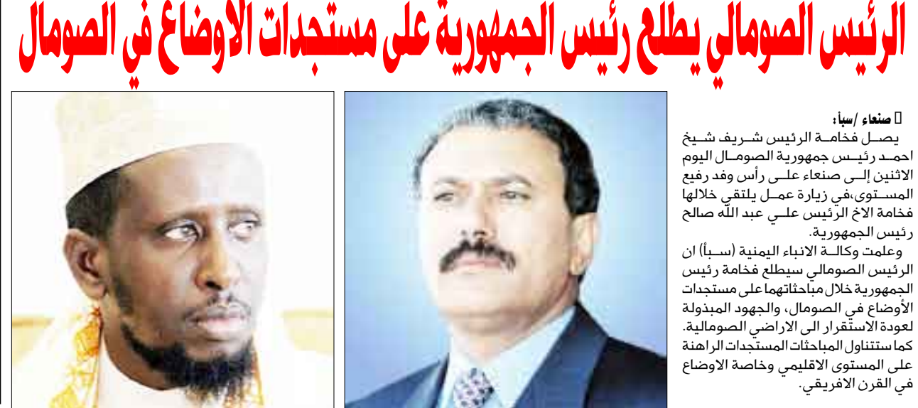
يصل اليوم إلى صنعاء على رأس وفد رفيع المستوى