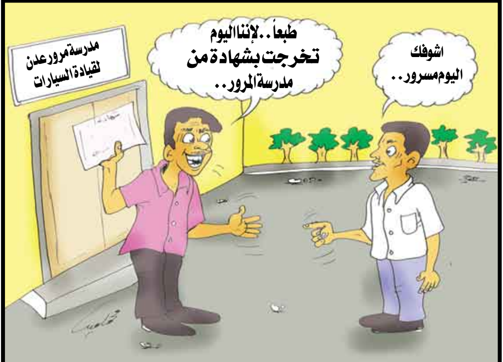
اشوفك اليوم مسرور.. طبعاً.. لأننا اليوم تخرجت بشهادة من مدرسة المرور.. مدرسة مرور عدن بقيادة السيارات

باختصار صنعاء المسعودي كثير من الحوادث المرورية تؤدي إلى خسائر مروعة في الأرواح والممتلكات، وتكثف المواطنين والدولة أموالاً باهظة. والسبب الأول في الحوادث المرورية هو أخطاء البشر في القيادة خصوصاً صغار السن، الذين يقودون سيارات أهاليهم من دون معرفة كافية ببادئ قيادة السيارات، بالإضافة إلى عدم فهمهم ماذا تعني الإشارات المرورية المنصوبة - على قتلها - في بعض الطرقات. لذلك من الضرورة بمكان لكل من أراد تعلم قيادة السيارات أن يلجأ إلى مدرسة متخصصة بتعليم فن قيادة السيارات، كذلك على الأهل منع أبنائهم من قيادة السيارات إلا بعد أن يخوضوا دورة في أي مدرسة تقوم بتعليم قيادة السيارات، على أن تمنحهم شهادة تؤكد أن لديهم الأهلية الفنية واللياقة البدنية للقيادة. نقول لمن يستهترون بأرواح البشر في الطرقات خصوصاً أولئك الذين يسمحون لأبنائهم الصغار بقيادة سياراتهم: ليس بالضرورة أن تكون الضحية من المشاة أو المارة، فكثير من الحوادث يذهب ضحيتها السائقون ومن يركبون معهم « الأبناء نعمة.. فلتحافظ عليهم».