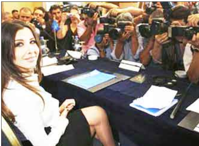
نانسي عجرم تبتسم أثناء مؤتمر صحفي في بيروت أمس الخميس