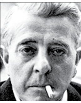
الفرنسي / جاك بريفيير