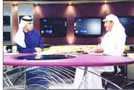
التوسع في توليدها إلى زيادة التلوث.

أعلن حسين ناصر لوتاه مدير عام بلدية دبي أن البلدية ستطلق مشروعاً لقياس النقاط الحرارية في مدينة دبي عن طريق الأشعة الحمراء لتحديد درجة الحرارة في المناطق الأكثر سخونة ومعالجتها بوسائل متعددة من أجل تخفيف حرارة الطقس، مؤكداً أنه بالإمكان في حال نجاح هذه الوسائل تحقيق تخفيض ملموس في درجة الحرارة يصل إلى 5 درجات أقل من المستويات التي تصلها حرارة الطقس حالياً. ونقلت صحيفة البيان الإماراتية عن لوتاه قوله في لقاء مع برنامج "ظل الكلام" على تلفزيون دبي أن من الوسائل الأساسية التي يمكن استخدامها على هذا الصعيد زيادة الرقعة