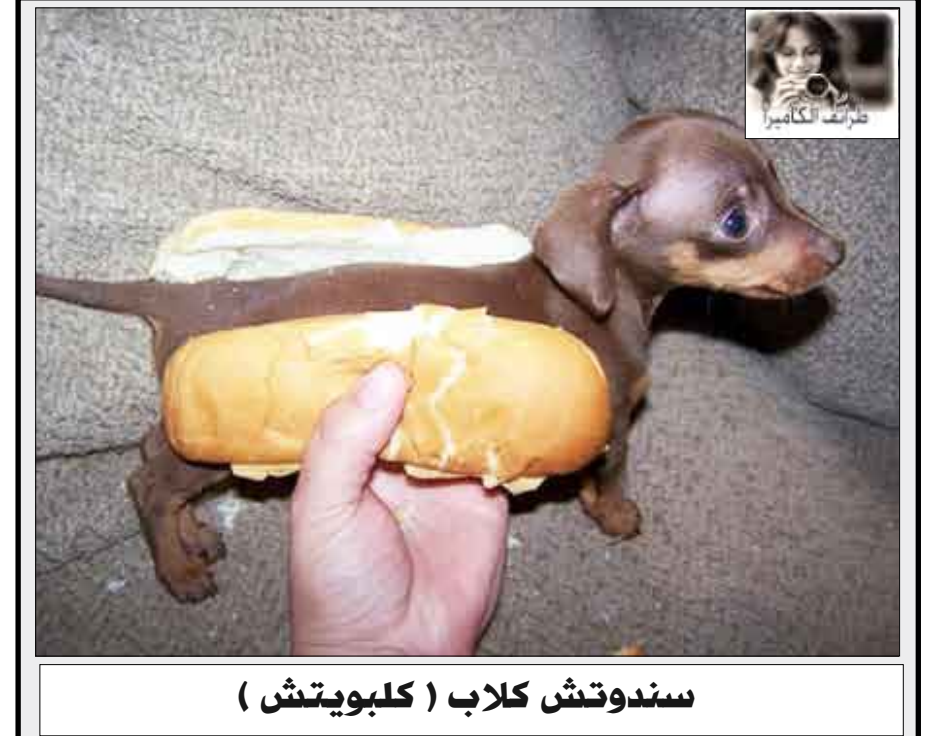
سندوتش كلاب (كلبويتش)