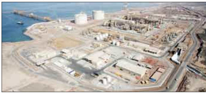
محطة تسهيل الغاز الطبيعي في بلحاف

■ صنعاء / سبأ: أكدت الشركة اليمنية للغاز الطبيعي المسال جاهزية أسطولها البحري الخاص بنقل وتصدير الغاز الطبيعي المسال من بلحاف إلى الخارج المكون من الناقلات العملاقة وزوارق القطر والخدمات.