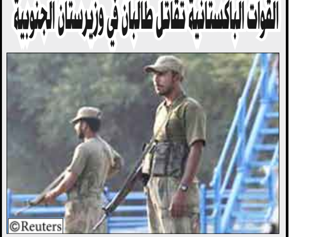
جنود بنبطلة تفتيش على طريق يربط بين وزيرستان الجنوبية و

إبياشور - إسلام اباد (باكستان) / 14 أكتوبر/رويترز: أعلن الجيش الباكستاني الأحد أن 60 متشددا وخمسة جنود قتلوا في وزيرستان الجنوبية منذ بدأ هجومه على الإقليم الواقع على الحدود مع أفغانستان أول أمس السبت. وأمد الجيش في بيان صدر أمس الأحد «في الساعات الأربع والعشرين الأخيرة وردت أنباء عن مقتل 60 إرهابيا في العملية». وقد بادلت الحكومة الباكستانية إطلاق النار الكثيف مع متشدي حركة طالبان أمس الأحد بعد يوم واحد من شن هجوم طال انتظاره بهدف بسط سلطة الدولة على المناطق القبلية الواقعة على الحدود الأفغانية. وقال الجيش إن 60 متشددا وخمسة جنود قتلوا في وزيرستان الجنوبية منذ بدأ هجومه على الإقليم يوم السبت. وأضاف أن الجنود كانوا يعملون في تأمين المنطقة بينما كان بعض المتشددين يفرون. ولم يمتن على الفور التحقق من عدد القتلى بين المتشددين من مصدر مستقل.