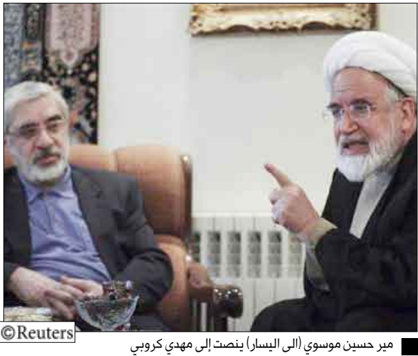
مير حسين موسوي (الي اليسار) ينصت إلى مهدي كربوبي