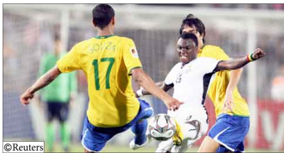
من مباراة النهائي أمس بين البرازيل وغانا

توج المنتخب الغاني بلقب بطولة كأس العالم للشباب - تحت 20 عاماً - بمصر إثر تغلبه على نظيره البرازيلي 4 - 3 بضربات الجزاء الترجيحية على استاد القاهرة الدولي بعدما انتهى الوقتان الأصلي والإضافي للمباراة النهائية بالتعادل السلبي 0-0. ولم يتمكن أي من الفريقين من هز شباك منافسه طوال الوقتين الأصلي والإضافي لينتهي بالتعادل السلبي ويحكم الفريقان لضربات الجزاء الترجيحية التي انتهت بفوز المنتخب الغاني 4 - 3. وفي مباراة تحديد المركزين الثالث والرابع، أحرز منتخب المجر المركز الثالث، بفوزه على نظيره الكوستاريكي بركلات الترجيح 2 - 0 صفر (الوقت الأصلي 1-1).