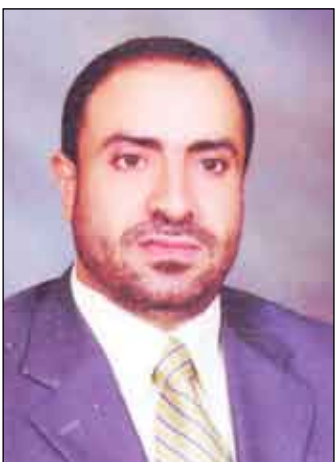
مقبول أمين الرفاعي

الرئيس القائد علي عبدالله صالح (حفظه الله) رئيس الجمهورية. وقد أكد الأخوان الرفاعي والحطام أن هذه الدورة ستكون منطلقاً لدورات ستقام سنوياً وبانتظام وذلك تجسيدا لبرنامج فخامة الرئيس القائد الذي دعا إلى الاهتمام بالشباب خصوصا أبناء الجاليات اليمنية تعميماً لحبهم وائتمائهم للوطن. الجدير ذكره أنه ستقام اليوم على استاد 22 مايو المباراة الأولى في هذه البطولة بين منتخب الجالية اليمنية في الرياض ونظيره في جدة.