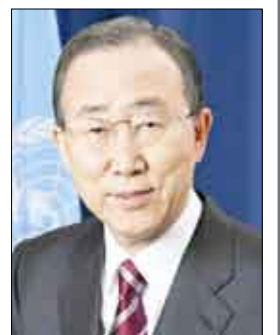
بان كي مون