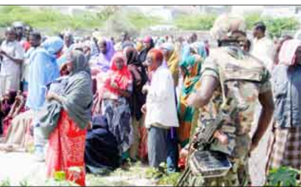
لاجئون صومال / من الإشراف

أوضحت إحصائية أمنية أعدت في ضوء التقارير الأولية للأجهزة الأمنية في المحافظات الساحلية أن عدد اللاجئين الصومال الذين وصلوا إلى الأراضي اليمنية خلال النصف الأول من شهر أكتوبر الجاري بلغ 2116 لاجئاً بينهم 416 امرأة و 24 طفلاً حسب ما أفاد به موقع الاعلام الامني . وأشارت الإحصائية إلى أن اللاجئين الصومال نزحوا على سواحل محافظات شبوة، تعز، حضرموت، أبين، لحج.