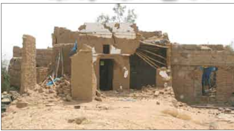
ممتلكات خاصة بالمواطنين تعرضت للنهب والتدمير من قبل المتمردين في صعدة

نفذت وحدات عسكرية وأمنية في الملاحظ عمليات نوعية ضد العناصر الإرهابية والتخريبية، حيث واصلت تلك الوحدات تقديمها وتمكنت أمس من السيطرة على قمة ظهر الحمار ودحر تلك العناصر من جبل الخيال وجبل المنافس وتكبيدها خسائر فادحة في الأرواق والعنادر. وصرح مصدر عسكري مسؤول أن ثلاثة إرهابيين لقوا مصرعهم أثناء عملية لدرج قلول العناصر الإرهابية من المنازل والمزارع الواقعة قرب منطقة آل عقاب، كما لقي القبض على ثلاثة آخرين في عملية تمسيط لبعض الجيوب الإرهابية في إحدى الطرق الواقعة إلى الشمال الغربي لآل عقاب وتدمير وكربن لهم في ذات المنطقة، ولقي اثنان من الإرهابيين مصرعهما في محاولة تسلل فاشلة إلى منطقة التمثلة