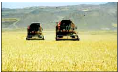
زراعة الحبوب في اليمن

بشار إلى أن أهمية الاحتفال بيوم الغذاء العالمي تكمن في استعراض الرؤى والمقترحات المساهمة في استغلال الموارد الطبيعية في قطاع الزراعة في اليمن وبما يسهم في تعزيز دوره في توفير الغذاء