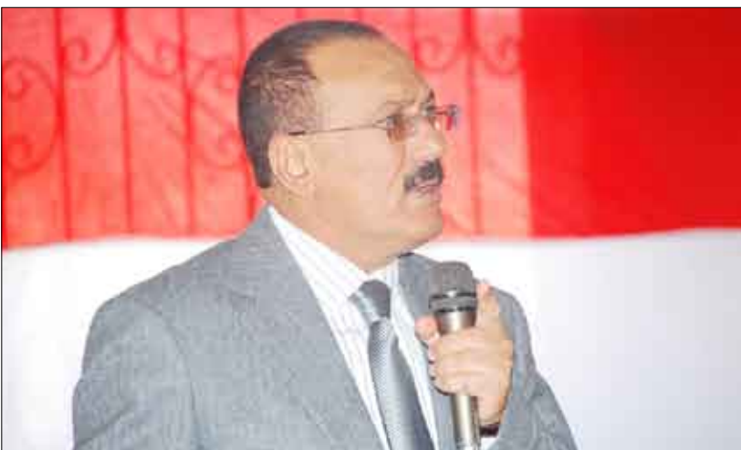
رئيس الجمهورية خلال زيارته التفقدية لقاعدة الشهيد الديلمي الجوية أمس

البرلمان يوافق على استمرار رفع الحصانة البرلمانية عن يحيى بدر الدين الحوثي صنعاء / سبأ : وافق مجلس النواب في جلسته المنعقدة أمس برئاسة رئيس المجلس يحيى علي الراعي على استمرار رفع الحصانة البرلمانية عن يحيى بدر الدين الحوثي عضو المجلس لفترة ثلاثة أشهر كحد أقصى ليتمكن القضاء من اتخاذ الإجراءات القضائية وفقاً لإصلاحاته القانونية، على أن يقوم وزير العدل والنائب العام باتخاذ الإجراءات القضائية حيال المذكور خلال الفترة المشار إليها أنفاً وإبلاغ مجلس النواب بما سيتوصل إليه القضاء وفي ضوء ذلك سيقوم المجلس باتخاذ قراره اللازم وفقاً لمهامه وصلاحياته الدستورية والقانونية في هذا الشأن. ( التفاصيل من 5 )