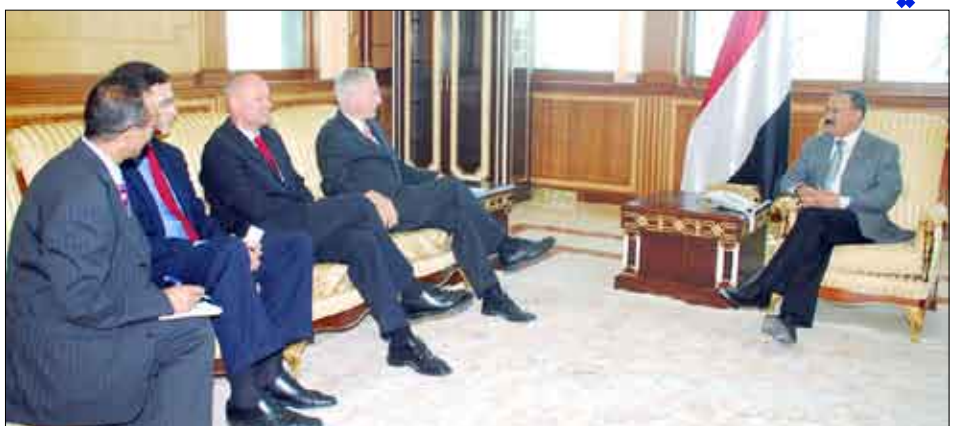
رئيس الجمهورية لدى استقباله السيد يورتن كروبوف مبعوث المستشار الألمانية أنجيلا ميركل

صنعاء / سبأ : استقبل فخامة الأخ الرئيس علي عبدالله صالح رئيس الجمهورية أمس السيد يورتن كروبوف مبعوث المستشار الألمانية أنجيلا ميركل الذي نقل لفخامته رسالة من المستشار الألمانية. تناولت الرسالة العلاقات الثنائية ومجالات التعاون المشترك بين البلدين الصديقين بالإضافة إلى عدد من القضايا والموضوعات التي تهم العلاقات الثنائية . ونوهت المستشار الألمانية ميركل بعلاقات الصداقة التي تربط بين البلدين،