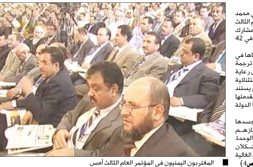
المغربيون اليمنيون في المؤتمر العام الثالث أمس

صنعاء / سبأ : افتتح رئيس مجلس الوزراء الدكتور علي محجور أمس بصنعاء أعمال المؤتمر العام الثالث للمغربيين اليمنيين، بمشاركة نحو 400 مشارك ومشاركة من ممثلي المغتربين اليمنيين في 42 دولة. وأكد الدكتور محجور في كلمته التي القاها في افتتاح المؤتمر أن الحكومة ستعمل على ترجمة مخرجات هذا المؤتمر النوعي، بما يعزز من رعاية الدولة للمغربيين.. مشيراً إلى الأهمية الاستثنائية لأعمال المؤتمر العام الثالث للمغربيين الذي يستند إلى جملة من الاعتبارات الموضوعية وفي مقدمتها الاهتمام والرعاية الكبيران اللذان توليها الدولة والحكومة للمغربيين. وإشاد بالموافق الوطنية الرائعة التي يجسدها المغتربون تجاه قضايا وطنهم، وانحيازهم المـُشرف لثوابته وأولوياته، وفي مقدمتها الوحدة والنظام الديمقراطي التعددي، اللذان يشكلان إجازين عظيمين، ومرة مباركة للتضحيات الغالية التي قدمها شعبنا اليمني . ( التفاصيل من 4 )