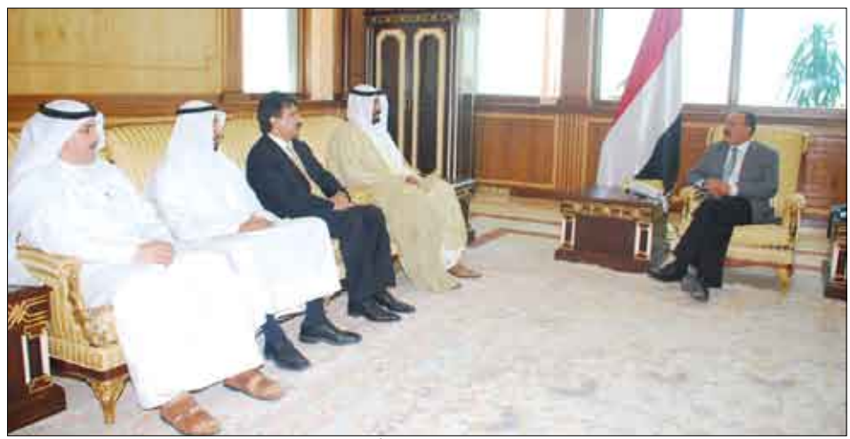
الرئيس يلتقي وزير الشؤون الاجتماعية والعمل بدولة الكويت أمس

صنعاء / سبأ : استقبل فخامة الأخ الرئيس علي عبدالله صالح رئيس الجمهورية أمس وزير الشؤون الاجتماعية والعمل بدولة الكويت الشقيقة الدكتور محمد العفاسي والوفد المرافق الذي يزور بلادنا للمشاركة في أعمال المؤتمر الثالث للمغربيين والذي نقل لفخامته رسالة من أخيه سمو الشيخ صباح الأحمد الصباح أمير دولة الكويت تضمنت تحياته وتمنياته لفخامته بومفور الصحة والسعادة ولبشعبنا اليمني دوام التقدم والازدهار . بالإضافة إلى تأكيد موقف دولة الكويت الداعم لليمن ووحدته وأمنه واستقراره . وجرى خلال اللقاء بحث جوانب العلاقات الأخوية ومجالات التعاون المشترك بين البلدين الشقيقين وسبل تعزيزها.