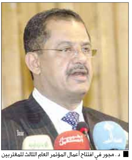
محجور في افتتاح أعمال المؤتمر العام الثالث للمغربيين