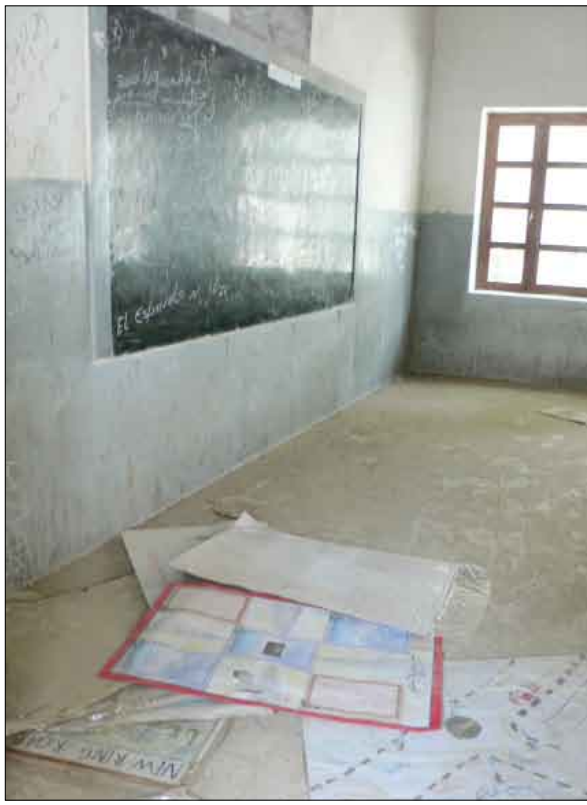
مدرسة الميناء - صفوف تشكو الإهمال!!