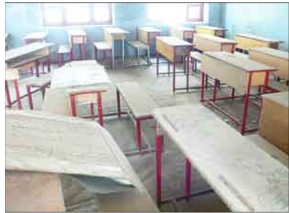
مدرسة الميناء - صفوف تنتظر النظافة

ماء يعني (الحمامات طبعاً) .. نحن مدرسة ثانوية ومفروض أن تكون قد استكمل ترميمها لكننا جئنا إلى إحدى المدارس التي هي بالأساس مدرسة موحدة لا تصلح لأن تكون مدرسة ثانوية وجئنا على هذه الوضعية الخرابية خصوصاً الحمامات وصبرنا عليها على أساس أن الطلاب عليهم أن يتصرفوا لكن الآن نحن في حالة وباء .. والوباء يريد النظافة ناهيك عن أن المدرسة من الصعب جداً أن تكون نظيفة على اعتبار أن المدرسة مفتوحة لأبناء الشوارع بطريقة قانونية وكأنه حق مشروع لهم .. ولو نظرنا إلى المدرسة يدخلها الكل .. صفوف مفتوحة والله يعلم من يدخلها بعد انتهاء الدوام الدراسي فنقول يفترض أن التحسين قد بدأ .. كان يبدأ قبل فتح المدارس حتى نحن مدراء المدارس والمدرسون .. لم يتم استدعاؤنا لا المشرفون الصحيون لعمل دورات أو عمل إرشادات ولم يجر أي شيء .. معطلنا لفترة أيام أخرى ماذا سيجري ونحن في بعض الأحيان نعطل الدراسة لأشياء أخرى .. ماذا سيجري إذا أعطونا إرشادات في الجانب الصحي ماذا نعمل أو ماذا نفعل؟ أو أعطونا أي مستلزمات أخرى نحن محتاجون لدورات حتى في الإسعافات الأولية .. لكن للأسف التربية الآن مهمتها فقط بحاجه اسمها (التدوير) تدوير مدراء المدارس ومدراء التربية .. والتدوير يعني أن الذي له سنتان أو ثلاث سنوات يعطونه إلى مكان آخر وهكذا مشغولون بقصة التدوير وإلى الآن لم يتم استدعاؤنا أو الجلوس معنا ولا للمشرفين الصحيين أي لا يوجد أي شكل من أشكال الخوف من خطورة قائمة وهي خطورة عالمية يعرفها الصغير قبل الكبير .. المهم الذي أريد أن أقوله إنه لا توجد أي توجيهات أو استعدادات