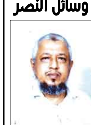
عبد الجبار ثابت الشهابي

عندما قامت الثورة اليمنية (26 سبتمبر، و 14 أكتوبر) لم تقم على أرض قد فرشت لها بالورود، بل قامت على قاعدة صراع الحق والباطل، صراع أكثرية، وغالبية عظمى لا تملك سوى إرادة الثورة، والاستعداد للموت من أجل نصرتها، ونصرة أهدافها، وقضاياها العادلة، وفي المقابل أقلية طاغية ومغتصبة تملك كل شيء سوى قلوب الناس، وتملك قدرة الأهلاك والإفساد لكنها في الوقت نفسه غير مستعدة للموت تحقيقاً لأهدافها، وانتصاراً لمبادئها، وبالتالي، فإن المعركة لم تكن متكافئة .. فهي بين من لا يملك سوى نفسه، والاستعداد للموت من أجل حريته، ومن يملك العد، والعتاد، والنار، والحديد .. فهي في الحقيقة استمالة طرف من أجل الحياة، وحياة طرف آخر لا يرى قدراً للحياة غير .. وهكذا، فقد كانت الثورة مغامرة المستميت من أجل الحياة. وهي هذه الثورة، وما شهدته من الأحوال والمعارك، لم تكن الانتصارات هي العنصر الوحيد في محصلات التفاني، بل كانت الهزائم والمؤامرات والانطلاقات والانكشافات .. لكن .. كان الصوت العالي هو صوت الإرادة الحرة.. صوت العزم .. صوت الانطلاق نحو التالي دون النظر في النتائج. الكل في المعركة .. المقاتل .. المخطط .. الكاتب .. الصحفي .. الشاعر.. الرسم .. المطرب .. المنشد .. العجوز في محرابها .. المرأة مع أطفالها .. الجميع يشركون في المعركة .. كل حسب طاقته .. وحسب ما يجيد من العمل .. وحسب ما يملك من العلم ومن الثقافة .. الجميع كانوا في معركة الثورة ضد الطغيان وضد المحتلين، وضد السلاطين والعملاء والمترتبة من أعداء الثورة.