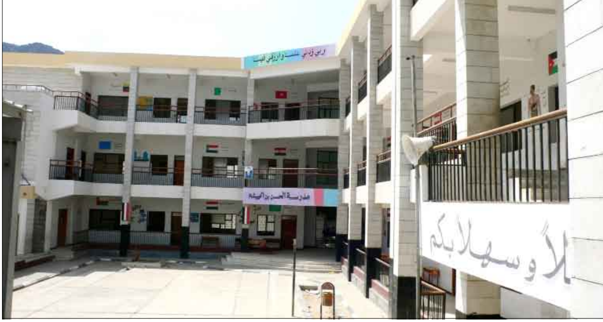
مدرسة ابن الهيثم - التواهي