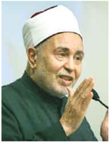
شيخ الأزهر محمد سيد طنطاوي