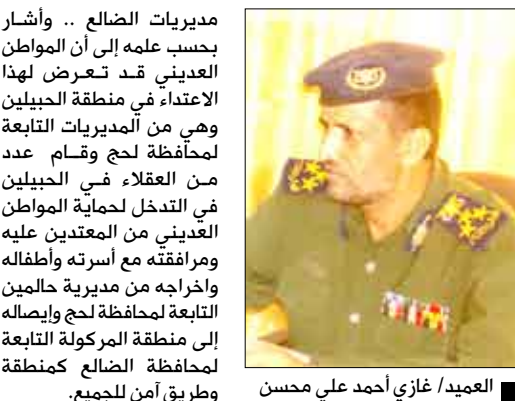
العميد /غازي أحمد علي مسخن

الحوطة/عادل قائله، تمكنت الأجهزة الأمنية في محافظة لحج من إلقاء القبض على سارق الدرجات بعد أن تقدم عدد كبير من المواطنين بلاغات حول سرقة دراجاتهم النارية. وأفاد الأخ العقيد / علي أحمد عامر مدير أمن الحوطة بأن إدارة الأمن شكلت فريق بحث وتحرر منها من وضع خطة محكمة استطاعت من خلالها الوصول إلى الموهب والذي يدعى ( ف . س ) من سكان قرية الخداد. وأضاف أنه تمت متابعة المتهم خلال تنقله ما بين محافظتي الضالع وأبين حيث قام ببيع دراجتين هناك بمبلغ مائة ألف ريال وتم احتجاز الدرجات في شرطة زنجبار.