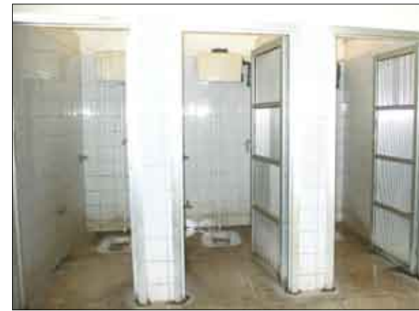
حمامات بحاجة إلى نظافة

غير الاستعداد العادي مثل كل عام وكأنه لا توجد أي خطورة صحية قائمة لنا، أو أننا نعاين أو ناس صنع عما يجري حولنا .. المهم مدارسنا لا تصلح في ظل هذه الظروف التي تتجمع فيها هذه الكثافة الطلابية الكبيرة خاصة في مدينة عدن .. فمدارس التواهي أو المعلا لا توجد فيها كثافة طلابية بل الكثافة الطلابية نجدها في منطقة الشيخ عثمان أو المنصورة وكريتر ودار سعد ..