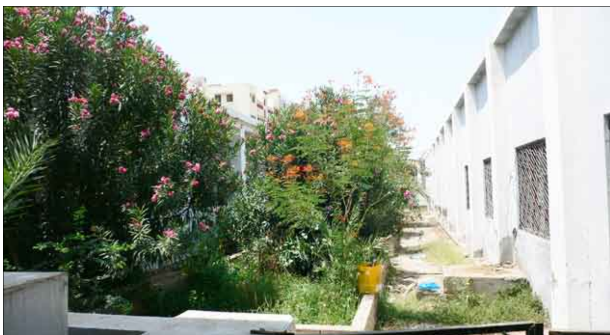
مدرسة ريدان - المعلا (عنوان للنظافة والتشجير والتفوق)

وترتيبه ونحاول الآن توفير الكراسي فبدلاً من أن يكون الكرسي ثلاثة نحاول قدر الإمكان أن يجلس عليه أثنان فقط حتى نحافظ على راحة الطلاب وفي نفس الوقت نجنبهم الكثافة والازدحام من أجل أن نقيم من هذه الأمراض .. فنحن دائماً ما نتواصل مع إدارة التربية ومع مشرف التعليم العام من أجل معرفة ماهي النواقص والإرشادات ومدى استعدادنا للعام الدراسي الجديد.