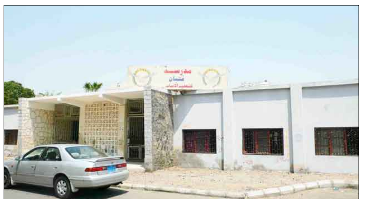
مدرسة قتيان - المعلا (النظافة والانضباط قبل كل شيء)

ماء يعني (الحمامات طبعاً) .. نحن مدرسة ثانوية ومفروض أن تكون قد استكمل ترميمها لكننا جئنا إلى إحدى المدارس التي هي بالأساس مدرسة موحدة لا تصلح لأن تكون مدرسة ثانوية وجئنا على هذه الوضعية الخرابية خصوصاً الحمامات وصبرنا عليها على أساس أن الطلاب عليهم أن يتصرفوا لكن الآن نحن في حالة وباء .. والوباء يريد النظافة ناهيك عن أن المدرسة من الصعب جداً أن تكون نظيفة على اعتبار أن المدرسة مفتوحة لأبناء الشوارع بطريقة قانونية وكأنه حق مشروع لهم .. ولو نظرنا إلى المدرسة يدخلها الكل .. صفوف مفتوحة والله يعلم من يدخلها بعد انتهاء الدوام الدراسي فنقول يفترض أن التحسين قد بدأ .. كان يبدأ قبل فتح المدارس حتى نحن مدراء المدارس والمدرسون .. لم يتم استدعاؤنا لا المشرفون الصحيون لعمل دورات أو عمل إرشادات ولم يجر أي شيء .. معطلنا لفترة أيام أخرى ماذا سيجري ونحن في بعض الأحيان نعطل الدراسة لأشياء أخرى .. ماذا سيجري إذا أعطونا إرشادات في الجانب الصحي ماذا نعمل أو ماذا نفعل؟ أو أعطونا أي مستلزمات أخرى نحن محتاجون لدورات حتى في الإسعافات الأولية .. لكن للأسف التربية الآن مهمتها فقط بحاجه اسمها (التدوير) تدوير مدراء المدارس ومدراء التربية .. والتدوير يعني أن الذي له سنتان أو ثلاث سنوات يعطونه إلى مكان آخر وهكذا مشغولون بقصة التدوير وإلى الآن لم يتم استدعاؤنا أو الجلوس معنا ولا للمشرفين الصحيين أي لا يوجد أي شكل من أشكال الخوف من خطورة قائمة وهي خطورة عالمية يعرفها الصغير قبل الكبير .. المهم الذي أريد أن أقوله إنه لا توجد أي توجيهات أو استعدادات