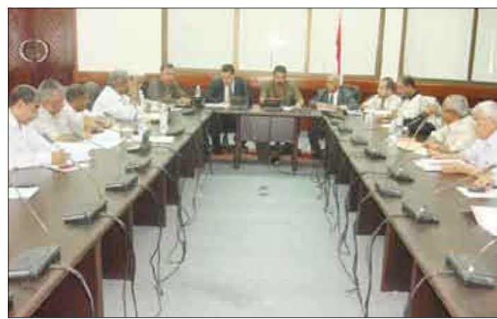
المقر عقد في نوفمبر العام الجاري. وأضاف الأخ المحافظ أن عقد ندوة خلق بيئة الاستثمار المقرر اقامتها في 22 من الشهر الجاري ستساعد على إبراز مكانة

القوة والضعف في المجالات الاقتصادية والاستثمارية داخل المحافظة من خلال إشراك كافة الجهات المعنية بالاستثمار. وتطرق اللجنة في اجتماعها إلى مستوى التحضير والاستعداد للمؤتمر من قبل الغرفة التجارية والصناعية في عدن وهيئة الاستثمار والمنطقة الحرة وكذا الجهات الأخرى المعنية وتقديم واستعراض الفرص الاستثمارية المتوفرة في العديد من القطاعات التي سيتم تقديمها وعرضها في المؤتمر. كما تطرقت اللجنة أيضا إلى الموافقات التي تم تلقيها من قبل المنظمات والغرف التجارية والأجنبية والمنظمات الدولية والسفارات والاتحادات الخارجية في عموم دول العالم المشاركة في المؤتمر البالغ عددها 300 موافقة.