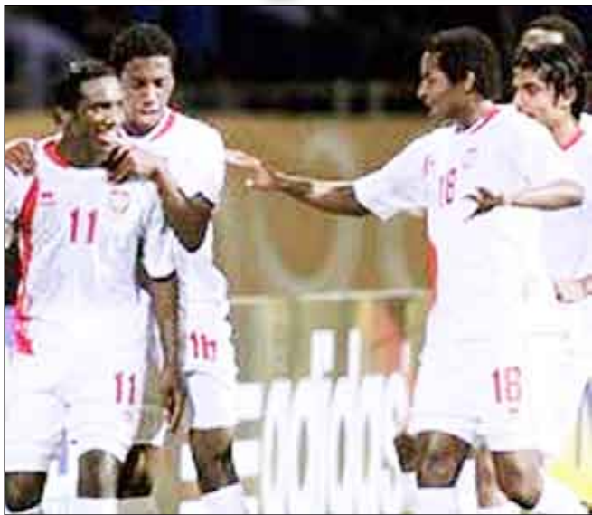
لقطة من مباريات الإمارات في البطولة

□ القاهرة / متابعة: قد يشهد ربع نهائي كأس العالم للشباب في كرة القدم المقامة في مصر حتى السادس عشر من الشهر الجاري مواجهة عربية - عربية بين منتخب مصر والإمارات في حال نجح في تخطي الدور الثاني. وتلتقي مصر في الدور الثاني في مع كوستاريكا في القاهرة غدا الثلاثاء، في حين تلعب الإمارات مع فنزويلا في السويس الأربعاء. ووفقاً للقرعة، فإن منتخب مصر والإمارات سيتواجهان في دور الثمانية في الثاني عشر من الشهر الجاري. وتصدرت مصر ترتيب المجموعة الأولى ضمن منافسات الدور الأول برصيد ست نقاط، بفارق نقطة أمام البارغواي ونقطتين عن إيطاليا، بعد فوزها على ترينيداد وتوباغو 4 - 1 وإيطاليا 4 - 2 وخسارتها أمام البارغواي 1 - 4 وحلت الإمارات ثانياً في المجموعة السادسة برصيد أربع نقاط بفارق الأهداف أمام جنوب أفريقيا ونقطتين خلف المجر، بعد تعادلها مع الأولى 2-2 وفوزها على هندوراس 1 - صفر وخسارتها أمام المجر صفر - 2. وفي المباريات الأخرى ضمن الدور الثاني، تلعب إسبانيا مع إيطاليا، والبارغواي مع كوريا الجنوبية، وغانا مع جنوب أفريقيا، والمجر مع تشيكيا، والبرازيل مع الأوروغواي وألمانيا مع نيجيريا.