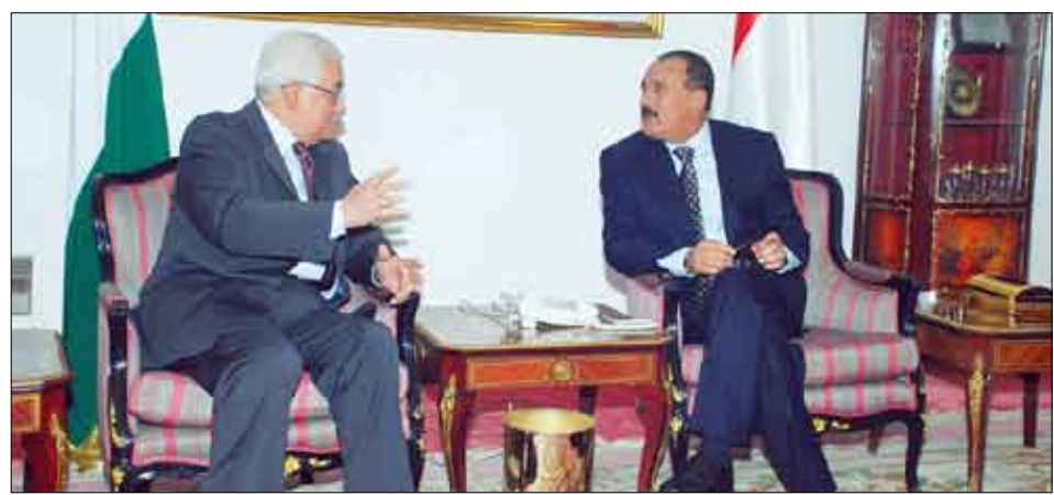
رئيس الجمهورية يستقبل الرئيس الفلسطيني محمود عباس أمس

استقبل فخامة الاخ الرئيس علي عبدالله صالح رئيس الجمهورية مساء أمس ومعاه الاخ عبدييه منصور هادي نائب رئيس الجمهورية أخاه فخامة الرئيس محمود عباس أبو مازن رئيس السلطة الوطنية الفلسطينية ورئيس اللجنة التنفيذية لمنظمة التحرير الفلسطينية الذي يزور بلادنا حالياً .