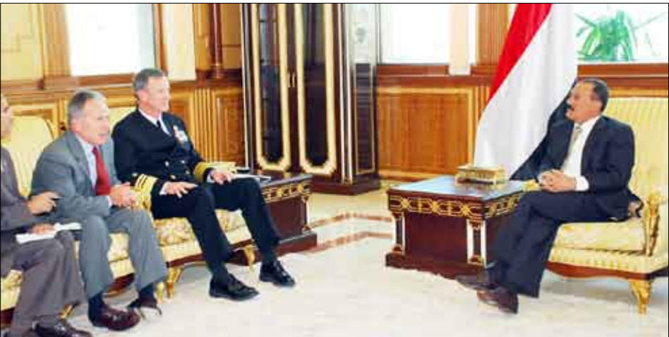
الرئيس يستقبل قائد العمليات الخاصة بالولايات المتحدة الأمريكية الأدميرال وليام مكرافن

وأشاد الأدميرال مكرافن بالعلاقات ومستوى التعاون القائم بين البلدين الصديقين وبالجهود التي تبذلها اليمن في مجال مكافحة الإرهاب. حضر المقابلة السفير الأمريكي بصنعاء ستيفن سبيتش.