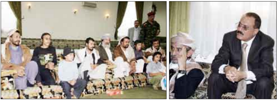
رئيس الجمهورية يتفقد أحوال الأسر اليهودية اليمنية النازحة من منطقة آل سالم بصعدة

وقد عبرت تلك الأسر عن تقديرها وامتنانها لفخامة الرئيس لما تحظى به من الرعاية والأمان بعد الاعتداءات والتهديدات العنصرية التي مورست ضدها من قبل عناصر فتنة الإرهاب والتخريب التابعة للحوثي والتي سلبتهم حقوقهم وممتلكاتهم وأجبرتهم تحت التهديد على النزوح وترك منطقتهم في آل سالم التي عاشوا فيها جيلاً بعد جيل ولحقب زمنية طويلة جنباً إلى جنب مع إخوانهم المواطنين في المنطقة بسلام وأمان وتآلف حتى جاءت هذه العصابة الإجرامية العنصرية الممتطفة ومراسمت ضدهم كل أشكال الاضطهاد والانتهاكات الانسانية التي تخالف الدين والأعراف والتقاليد والقيم الأصيلة للشعب اليمني.