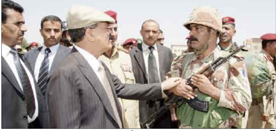
رئيس الجمهورية لدى زيارته لعدد من الوحدات العسكرية أمس

وأشاد الأدميرال مكرافن بالعلاقات ومستوى التعاون القائم بين البلدين الصديقين وبالجهود التي تبذلها اليمن في مجال مكافحة الإرهاب. حضر المقابلة السفير الأمريكي بصنعاء ستيفن سبيتش.