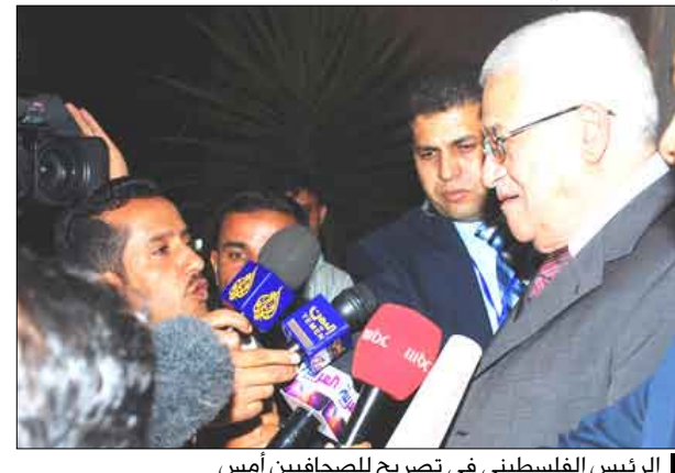
الرئيس الفلسطيني في تصريح للصحافيين أمس

الاستيطانية في القدس والضفة الغربية واعتداءاتها المستمرة على قطاع غزة . وفي شأن قراره بتشكيل لجنة وطنية لبحث ملامسات تأجيل النظر في تقرير غولدستون أوضح الرئيس عباس أن "موضوع التأجيل لم يأت من عندنا لأننا لسنا أعضاء في هذه المؤسسة الدولية والذي قدم الطلب هو الدول العربية والذي قرر تأجيل النقاش لثلاثة أشهر هي الدول العظمى وبموافقة الأطراف العربية والإفريقية والإسلامية ."