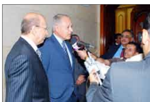
أبو الغيط في تصريح للصحافيين أمس

أكد وزير الخارجية المصري أحمد أبو الغيط ووقوف بلاده مع اليمن حكومة وشعباً مشيراً إلى أن القاهرة ترفض كل أنواع التمرد والتدخلات الأجنبية في شؤون اليمن. وقال أبو الغيط في تصريح لوسائل الاعلام إن زيارته لليمن جاءت لنقل رسالة إلى فخامة