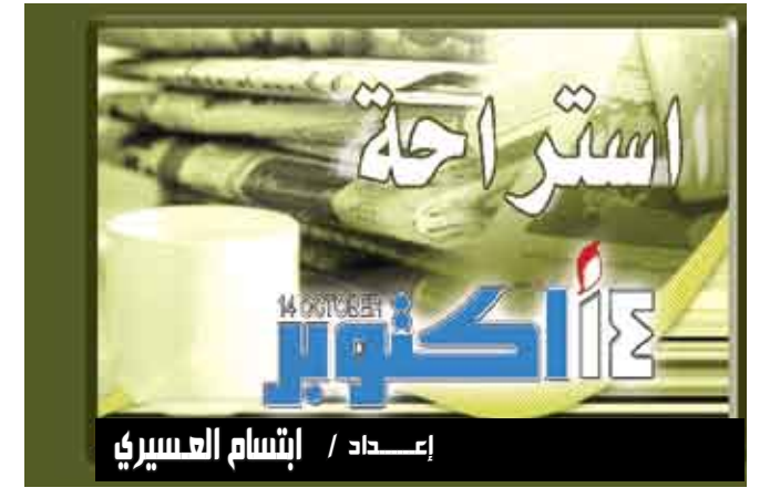
إعداد / إنشام العسيري

واشنطن / متابعة : قال علماء إن السموم الموجودة في بعض الأسماك يمكن أن تهاجم الخلايا السرطانية في الجسم وتفتك بها. وذكر موقع "ساينس ديلي" أن دراسة أجرتها خدمة الأبحاث الزراعية والاختصاصي في علم الجراثيم بول زيمبا والصيدلاني بيتر مويلر من الإدارة البيئية الوطنية للمحيطات في أميركا توصلت إلى أن السم المعروف باسم "إيوغلينوفيسين" euglenophycin والذي لديه تركيب جزيئي يشبه بمادة "سولنوبيسين" الجلوية الموجودة أيضاً عند "نمل النار" يمنع نمو الأورام في الجسم.