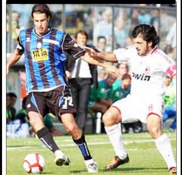
من لقاء ميلان وأتلانتا