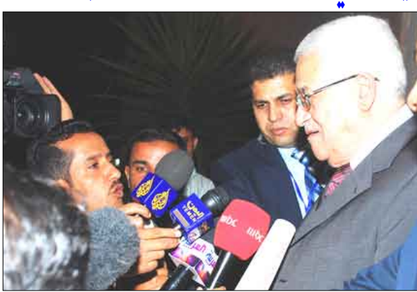
الرئيس الفلسطيني في تصريح للصحافيين أمس

الاستيطانية في القدس والضفة الغربية واعتداءاتها المستمرة على قطاع غزة . وفي شأن قراره بتشكيل لجنة وطنية لبحث ملامسات تأجيل النظر في تقرير غولدستون أوضح الرئيس عباس أن "موضوع التأجيل لم يأت من عندنا لأننا لسنا أعضاء في هذه المؤسسة الدولية والذي قدم الطلب هو الدول العربية والذي قرر تأجيل النقاش لثلاثة أشهر هي الدول العظمى وبموافقة الأطراف العربية والإفريقية والإسلامية".