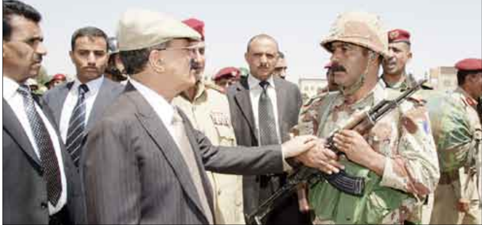
رئيس الجمهورية لدى زيارته لعدد من الوحدات العسكرية أمس

وأشاد الأدميرال مكرافن بالعلاقات ومستوى التعاون القائم بين البلدين الصديقين وبالجهود التي تبذلها اليمن في مجال مكافحة الإرهاب. حضر المقابلة السفير الأمريكي بصنعاء ستيفن سبيتش.