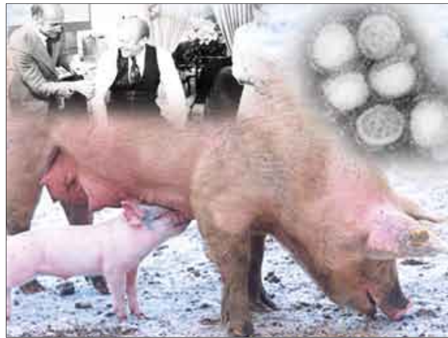
لدى الخنازير القدرة على استضافة أنواع مختلفة من الأنفلونزا ما يؤدي إلى ظهور أنماط جديدة من هذه الفيروسات

يفترض بعض العلماء أن أول وباء لأنفلونزا الخنازير انتشر بين البشر حصل عام 1918، حيث ثبت إصابة الخنازير بالعدوى من إصابة البشر، إلا أنه لم يثبت بشكل قاطع من تلقى العدوى أولا. وتم التعرف على أول فيروس أنفلونزا كسبب لأنفلونزا لدى الخنازير عام 1930. وخلال الستين سنة التي تلت هذا الاكتشاف كان فيروس H1N1 هو الفيروس الوحيد المعروف لأنفلونزا الخنازير. وبين عامي 1997 و 2002 تم التعرف على ثلاثة أنماط جديدة من فيروسات أنفلونزا الخنازير في أمريكا الشمالية. فبين العام 1997 و 1998 انتشر الفيروس H3N2 الناتج من عملية إعادة تشكيل الفيروس من فيروس يصيب البشر وأخرى يصيب الطيور والخنازير، منذ ذلك الحين يعتبر الفيروس H3N2 أحد السببات الرئيسية لأنفلونزا لدى الخنازير في أمريكا الشمالية. ثم نتج من إعادة تشكيل H1N1 و H3N2 نوعان فيروس جديد وهو H1N2. وفي عام 1999 ظهر نمط جديد من الفيروسات وهو H4N6 الذي نتج من عبور بين الأنصاف من الطيور إلى الخنازير، وسبب فاشية صغيرة وتم تحديدها في مزرعة في كندا. أكثر الفيروسات المسبب لأنفلونزا الخنازير انتشارا هو الفيروس H1N1، وهو أول الفيروسات التي اندحرت من وباء أنفلونزا 1918. ولكن كان انتقال الفيروس من الخنازير إلى البشر نادر الحدوث