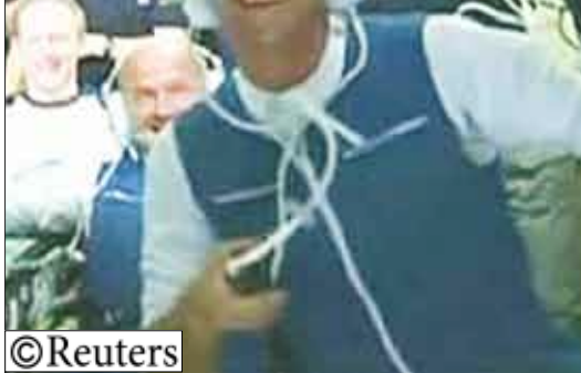
الميلادير الكندي اسيرك دو سولاي على متن المركبة الروسية

وأدى اعتقال بولانسكي - الذي فاز بجائزة أوسكار عن فيلمه "عازف البيانو" The Pianist - في 2002 - ضجة في فرنسا لكن رد الفعل صناعة السينما في هوليوود كان أكثر هدوءاً