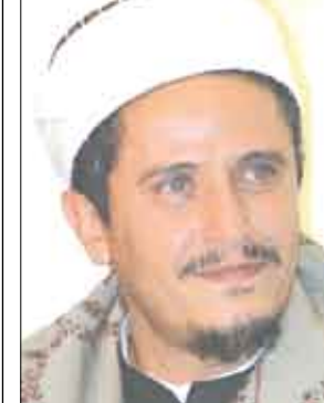
عصام عبدالوهاب السماوي

اليوم السبت بصنعاء برئاسة رئيس مجلس القضاء رئيس المحكمة العليا القاضي عصام عبدالوهاب السماوي ، أمام نتائج أعمال التحقيق التي نفذتها هيئة التحقيق الفئضاني على رؤساء وأعضاء محاكم الاستئناف عقب اجازة عيد الفطر والعطلة القضائية. وأوضح وزير العدل الدكتور غازي شائف الاغبري وكالة الأبناء اليمنية (سبأ) إن الاجتماع سيستعرض ما أظهرته نتائج التحقيق من أوجه قصور وسبل معالجتها بالإضافة إلى نتائج التحقيقات مع قضاة الذين ثبت تقصيرهم في أداء واجباتهم الوظيفية. وأضاف أن الاجتماع سيناقش أيضاً العديد من الموضوعات المتعلقة برفع مستوى الأداء في المحاكم و منها تطبيق ما ورد في لائحة أعمال المحاكم التي صدرت مؤخرا، وتبني قيام رؤساء محاكم الاستئناف بواجباتهم في الإشراف والمتابعة على مختلف أعمال المحاكم.