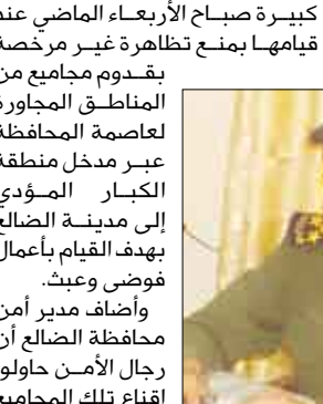
العميد / غازي أحمد علي محسن

كبيرة صباح الأربعاء الماضي عند قيامها بمنع تظاهرة غير مرخصة بتقدم مجامع من المناطق المجاورة لعاصمة المحافظة عبر مدخل منطقة الكبار المؤدي إلى مدينة الضالع بهدف القيام بأعمال فوضى وعبت. وأضاف مدير أمن محافظة الضالع أن رجال الأمن حاولوا إقناع تلك الجماعات بحضوره والتفكير بالقوانين وإشهار أي تصريح من قبل السلطة المحلية يسمح لهم القيام