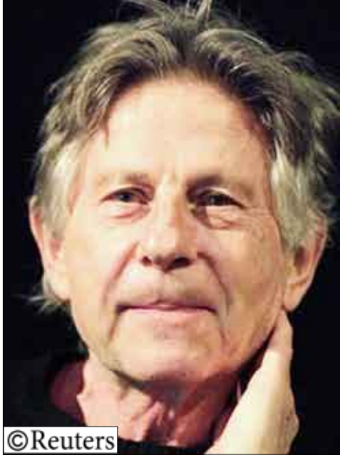
المخرج رومان بولانسكي