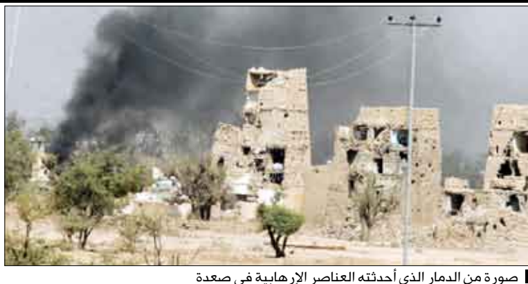
صورة من الدمار الذي أحدثته العناصر الإرهابية في صعدة