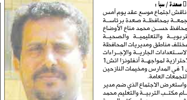
حسن محمد مناع

عاد إلى صنعاء أمس وزير الأوقاف والإرشاد حمود الهتار بعد مشاركته في اجتماع رؤساء بعثات الحج العربية الذي اختتم أعماله مؤخرًا في مدينة جدة. وأوضح الهتار أن وزارته تعمل جاهدة مع الجهات المختصة في المملكة العربية السعودية لتأمين الوقاية الصحية لحجاج بيت الله الحرام الذين سيؤدون مناسك الحج لهذا العام. وأن الوزارة على وشك استكمال الترتيبات الخاصة بتفويجهم إلى المشاعر المقدسة.