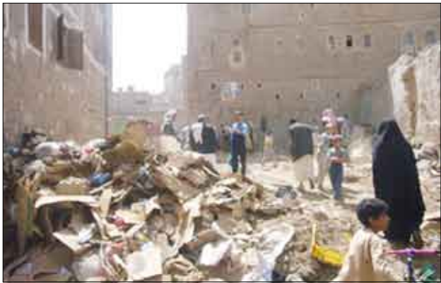
هذه المخلفات توفر بيئة مناسبة لتكاثر الذباب والفران والحشرات.

في دراسة: تحويل المخلفات المنزلية إلى سمد عضوي للاستخدام الزراعي