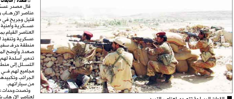
القوات المسلحة تتصدى لعناصر التمرد

صعدة / منابيات: قال مصدر عسكري مسئول إن العشرات من عناصر الإرهاب والتخريب سقطوا أمس بين قتيل وجريح في مواجهات متفرقة مع وحدات عسكرية وأمنية أثناء محاولة مجاميع من تلك العناصر القيام بمحاولات لتسلل لمهاجمة مواقع عسكرية وتنفيذ اعتداءات على المواطنين في منطقة حرف وسفيان وبعض المناطق بمحافظة صنعاء. وأوضح المصدر أن 28 إرهابياً قتلوا وتم تدمير أسلحة لهم بينما رشاش أثناء محاولتهم التسلل إلى منطقة ال عقاب، كما تم مهاجمة مجاميع لهم في الملاحيز والحصامة ووادي الجرائب وتكبيدهم خسائر فادحة واحراق عدد من سياراتهم. وتصدت وحدات عسكرية وأمنية لمحاولة تسلل لعناصر الإرهاب شمال غرب المنزل ومنطقة