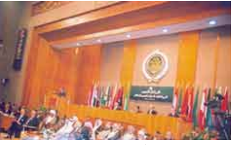
البرلمان العربي / ارشيف

صنعاء / منابيات: أكد البرلمان العربي تضامنه الكامل مع القيادة السياسية والشعب اليمني في مواجهة الأعمال الإرهابية لعصابة الإرهاب والتخريب. وقال نور الدين بوشوك الأمين العام للاتحاد البرلماني العربي في رسالة لفخامة الأخ الرئيس علي عبدالله صالح رئيس الجمهورية « إنني أتابع بقلق وغضب أبناء القتال الدامي الذي فرضته عليكم وعلى البلاد شرمة المعارضين الذين لا يرون عهداً ولا ذمة، وقد هانت عليهم أرواح شعبهم وبني جلدتهم، وقاسوا بعيونهم في الأرض فساداً، لا تهمهم إلا مصالحهم الضيقة التي