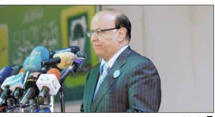
نائب الرئيس يلقي كلمة المؤتمر الشعبي العام في الخرطوم

الخرطوم / سيا: لقى الأخ عبد ربه منصور هادي نائب رئيس الجمهورية أمس في العاصمة السودانية الخرطوم كلمة المؤتمر الشعبي العام في مستهل تشييد أعمال المؤتمر الوطني السوداني في الدورة الثالثة بالخرطوم وسط حضور ما يزيد على خمسين حزباً وتنظيماً سياسياً من خمسة وثلاثين بلداً من مختلف أنحاء المعمورة. وخاطب المؤتمرين قائلاً: إن مؤتمركم هذا انعقد في مرحلة حساسة ودقيقة من تاريخ السودان الشقيق والمنطقة وأمتنا العربية والإسلامية ولاشك في أنه يمثل إحدى المحطات المهمة في مسيرة المجابهة الفكرية والسياسية والاقتصادية