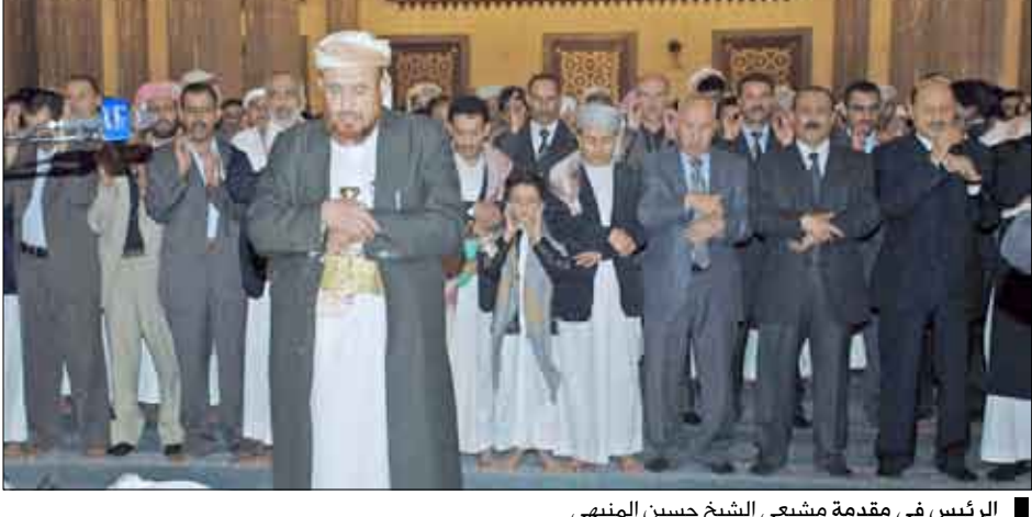
الرئيس في مقدمة مشيخي الشيخ حسين المنبهي

الراحل ودوره في خدمة الوطن والعمل البرلماني، حيث كان يرحمه الله من الشخصيات البارزة التي لها ادوار في مسيرة الثورة والجمهورية والدفاع عن الوحدة والتصدي لفننة الإرهاب والتخريب التي أشعلتها هذه العناصر التخريبية. وكان للفقيه مساهمات كثيرة في خدمة أبناء المحافظة منذ مطلع السبعينيات وحل الخلافات القبلية وإصلاح ذات البين. تعمد الله الفقيد بواسع الرحمة والغفرة وأسكنه فسيح جناته وألهم أهله وذويه الصبر والسلوان، إنا لله وإنا إليه راجعون.