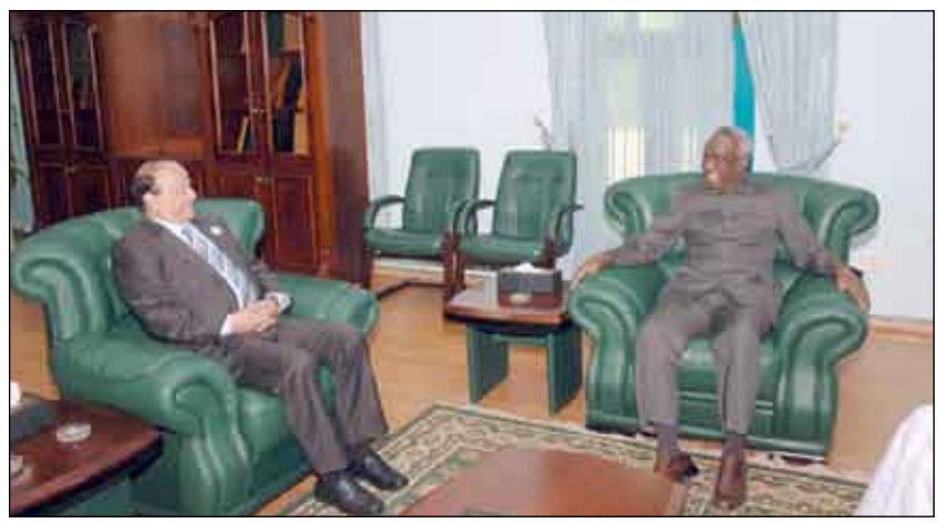
نائب الرئيس لدى لقائه نظيره السوداني

وان التحديت الكبيرة ليست أمام السودان واليمن فحسب بل تواجه الأمة العربية كلها.