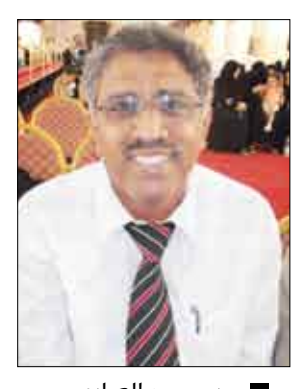
■ د. محمد العبادي

بناءً على التقويم الجامعي لجامعة عدن وبناء على منشور وزارة التعليم العالي والبحث العلمي الذي نص على تأجيل فترة الدراسة لمدة أسبوع ، كان من المقرر بداية العام الدراسي في جميع كليات جامعة عدن يوم الأحد الماضي الموافق 27 سبتمبر 2009م . ذكر ذلك للصحيفة الدكتور محمد أحمد العبادي نائب رئيس جامعة عدن لشؤون الطلاب وأشار إلى أن التأجيل كان بسبب ظهور فيروس انفلونزا الخنازير المسمى عمياً بـ ( أتش 1 إن 1 ) ، وأوضح الدكتور العبادي أنه قد تقرر بدء العام الدراسي الجامعي 2009 / 2010م يوم السبت القادم الموافق 3 أكتوبر 2009م حيث أهابت نيابة شؤون