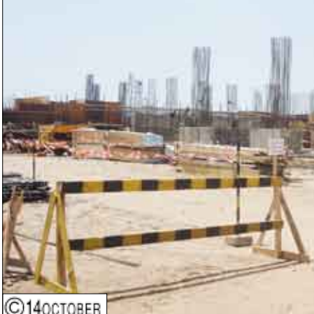
■ الجبفري يتفقد مشروع بناء الشقق الفندقية بعدن في منطقة الحسوة