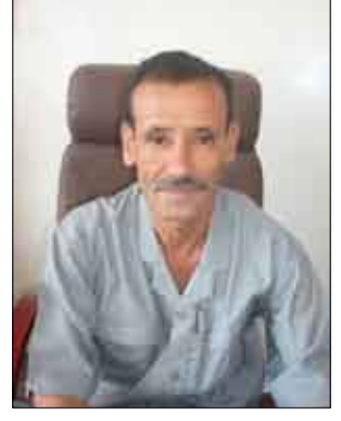
■ العقيد جبر ناجي يتعرض لحادث مروري

■ منعاه/ سبأ: صرح مصدر مسؤول بوزارة الداخلية بأن وكيل الجهاز المركزي للأمن السياسي لمحافظات عدن ولحج وأبين اللواء ناصر منصور هادي شقيق الأخ عبد ربه منصور هادي نائب رئيس الجمهورية تعرض أمس لمحاولة اغتيال غادرة في مدينة زنجبار محافظة أبين من قبل العناصر التخريبية الخارجة على الدستور والنظام والقانون والتابعة للمدعو طارق الفضلي . وقال المصدر لوكالة الأنباء اليمنية (سبأ) : "إن تلك العناصر قامت بإطلاق وإبل من نيران أسلحتها على سيارة الأخ اللواء ناصر منصور هادي أثناء وجوده فيها وعدد من مرافقيه، حيث أسفر الحادث عن إصابة اثنين من المرافقين إصابة أهدمها بليغة" . وأكد المصدر أن الجناة لن يفلتوا