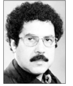
الشاعر العماني / سيف الرحبي

نحاول أن ننسى ماذا نحاول أن ننسى؟ الخنجرُ المسموم أنجز مهمته بضراوة والذي عرض ساعة الفراق بفؤديه كنهرين صغيرين، اختفت في الظلمة حيث كان كلبُ يعوي حيث قطارُ يلهث الربيع ولم اعد أرى في معترك أيامي عدا شبح قرصانٍ يفترس أضلعه في كوخ.