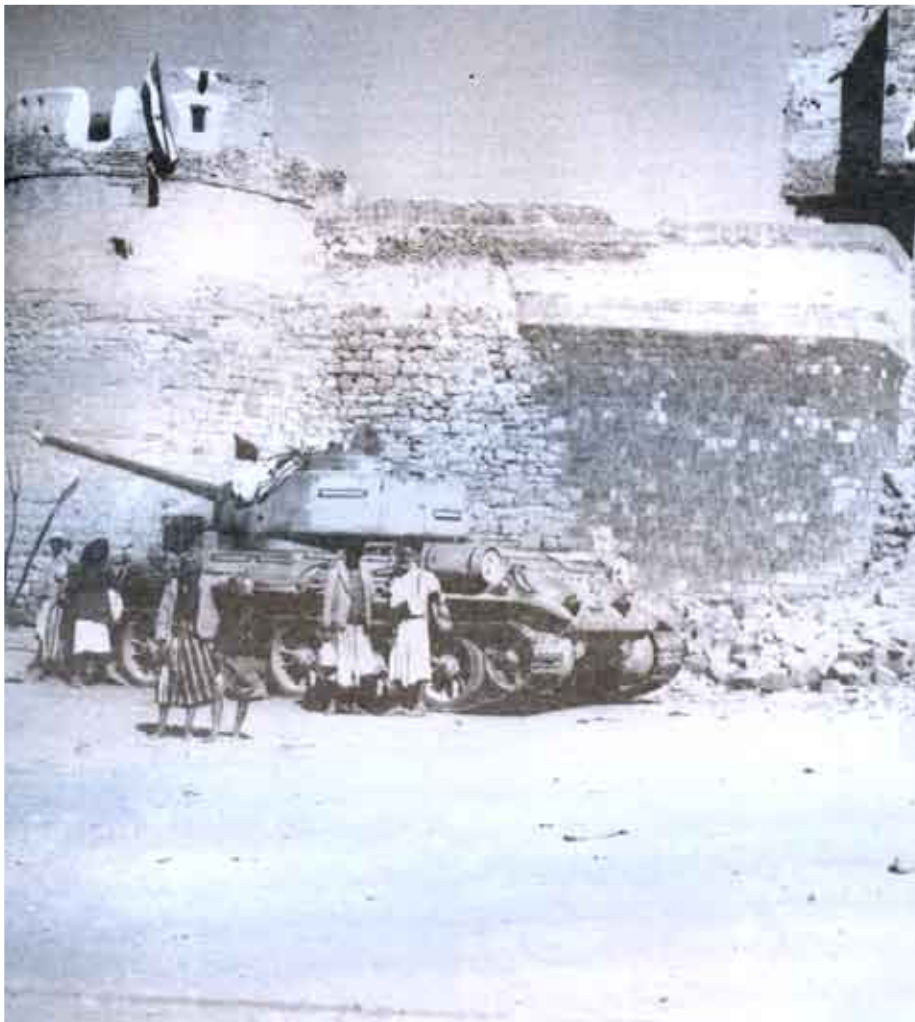
قصر السلاح يرفرف عليه علم الثورة بعد أن كان قبل ثلاثة أيام منها سجنا للثوار