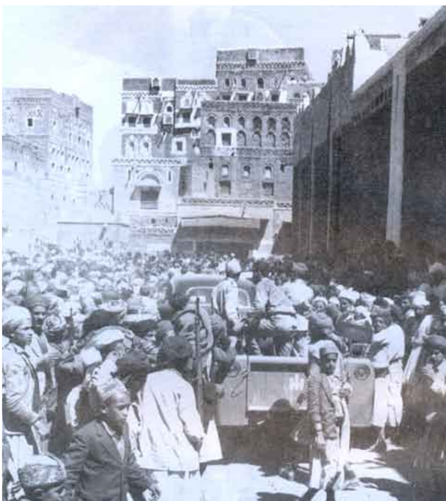
ساحة الجامع الكبير بصنعاء تشهد تجمعا للجماهير في يوم الجمعة تاسع أيام الثورة