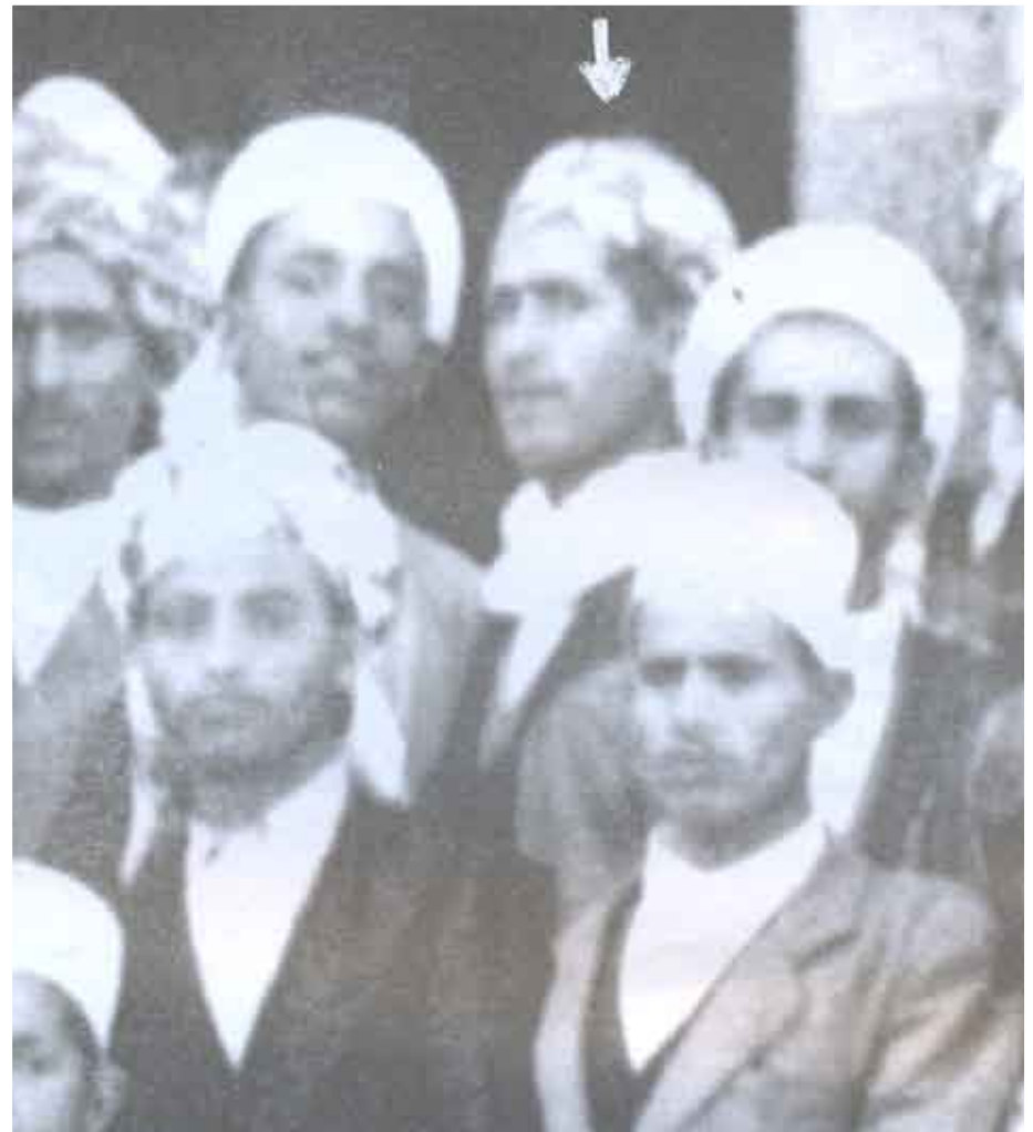
صورة نادرة للشهيد علي عبد المغني .. مهندس الثورة وعقلها المدبر