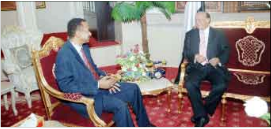
نائب الرئيس لدى لقائه أمس مستشار الرئيس السوداني

بالعلاقات الأخوية بين البلدين والشعبين الشقيقين. وقد رحب الأخ نائب رئيس الجمهورية بهذه الدعوة، مبدياً حرصه على تليتها. وأكد عمق ومتانة العلاقات الأخوية الحميمة التي تربط البلدين والشعبين الشقيقين، مشيراً إلى أن القيادة السياسية تتابع باهتمام مجريات الأحداث في السودان باعتبارها بلداً جارياً ويهم اليمن ما يجري فيه. وحمل الأخ نائب الرئيس المبعوث