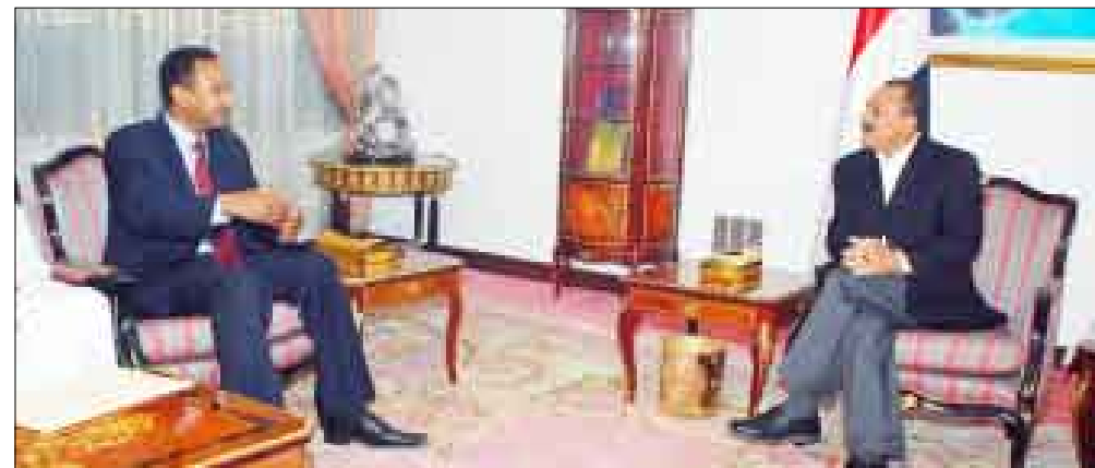
رئيس الجمهورية أثناء لقائه أمس مستشار الرئيس السوداني

بالعلاقات الأخوية بين البلدين والشعبين الشقيقين. وقد رحب الأخ نائب رئيس الجمهورية بهذه الدعوة، مبدياً حرصه على تليتها. وأكد عمق ومتانة العلاقات الأخوية الحميمة التي تربط البلدين والشعبين الشقيقين، مشيراً إلى أن القيادة السياسية تتابع باهتمام مجريات الأحداث في السودان باعتبارها بلداً جارياً ويهم اليمن ما يجري فيه. وحمل الأخ نائب الرئيس المبعوث