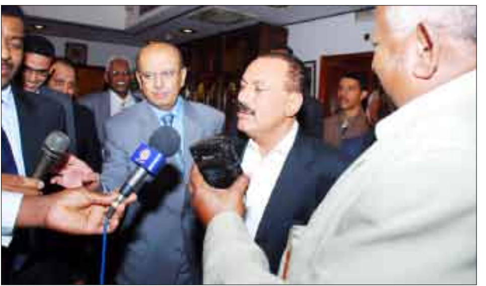
رئيس الجمهورية يتحدث إلى قناة السودان الفضائية

إراقة الدم اليمني بكل الوسائل، إلا أن عناصر الإرهاب والتخريب والتمرد رفضوا الجرح والسلام وإنهاء الفتنة وكانوا يستغلون أية هدنة ليعيدوا بناء أنفسهم مجدداً ويواصلوا أعمالهم الإجرامية والتخريب بالإعتداء على المواطنين وأبناء القوات المسلحة والأمن ونهب وتدمير المنشآت العامة والممتلكات الخاصة ويقطعون الطرق على المواطنين لإعاقة حركة السير ومنع وصول المواد الغذائية للمواطنين في محافظة صعدة أو تسويق منتجاتهم الزراعية. وأشار فخامة الأخ رئيس الجمهورية إلى أنه في ضوء استمرار جرائم تلك العناصر وأعمالها التخريبية اضطرت الدولة إلى التصدي لهم، حيث تقوم القوات المسلحة والأمن ومعها المواطنون الشرفاء من أبناء محافظة صعدة ومديرية حرف سفیان بعمران