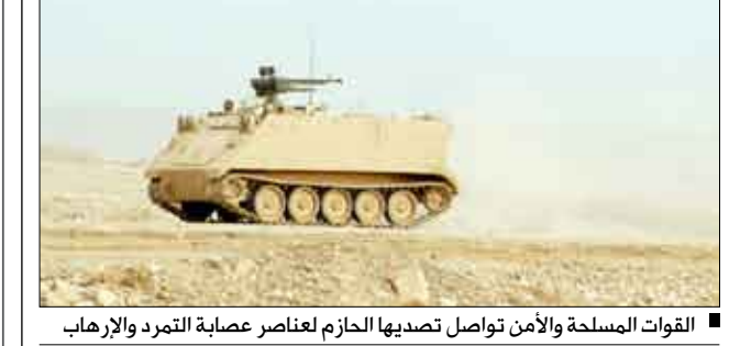
القوات المسلحة والأمن تواصل تصديها للحازم لعناصر عصابة التمرد والإرهاب

قال مصدر في اللجنة الأمنية العليا إن العناصر الإرهابية المتمردة الخارجة على النظام والقانون دأبت في الآونة الأخيرة على منع المواطنين بالقوة من النزوح إلى مناطق آمنة متخذة إياهم دروعاً بشرية بهدف إلحاق الضرر بهم.. حيث قامت تلك العناصر وقبل ثلاثة أيام بمنع المواطنين في منطقة مران من النزوح إلى مناطق آمنة وقاموا بإطلاق النار على المواطنين لمنعهم من مغادرة المنطقة وأدى ذلك إلى مقتل 8 من المواطنين.