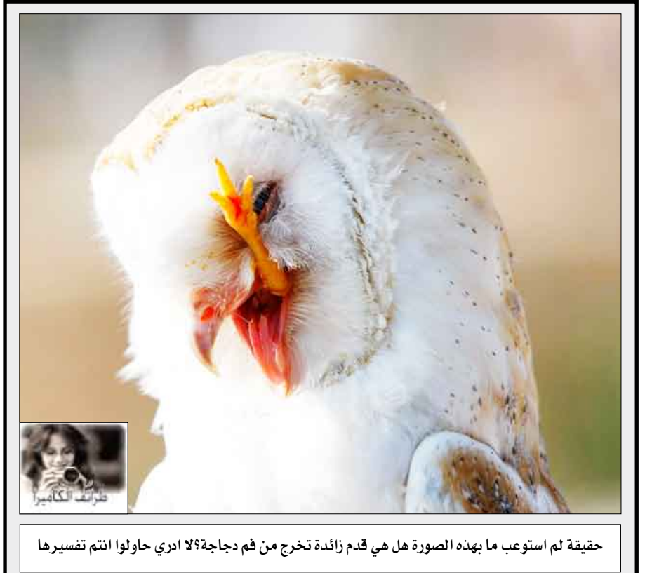
حقيقة لم استوعب ما يهذه الصورة هل هي قدم زائدة تخرج من فم دجاجة؟ لا ادري حاولوا انتم تفسيرها

القراء المشاركون في مسابقة الكلمات المتقاطعة "كنى... أسماء والقاب": تعتمد مسابقتنا في الأساس على حل الشبكة كما هي العادة في حل الكلمات المتقاطعة. بعد استكمال حل الشبكة سيظهر لكم محتوى العمودين الأوسطين (8أقياً) و (8عمودياً) وهما الأساس في الحل ومايلزم إرساله وذلك أسهل من إرسال الشبكة كاملة.