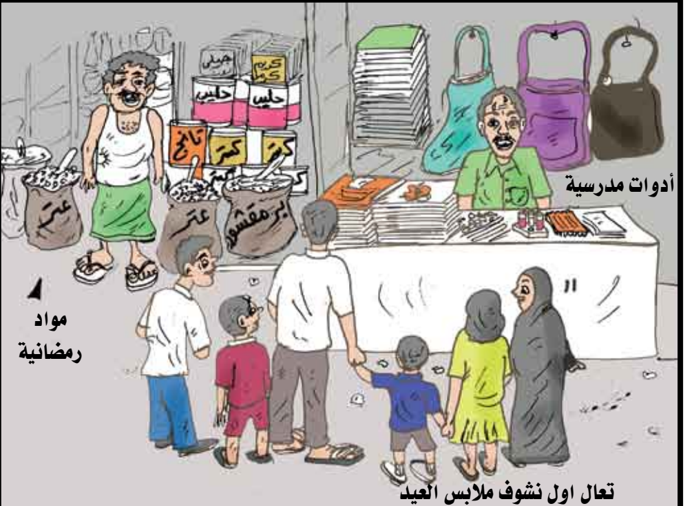
أدوات مدرسية تعال اول نشوف ملابس العيد مواد رمضانية

باختصار صنعاء المسعودي رمضان والعيد والمدارس ثلاثة مواسم متتالية شكلت ضربة لا يمكن أن تتحملها كثير من الأسر خصوصاً تلك التي لديها عدد كبير من الأولاد يدرسون في المدارس والجامعات. وعلى الرغم من أن بعض الأسر قد احتاطت أمثل هكذا مناسبات بدخول (هكية) لكن ارتفاع الأسعار نزل على الأسر وحققها (الهكبات) نزول الصاعقة. الأمر الذي يتطلب تدخل فوراً وحاسماً من قبل الجهات ذات العلاقة للجم ارتفاع الأسعار الذي بدأ يقصف حياة الناس وكأنه وباء خطير. كثير من الأسر لا تدري ماذا تعمل.. هل تلغي ملابس العيد ومتطلباته؟ طبعاً مش معقول.. إذا هل تلغي ملابس المدارس ومتطلباتها؟ طبعاً هنا باتحاصل مصيبة.. إذا ما هو الحل يا أولي الأمر إن كنتم بحق أولي أمر.. ورمضان كريم..