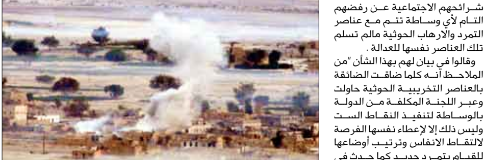
إحدى المناطق المتضررة من عناصر التمرد في صعدة

إجتماعات هذا السرطان الخبيث الذي عاث في الارض فسادا وأعاق جهود البناء والأعمار وأضر بمصالح الوطن والمواطنين وفي مقدمتهم أبناء محافظة صعدة وهذا مطلب أبناء محافظة صعدة ومشايخ وعلماء وأعيان وأعضاء مجلسي النواب