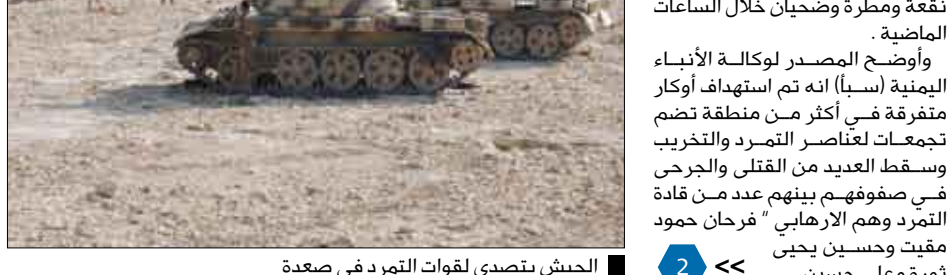
الجيش يتصدى لقوات التمرد في صعدة