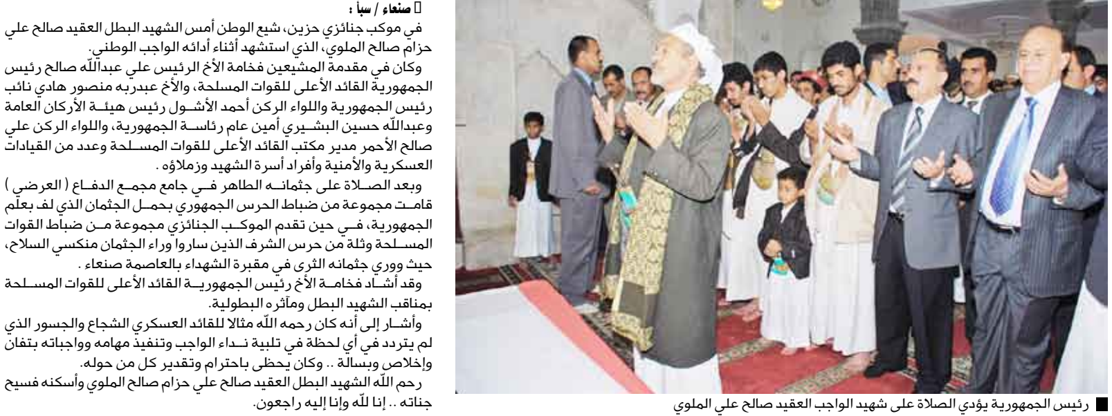
رئيس الجمهورية يؤدي الصلاة على شهيد الواجب العقيد صالح علي الملوي