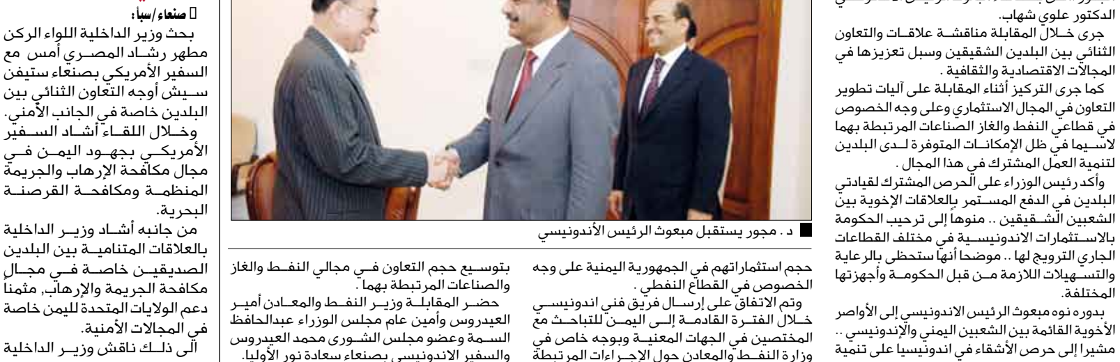
مجهور يبحث مع مبعوث الرئيس الأندونيسي علاقات التعاون بين البلدين في المجال الاستثماري