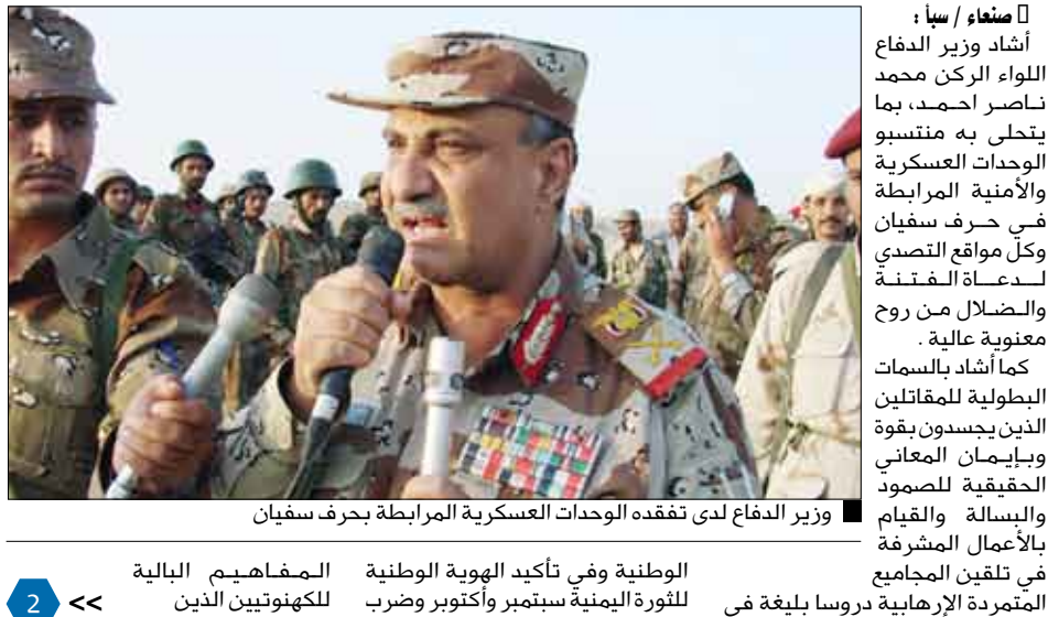
وزير الدفاع لدى تفقده الوحدات العسكرية المرابطة بحرف سفيان

الوطنية وفي تأكيد الهوية الوطنية للثورة اليمنية سبتمبر وأكتوبر وضرب للمفاهيم البالية للكهنتيين الذين