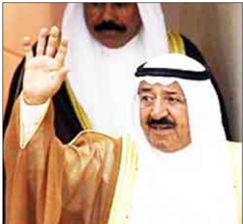
الامير صباح الأحمد

يكون ذلك مدعاة لتوحيد الصفوف في مواجهة كل من يريد بهذا الوطن سواء أو تفرقة بين أبنائه وتعكيراً لصفو أمره واستقراره». وفي إشارة ضمنية إلى الاصطفاء الذي مارسه وسائل إعلام كويتية في مسألة الشحن الطائفي قال الشيخ صباح الأحمد الصباح «وانتي اكبر دعوتي لوسائل إعلامنا المسموع والمقروء والمرئي أن تحفظ للحرية مساحتها المقبولة وأن تلتزم في ممارسة دورها حدود المسؤولية الملقاة عليها، وأن لا تكون أدوات وصراع لبث الفتنة والفوضى والشقاق والصراع بين فئات المجتمع... إن الواجب يملئ على وسائل إعلامنا المختلفة أن تكون منارات هدى ووعي تمارس نقدها برزانة وتبرؤ ما تريد إبرازه بمصادقية دون تحويل، وأن تنتقد ما تريده دون تضليل.