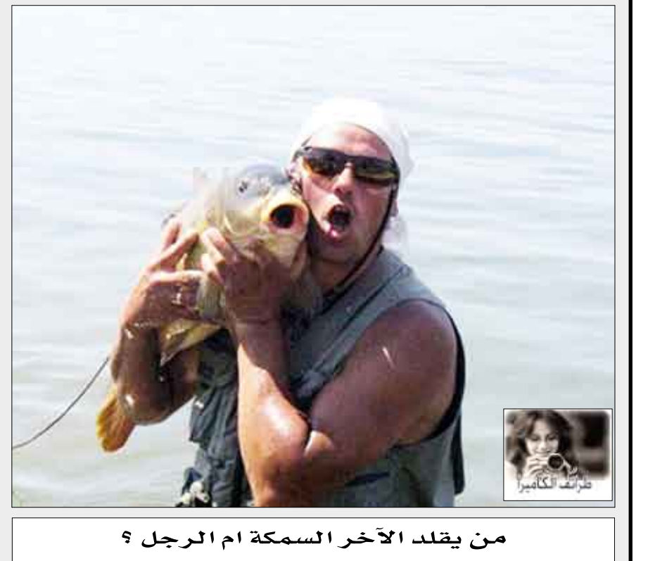
من يقلد الآخر السمكة ام الرجل ؟

عند اكتمال واستخلاص اليمين أو محتوى العمودين المذكورين اعلاه يسجل لديكم ويجمع حتى نهاية الشهر الكريم وترسل الإجابات على عناوين الصحيفة فيصحب عدد الإجابات 30x2 = 60 اسماً أو محتوى. يرفق كويون المسابقة مع كل حل شبكة حسب رقم الحلقة. الفائزون سينالون جوائز مالية مغرية.