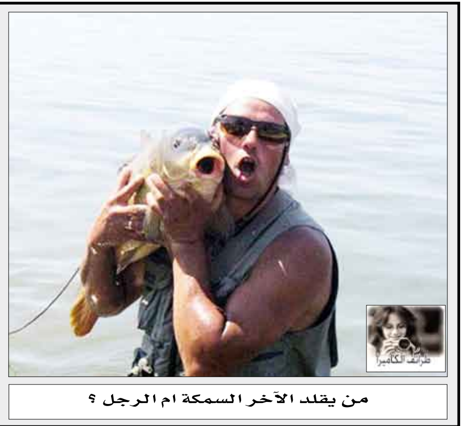
من يقلد الآخر السمكة ام الرجل ؟

تجنب الطرق المرزدجة وتنبه زملائهم للاختناقات المرورية أيضاً.