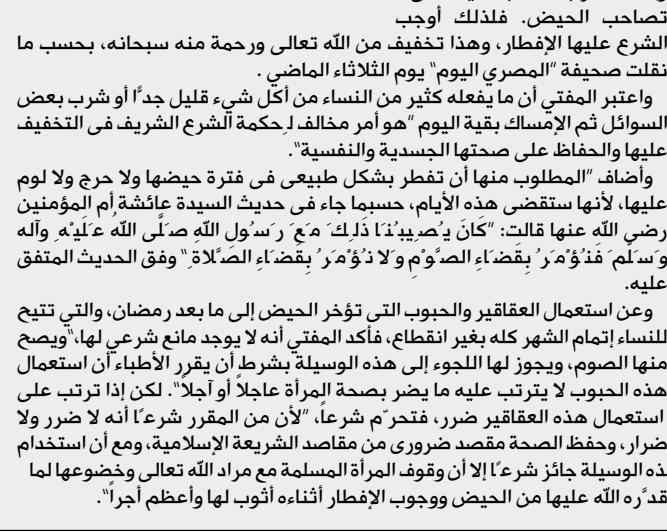
المفتي علي جمعة