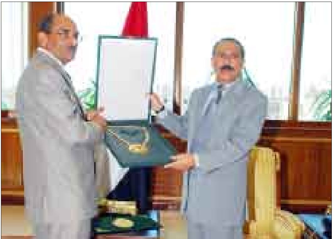
رئيس الجمهورية أثناء تسلمه قلادة العيد الـ (40) لثورة الفاتح من سبتمبر