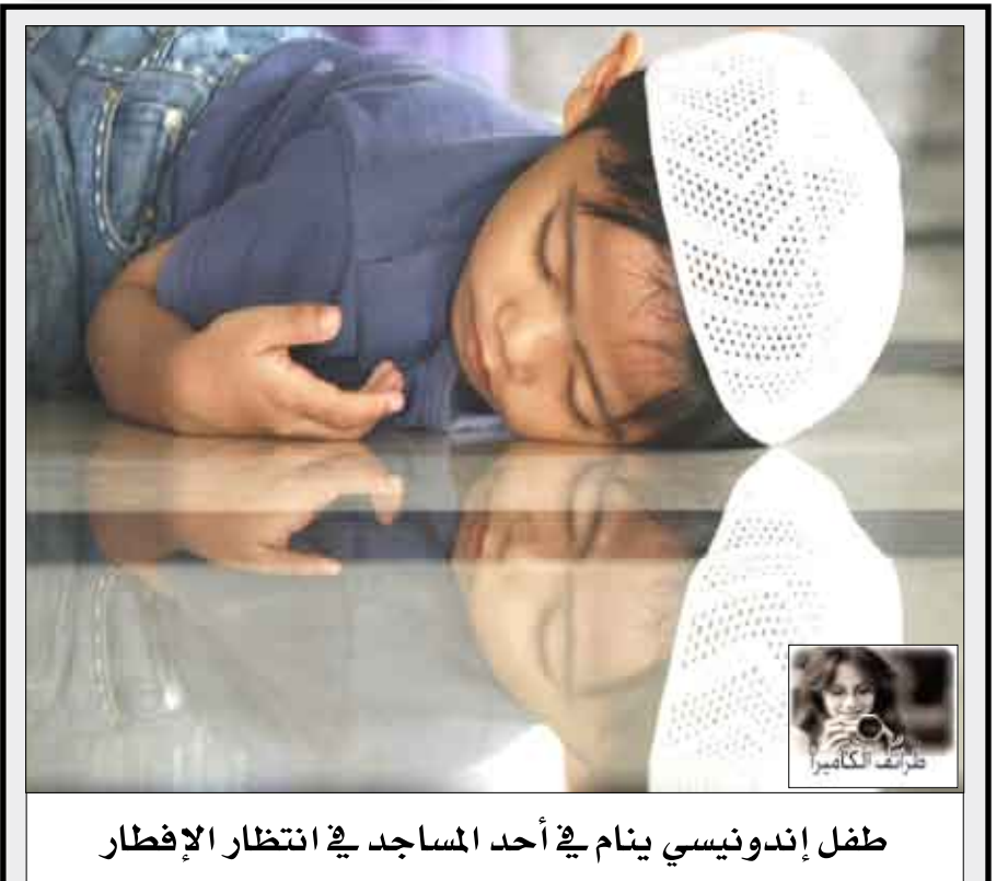
طفل إندونيسي ينام في أحد المساجد في انتظار الإفطار