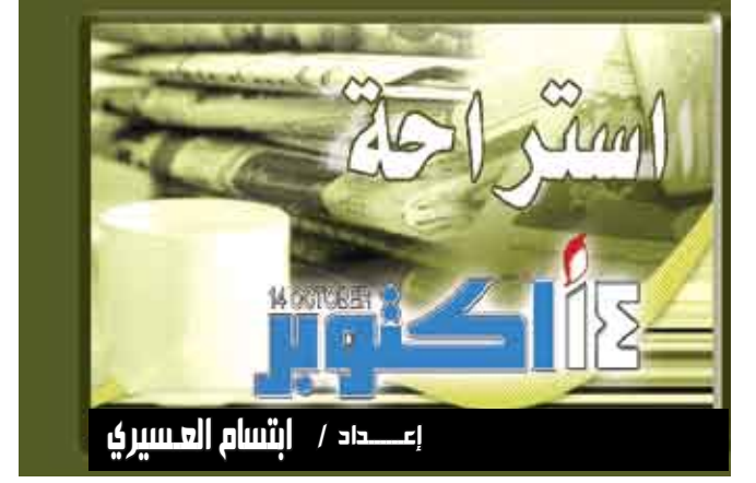
إعداد / إيتام العسيري

بروكسل / منبجات : توقف منتجو الألبان في أنحاء أوروبا عن تسليم الحليب الجمعة الماضية في إطار نزاع متصاعد بشأن انخفاض الأسعار وهو ما قد يقيد الإمدادات هذا الأسبوع. وقال مجلس الحليب الأوروبي ان منتجين من بلجيكا وألمانيا ولوكسمبورج انضموا إلى نظرائهم الفرنسيين الذين أعلنوا خطط الإضراب الخميس الماضي . وأرقت مجموعة من المنتجين البلجيكيين الحليب في ميدان رئيسي بمدينة شارليروا الجنوبية الجمعة ضمن الاحتجاج الذي شمل أيضاً سد طرق ومنع شاحنات من تسليم الحليب. وقالت متحدثة باسم مجلس الحليب الأوروبي أن منتجين هولنديين وإيطاليين يدرسون أيضاً الانضمام إلى الإضراب.