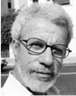
الشاعر المغربي محمد بنيس