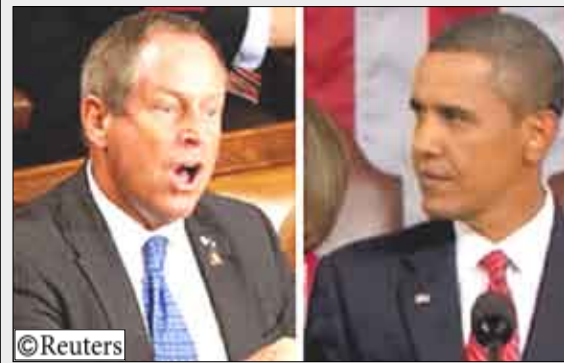
أوباما والنائب الجمهوري جو ويلسون

14 أكتوبر/ رويترز: فوجئ الرئيس الأمريكي باراك أوباما أثناء إلقاءه خطابا أمام مجلس الشيوخ بواشنطن، بأحد الحضور يقول له «أنت تكذب!!» ما أثار حرجا بالاقاعة، حيث توجه أوباما بنظرة متوترة إلى مصدر الصوت وعالج الموقف بهدوء قائلا «هذا ليس صحيحا».