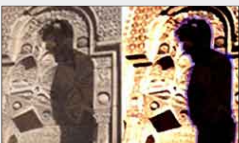
الظل وقت تكونه قبيل صلاة العصر

أنقرة / متابعة: قبل نحو نصف ساعة من رفع أذان العصر انسحب ظل فوق الباب الغربي لجامع أولو ديفري في قرية محافظة "سواس" بوسط تركيا، لشخص منتصب القامة، محني الرأس في خشوع، ويقرا من كتاب مفتوح أمامه وكانه القرآن الكريم.