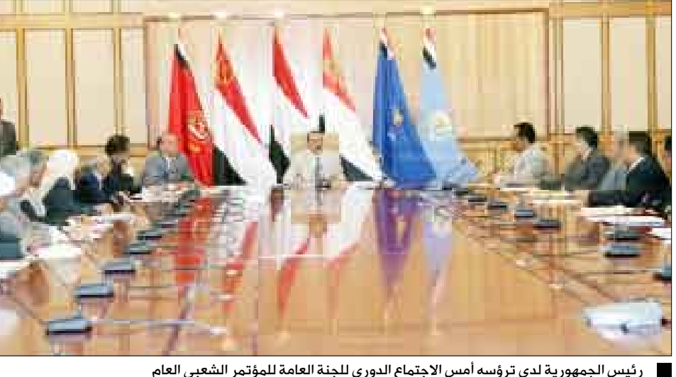
رئيس الجمهورية لدى ترؤسه أمس الاجتماع الدوري للجنة العامة للمؤتمر الشعبي العام