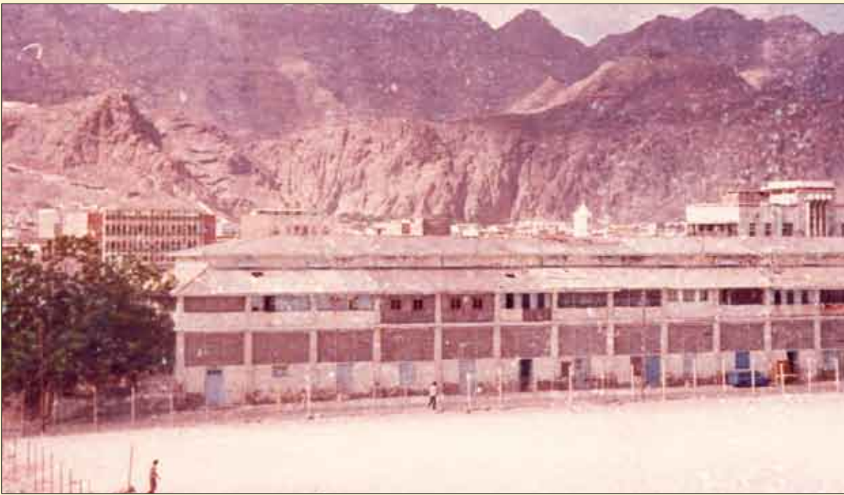
منظر عام لجبل شمسان أمام قصر السلطان