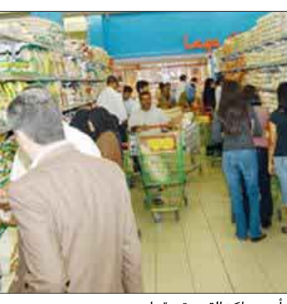
أحد مراكز التسوق بقطر

وأضاف قائلاً: «نرى أن مثل هذه الآلية ستحد من أي طلبات غير مبررة لرفع الأسعار بعد الانتهاء من إطارها التشريعي». كما أكد مدير إدارة حماية المستهلك أن الإدارة قامت بعمل تقييم مبدئي للأسبوع الماضي لقائمة أسعار آباء 104، سلع غذائية التي تم تحديدها من قبل وزارة الأعمال والتجارة لتطبيقها خلال شهر رمضان المبارك، حيث تم عمل جولات تفتيشية على المجمعات التجارية الكبرى في دولة قطر، وتم رصد نسب التزام طيبة من قبل المشاركين في تطبيق القرار الوزاري.