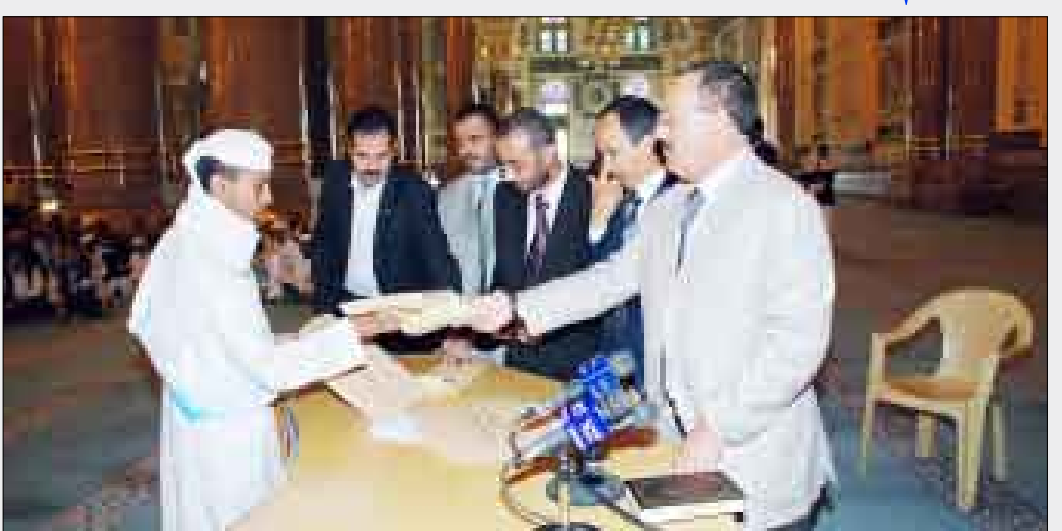
الرئيس يكرم أحد الفائزين بمسابقة الأوقاف لحفظ القرآن الكريم / أمس

العاصمة. منوهاً بما حققته الثورة اليمنية في القضاء على الأفكار المنطقية والمذهبية، ورفض العنف والإرهاب والأفكار التكفيرية والتخريبية المظلمة، ونشر التعليم الفني والمهني وغيره من مجالات التعليم التي تسهم في خدمة وتنمية المجتمع بمختلف المجالات. وشدد رئيس الجمهورية على ضرورة نشر وتبسيط وترسيخ الوحدة الوطنية وغرس مبدأ الولاء وحب الوطن والحفاظ عليه في نفوس الشباب من خلال نشر تعاليم الإسلام السحابة المبنية على الوسطية والاعتدال.