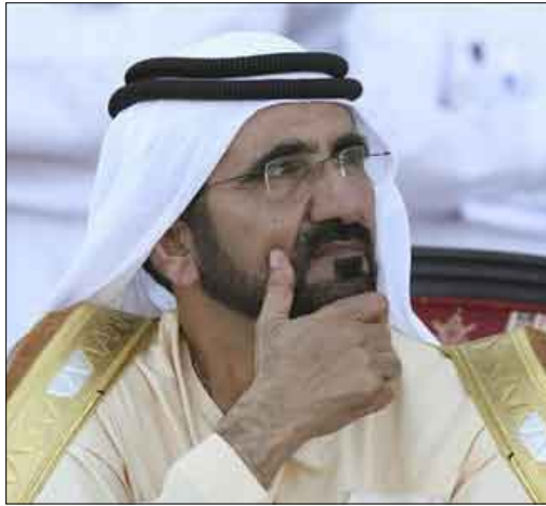
حاكم دبي الشيخ محمد بن راشد آل مكتوم

الآلاف من العمال المغتربين. وذكر الشيخ محمد وهو أيضاً رئيس وزراء الإمارات أن دبي ستكون أكثر تدقيقاً بشأن تنفيذ المشروعات الصائبة في المستقبل. والشركات المرتبطة بالإمارة والدولة لديها ديون قائمة تبلغ حوالي 80 مليار دولار وتراكم كثير منها حين كانت دبي تسعى لتوسيع أنشطتها في مجالات الإمداد والتمويل والخدمات المالية والعقارات والسياحة.