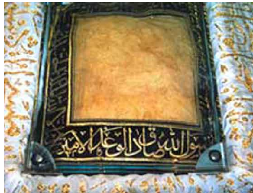
عبادة المصطفى صلى الله عليه وسلم مطوية داخل حاخظة

المهمة الكبيرة، وأصناف أنه: "بعدما لاحظ المشرفون على تخزين العبادة ما ألمّ بطيانتها، سارعوا إلى إخطار محافظة إستانبول في نوفمبر الماضي، طالبين منها سرعة مد يد المساعدة لترميمها". وفي إشارة لسبب تأخر عملية الترميم طوال الشهور الماضية قال المفتي: "لعملة العبادة ومكانتها الخلية في نفوسنا فإننا لن نعهد بترميمها إلى أحد سوى من نثق في قدرته على إصلاحها دون المس بقيمته الأثرية، ووجدنا أنها بحاجة إلى خبير متخصص بشكل دقيق، ويتمتلك مهارة فائقة للأصطلاح بهذه العبادة، ولكن بسبب ظروف تتعلق بدرجة الحرارة والرطوبة والإضاءة الموجودة في الجناح المحفوظة فيه العبادة"، لافتا إلى أن الخبراء سوف "يعملون على تحسين ظروف حفظها". ومن العادات الشهيرة عند الأتراك في الشهر المعظم توافدهم من كل أنحاء الدولة لزيارة جامع الخرقة الشريفة، المسمى باسم العبادة، بحي الفاتح في إستانبول، والمحفوظة بداخله في جناح مميز، وهذا الجناح لا يفتح إلا في النصف الثاني من شهر رمضان، للمساهمة في التعبئة الإيمانية التي يقبض بها الشهر الكريم في هذه الأيام؛ حيث يتوافد إليها الحشود الغفيرة كل يوم لإلقاء نظرة. وأضادت تركيا بنور هذه العبادة ومقتنيات نبوية أخرى على يد السلطان العثماني سليم الأول في القرن السادس عشر الميلادي، وذلك