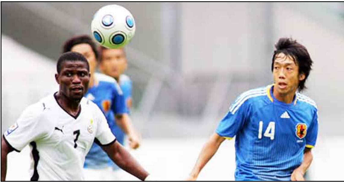
3 أوديا السبت الماضي في انشكيد. وتعادل منتخب الصين مع نظيره السنغالي صفر-صفر في مباراة كرة القدم الدولية هارابين الصينية. وتستعد الصين لمواجهة لبنان في بيروت وبكين في 14 و22 تشرين الثاني ضمن الجولتين الثالثة والرابعة من تصفيات المجموعة الرابعة. وكانت السنغال تعادلت مع انغولا 1-1 وديا السبت الماضي في قارو.

أوتريخت- هارابين - وكالات، فاز منتخب اليابان على نظيره الغاني التي أقيمت أمس الأربعاء في أوتريخت في إطار استعدادات الأول لخوض تصفيات كأس آسيا التي تقام نهائياتها في الدوحة عام 2011، والثاني لنهائيات كأس الأمم الأفريقية في انغولا مطلع العام المقبل. وتقدمت غانا بهدفين لمهاجم رين الفرنسي سامواه جيان في الدقيقتين 30 و48، وقلصت اليابان الفارق بواسطة مهاجم اسبانيول الإسباني شونسوكي تاكامورا في الدقيقة 53، بيد أن مهاجم بريدا الهولندي ماتيو امواه أعاد الفارق إلى سابق عهده بتسجيله الهدف الثالث لغانا في الدقيقة 66. وانتفضت اليابان في الدقائق الـ15 الأخيرة ونجحت في قلب تخلفها 3-1 إلى فوز 3-4 بعدما سجلت 3 أهداف في 6 دقائق بواسطة مهاجم ناغويا غرامبوس ايت كيجي تامادا (77) ولعب وسط شيميزو بولسه شينجي اوكاواكي (80) ومهاجم رين ايضاً جونيتشي ايناموتو (83). يذكر أن المنتخبين ضمنا معا تأهلها إلى نهائيات كأس العالم في جنوب أفريقيا العام المقبل. وكانت اليابان خسرت امام هولندا (صفر-