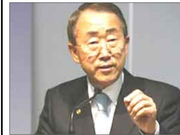
الأمين العام للأمم المتحدة خلال مؤتمر صحفي في جنيف يوم الخميس

ساهمت اجتماعات في عامي 1979 و1990 في تهيئة الطريق إلى تشكيل لجنة تابعة للأمم المتحدة لشؤون المناخ واتفاقية للأمم المتحدة بخصوص المناخ عام 1992. إلى ذلك اتفق خبراء يشاركون في محادثات تضم موفدين من 150 دولة بشأن المناخ يوم الأربعاء الماضي على قواعد إرشادية لتحسين تدفق المعلومات بشأن المناخ لمساعدة العالم على التعامل مع موجات الحر أو العواصف الرملية أو ارتفاع مستويات البحار التي يرجح أن يسببها الاحتباس الحراري. وجاء في مسودة ملخص من صفحة واحدة لمحادثات استمرت ثلاثة أيام بين 1500 خبير في مؤتمر المناخ العالمي «ستواجه شعوب العالم في القرن الحادي والعشرين تحديات التغيرات المناخية والتغير المناخي المتعددة الأوجه».