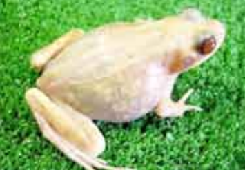
السامة على العظام والكبد او غيرها-وتمكن الباحثون من إنتاج هذه الضفدعة بعد عمليات معالجة

نجح باحثون يابانيون في توليد ضفدعة شفافة يمكن مراقبتها أعضائها من الخارج، مما يسمح بتتبع تشريحها في تجارب علمية وقال رئيس فريق الأبحاث ماسايوكي من معهد بيولوجيا الحيوانات البرمائية في جامعة هيروشيما: -يمكننا مراقبة نمو الأعضاء وحتى بداية سرطان وانتشاره- وأضاف: -من الممكن مراقبة أعضاء الضفدعة طوال حياتها دون الحاجة لتتبعها يمكن للباحثين أيضا مراقبة تأثير المواد