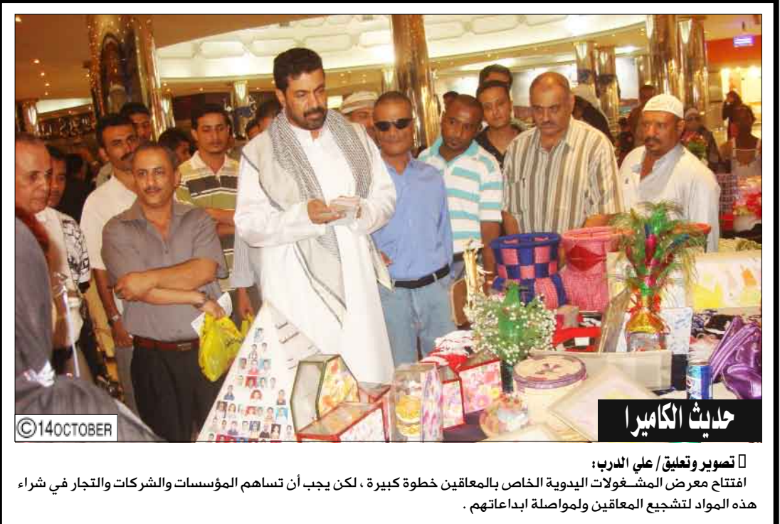
تصوير وتعليق علي الدرب: افتتاح معرض المشغولات اليدوية الخاص بالمعاقين خطوة كبيرة، لكن يجب أن تساهم المؤسسات والشركات والتجار في شراء هذه المواد لتشجيع المعاقين ولمواصله ابداعاتهم.

عند اكتمال واستخلاص الاسمين أو محتوى العمودين المذكورين أعلاه يسجل لديكم ويجمع حتى نهاية الشهر الكريم وترسل الإجابات على عناوين الصحيفة فيصبح عدد الإجابات 2x30 = 60 أسما أو محتوى. يرفق كوبون المسابقة مع كل حل شبكة حسب رقم الحلقة. الفائزون سينالون جوائز مالية مغرية.