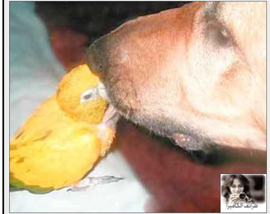
سبحان الله ....

القراء المشاركون في مسابقة الكلمات المتقاطعة «كنى» أسماء والقباب: تعمدت مسابقتنا في الأساس على حل الشبكة كما هي العادة في حل الكلمات المتقاطعة. بعد استكمال حل الشبكة سوظهر لكم محتوى العمودين الأوسطين (8أفقيا) و (8عموديا) وهما الأساس في الحل ومايزم إرساله وذلك أسهل من إرسال الشبكة كاملة.