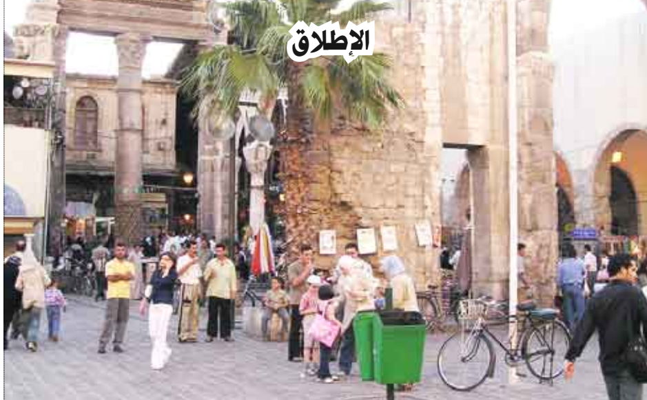
مدخل سوق الحميدية من جهة المسجد الأموي (الجهة الشرقية) وتظهر بوابة وأعمدة معبد جوبيتر

سيد الأسواق الدمشقية في دمشق والشرق على الإطلاق