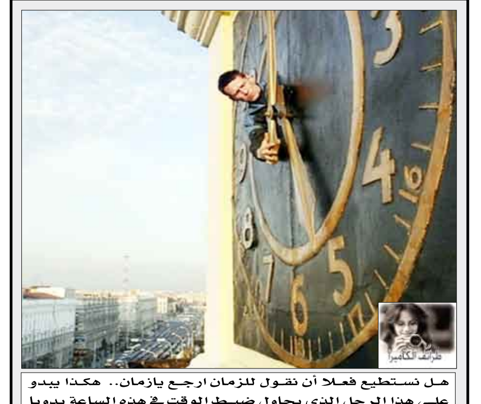
هل نستطيع فعلاً أن نقول للزمان ارجع يا زمان.. هكذا يبدو على هذا الرجل الذي يحاول ضبط الوقت في هذه الساعة يدويا

عند اكتمال واستخلاص الاسمين أو محتوى العمودين المذكورين اعلاه يسجل لديكم ويجمع حتى نهاية الشهر الكريم وترسل الاجابات على عناوين الصحيفة فيصحب عدد الاجابات 30 = 60 اسماً أو محتوى. يرفق كويون المسابقة مع كل حل شبكة حسب رقم الحلقة. الفائزون سيتولون جوائز مالية مغرية.