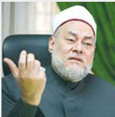
الشيخ علي جمعة

القاهرة / منوعات أكد الدكتور علي جمعة مفتي الديار المصرية أن الإفتاء ليس بحاجة إلى رخصة من جهة الفتوى الرسمية بالبلاد، معتبراً أن الفتوى حق لكل أساتذة الفقه والشريعة. وقال الدكتور جمعة مساء الأربعاء خلال كلمته بملتقى الفكر الإسلامي الذي يقامه المجلس الأعلى للشؤون الإسلامية بساحة مسجد الحسين تعليقاً على قيام دار الإفتاء بإعطاء رخصة لمن يفتي: "إن الفتوى لا تحتاج إلى رخصة".