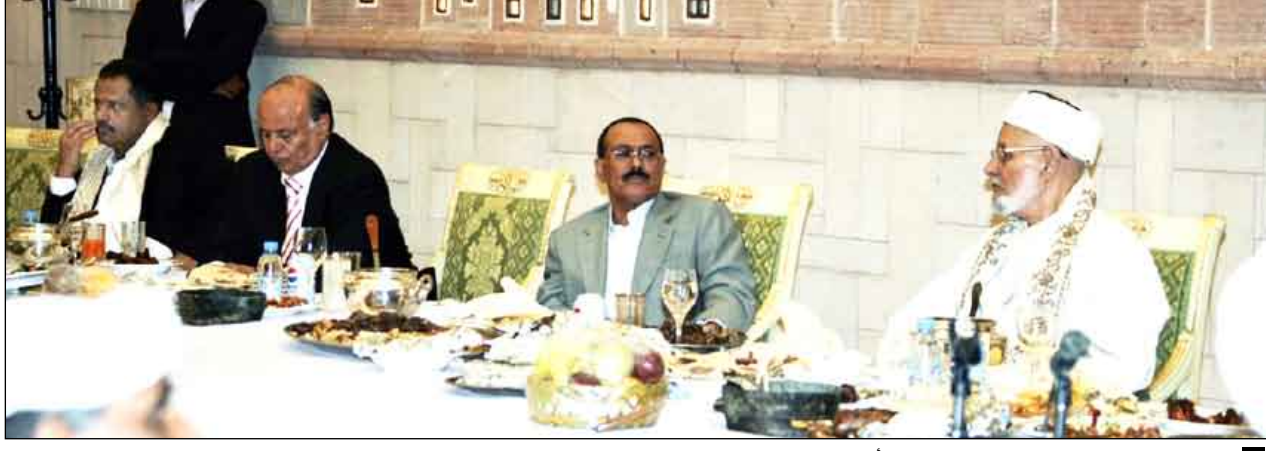
رئيس الجمهورية لدى لقائه فضيلة العلماء أمس

الدخيلة على مجتمعنا والتي تتنافى مع مبادئ ديننا الإسلامي الحنيف وقيمه ونهجه الذي يقوم على الوسطية والاعتدال. وجرى خلال اللقاء تبادل التهاني بمناسبة الشهر الكريم، سائلين المولى عز وجل أن يعيد هذا الشهر الفضيل على شعبنا وامتنا العربية والإسلامية باليمن والخير والبركات. (التفاصيل ص 3)