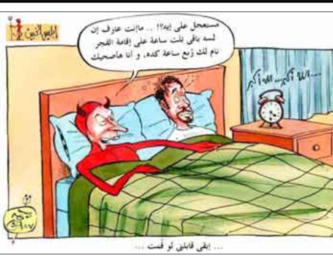
... يعني قائل لو كنت ...

وفيما يتعلق بالزكاة في أموال الفصّر، أوضح المفتي أنه تجب الزكاة في أموال الأيتام والقصر المحبوسة بأمر المجلس الحسبي، ما دامت هذه الأموال بلغت النصاب.