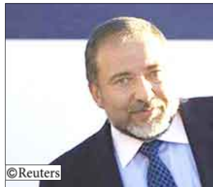
وزير الخارجية الإسرائيلي أفيدجور ليرمان أثناء احتفال في مستوطنة ارييل اليهودية بالضفة الغربية يوم 23 أغسطس

دعا وزير الخارجية الإسرائيلي أفيدجور ليرمان إفرقيا أمس الأربعاء إلى المساعدة في تعزيز السلام في الشرق الأوسط وذلك بعد يوم من دعوة رئيس الاتحاد الإفريقي الزعيم الليبي معمر القذافي دول القارة إلى إغلاق سفارات إسرائيل. وأوضح ليرمان في اجتماع لرجال أعمال بالعاصمة الإثيوبية أديس أبابا «علاقات إفريقيا مع الدول العربية والإسلامية تضع دول إفريقيا في موقف للإسهام بنفوذ إيجابي». وأضاف «نحن نتطلع إلى إفريقيا للدعوة إلى الاعتدال والمصالحة في الشرق الأوسط». وكان القذافي قد أبلغ اجتماع قمة للاتحاد الإفريقي في طرابلس بأن إسرائيل تثير الصراعات في القارة وأنه ينبغي إغلاق سفاراتها في إفريقيا. ويبدأ ليرمان ووفد من رجال الصناعة الإسرائيليين نصفهم مختص بالدفاع زيارة لإثيوبيا يوم أمس الأربعاء في إطار جولة تشمل أيضا كينيا وأوغندا ونيجيريا وغانا. وأكد ليرمان «من المهم للغاية في إطار الاتحاد الإفريقي أن تعكس قرارات ونشاطات الدول الإفريقية تناولا إيجابيا وبناء