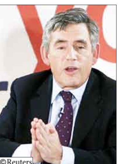
رئيس الوزراء البريطاني

لندن 14 أكتوبر/ رويترز : أكد رئيس الوزراء البريطاني جوردون براون أمس الأربعاء إن حكومته لم تضغط على اسكتلندا من أجل الإفراج المبكر عن مفجر لوكربي لتحسين العلاقات التجارية بين بريطانيا وليبيا. وكان عبد الباسط المقرحي الذي يشرف على الموت بسبب مرضه بسرطان البروستاتا نقل إلى ليبيا في الشهر الماضي. وأغضب الإفراج عن المقرحي الأمريكي والكثير من أقراب الضحايا وتسبب في اتهامات بأن بريطانيا ضغطت على الحكومة الاسكتلندية لإطلاق سراحه لمساعدة الشركات البريطانية في تأمين صفقات تجارية مع ليبيا. وأوضح براون أنه أوضح للزعيم الليبي معمر القذافي إن قرار الإفراج عن المقرحي هو شأن الحكومة الاسكتلندية. واسكتلندا لها نظامها القضائي الخاص بها وتضع سياساتها بنفسها. وأضاف براون في قمة التوظيف في برنامجها بوسط إنجلترا "من جانبنا لم تكن هناك أي مؤامرة أو تغطية أو خداع أو اتفاق نفي أو محاولة لتوبيخ الوزراء الاسكتلنديين أو تأكيد من جانبي بصفة شخصية للتقيد (معمر) القذافي". والمقرحي هو الشخص الوحيد الذي أدين في تفجير طائرة ركاب تابعة لشركة بان أمريكان فوق بلدة لوكربي الاسكتلندية ما أسفر عن مقتل 270 شخصا عام 1988. وأفرجت عنه اسكتلندا لأسباب إنسانية الشهر الماضي. وتعرضت الحكومة الاسكتلندية لانتقادات بسبب قرارها السماح للمقرحي بالعودة إلى ليبيا وخسرت تصويتا في البرلمان الاسكتلندي بواقع 73 صوتا مقابل 50. لكن هذه الهزيمة لن تسقط الحكومة. وقال وزير الخارجية البريطاني ديفيد ميليباند إن بريطانيا أبلغت ليبيا أنها لا تريد لعبد الباسط المقرحي أن يموت في السجن ولكنه نفي