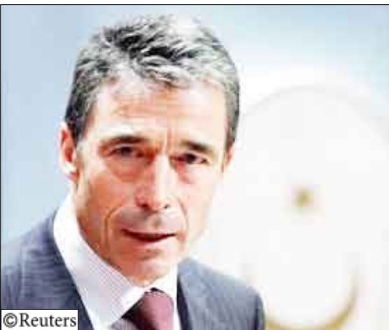
اندرس فوج راسموسن